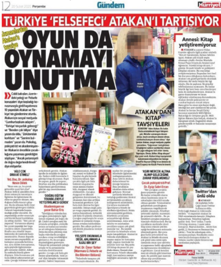
Figure 3: Felsefeye meraklı 10 yaşındaki çocuğun ismi ve fotoğrafı açık olarak yayımlanmış, haberlerin ardından çocuk sosyal medyada siber zorbalığa maruz kalmıştır.