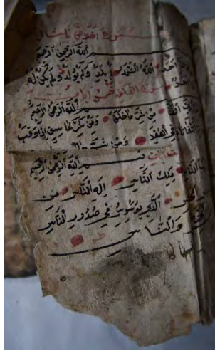
Resim 5e: 5 numaralı yazma sonradan ilave edilen sayfalar