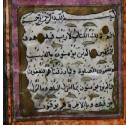
Resim 10f: 10 numaralı yazma serlevha