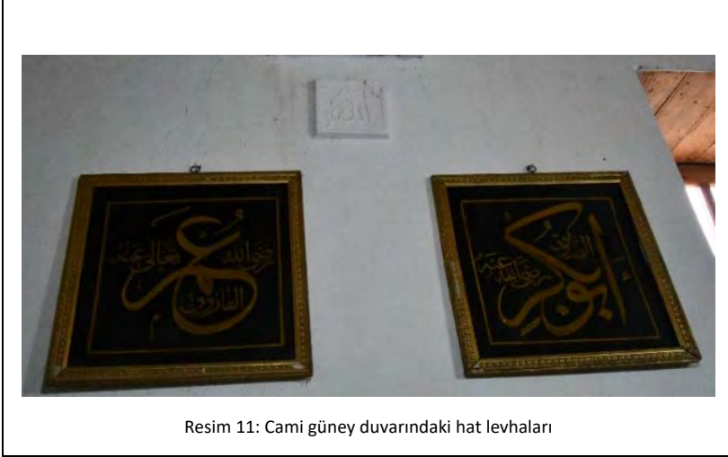
Resim 11: Cami güney duvarındaki hat levhaları