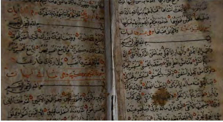
12d: 12 numaralı yazma iç sayfalar