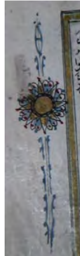
Resim 4d: 4 numaralı yazma iç sayfada cüz gülü