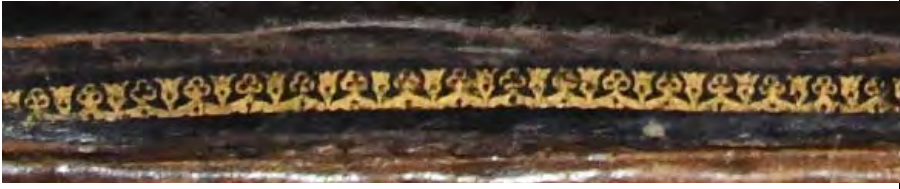
Resim 1c: 1 numaralı yazma kapak süsleme detayı