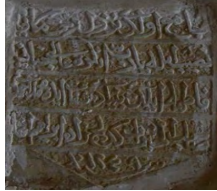
Resim 4: Harim giriş kapısı üzerindeki kitabe