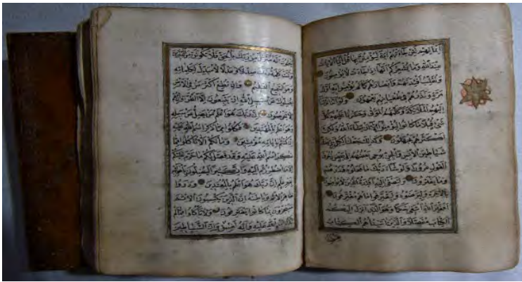
15c: 15 numaralı yazma iç sayfalar