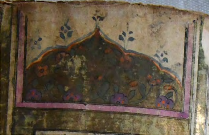
15f: numaralı yazma serlevhada mihrabiye bölümü