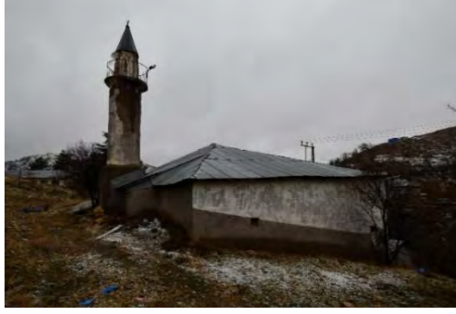
Resim 7: Cami kuzeydoğu cephe

Caminin güneyinde harap bir durumda olan büyük bir hazire bulunmaktadır. Hazireden günümüze kırık ve dağınık durumda birkaç mezar taşı gelebilmiştir. Sağlam kalan tek bir mezar taşı üzerinde ise H.1262 /M.1846 tarihi yazılıdır (Resim 9).