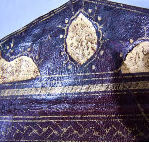
Resim 2c: 2 numaralı yazma kapak kısmından detay