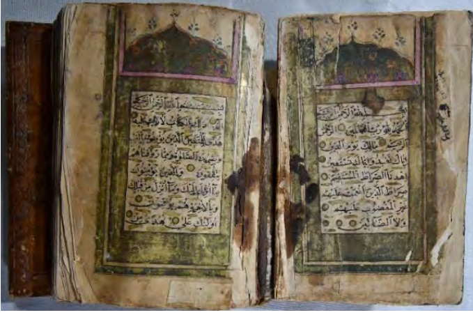
15e: numaralı yazma serlevha bölümü