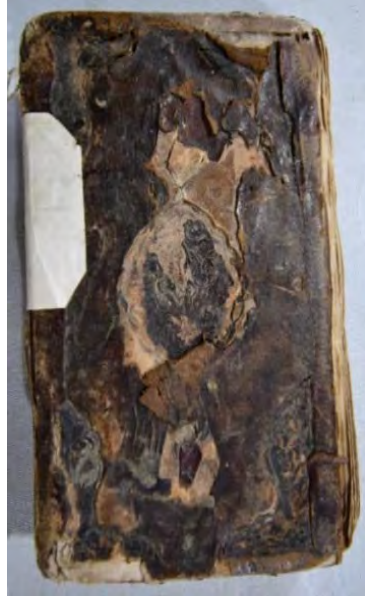
Resim 10b: 10 numaralı yazma arka kapak