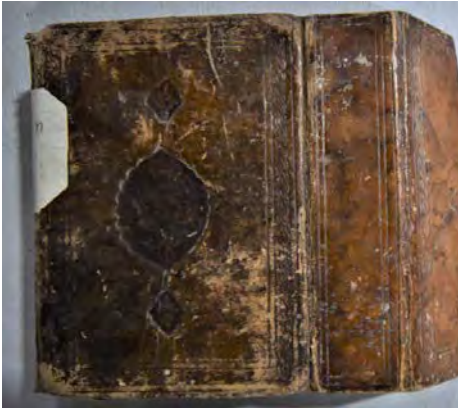
15a: 15 numaralı yazma arka kapak