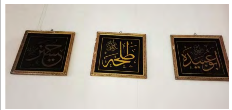
Resim 10: Cami batı duvarındaki hat levhaları