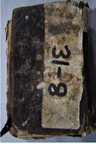
11a: 11 numaralı yazma ön kapak