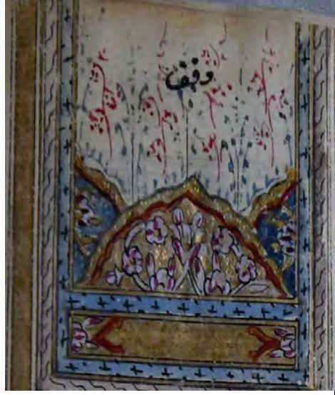
Resim 2f: 2 numaralı yazma ve serlavha detay