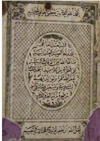
13g: 13i numaralı yazma hatime sayfası