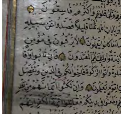
Resim 6e: 6 numaralı yazma da ayet ve