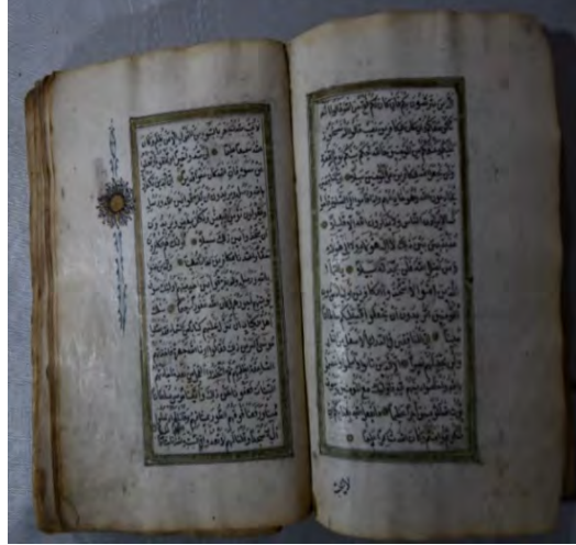
Resim 4b: 4 numaralı yazma iç sayfada aşere gülü