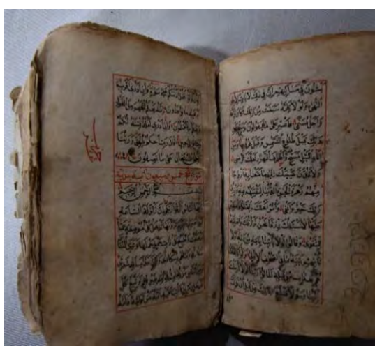
Resim 8b: 8 numaralı yazma iç sayfalar