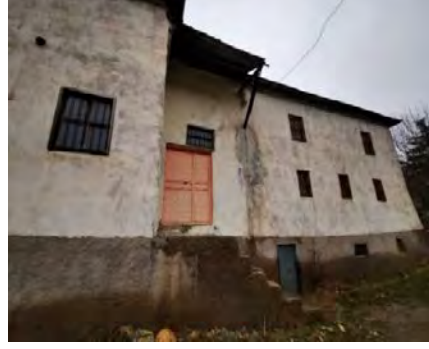
Resim 2: Camiye girişi sağlayan ilk kapı