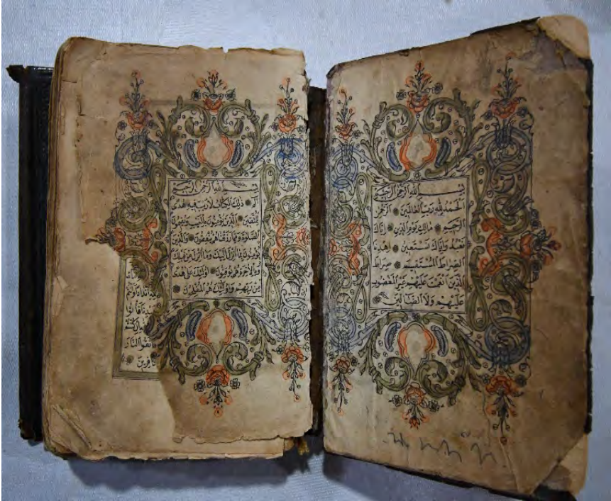
13g: 13 numaralı yazma serlevha süslemesi