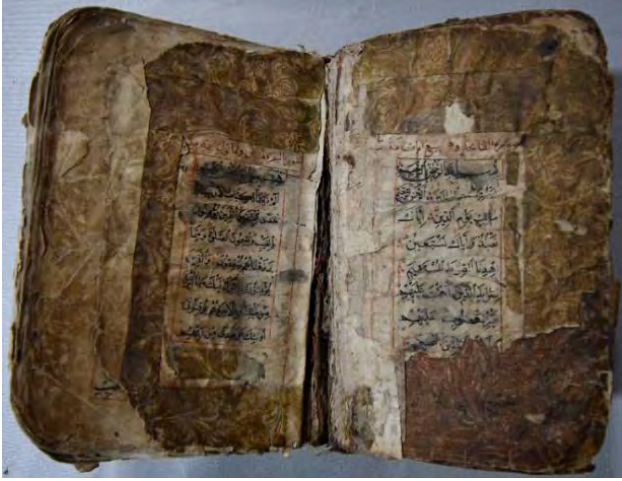
Resim 8c: 8 numaralı yazma serlevha bölümü