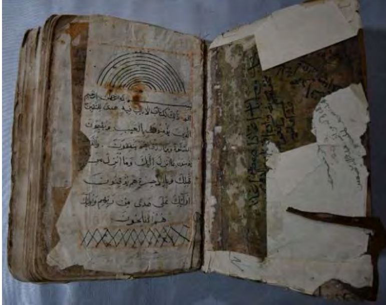
12c: 12 numaralı yazma serlevha bölümü