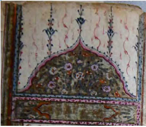
14f: 14 numaralı yazma serlevhada mihrabiye bölümü