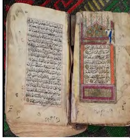
Resim 3e: 3 numaralı yazma serlevha bölümü