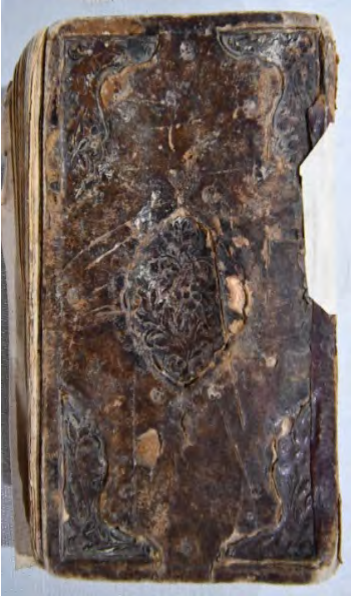
Resim 10a: 10 numaralı yazma ön kapak