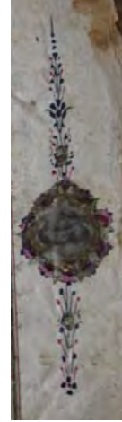
14g: 14 numaralı yazma serlevhada cüz gülü