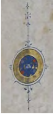
Resim 1g: 1 numaralı yazma cüz gülü