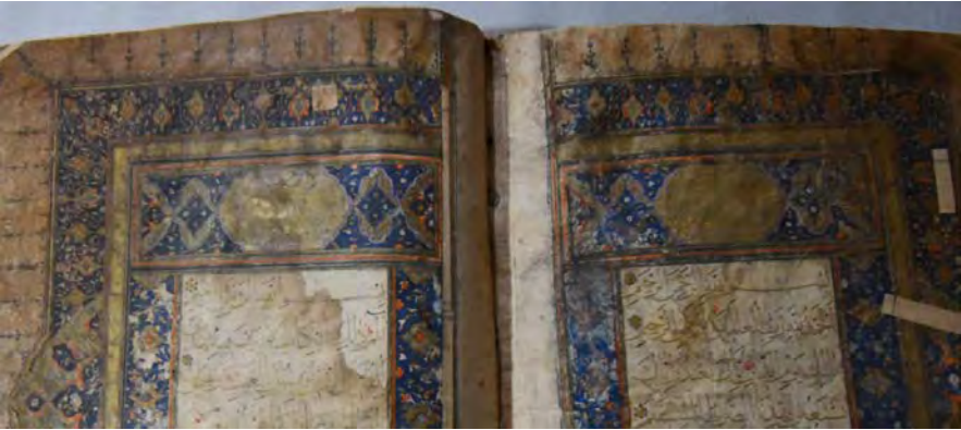
Resim 1d: 1 numaralı yazma serlevha süsleme detayı