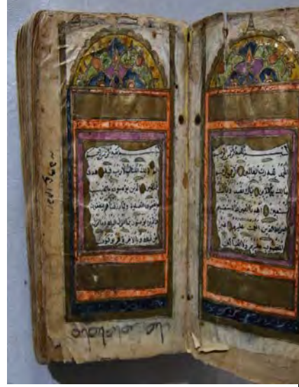
Resim 10d: 10 numaralı yazma serlevha bölümü