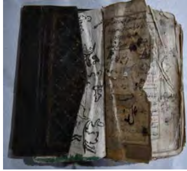
Resim 7b: 7 numaralı yazma iç sayfalar