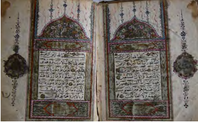
14e: 14 numaralı yazma serlevha bölümü