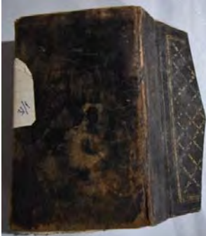
Resim 7a: 7 numaralı yazma arka kapak