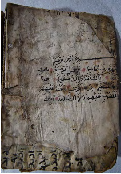
Resim 5c: 5 numaralı yazma serlevha bölümü