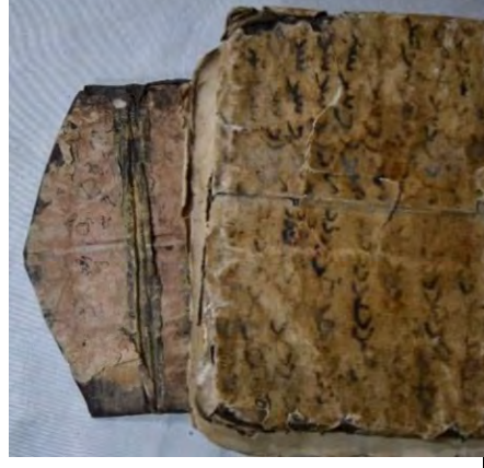
Resim 5b: 5 numaralı yazma ön kapak