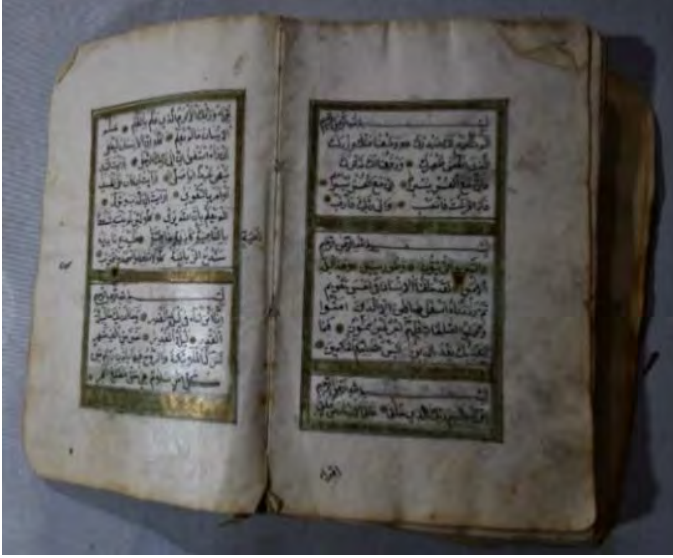
Resim 4e: 4 numaralı yazma iç sayfalar