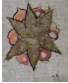
15g: 15 numaralı yazma cüz gülü