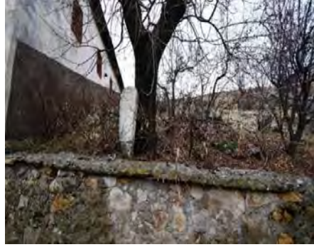
Resim 9: Cami Haziresi