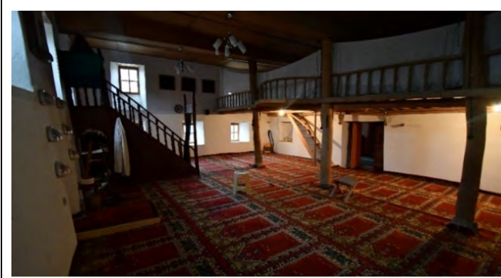
Resim 7: Harim ve kadınlar mahfili.

Caminin mihrap ekseninde kadınlar mahfiline yer verilmiştir. Harimde üst örtü, üzerine kadınlar mahfilinin de oturtulduğu üç ahşap direk taşınmaktadır. Asıl ibadet mekânını oluşturan bu bölüm beşi batı duvarında, üçü de mihrap duvarında olmak üzere toplam sekiz adet dikdörtgen formlu ahşap pencere ile aydınlatılmaktadır (Resim 7).