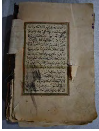
Resim 6b: 6 numaralı yazma iç sayfa