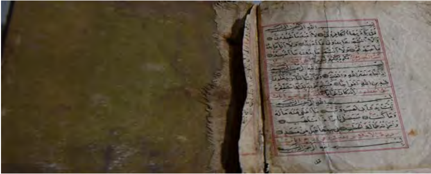
14h: 14 numaralı yazma iç sayfa