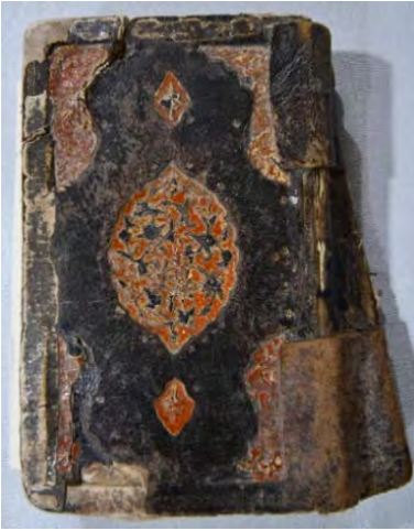
Resim 3a: 3 numaralı yazma ön kapak