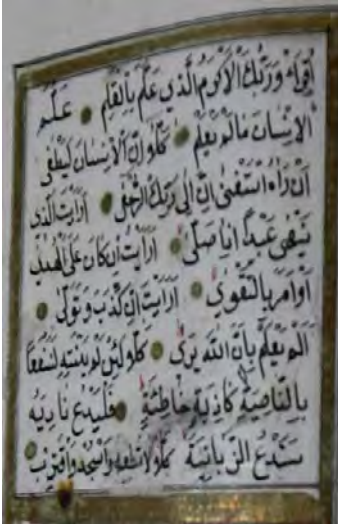
Resim 4c: 4 numaralı yazma iç sayfada ayet gülleri