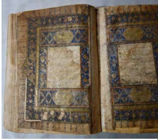
Resim 1b: 1 numaralı yazma serlevha bölümü