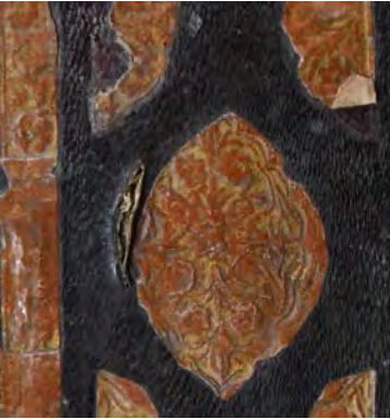
Resim 6d: 6 numaralı yazma kapak tezminatı