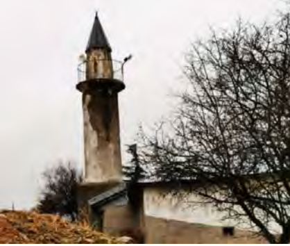
Resim 8: Cami minaresi