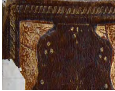
Resim 2b: 2 numaralı yazma kapak kısmında zencirek motifi