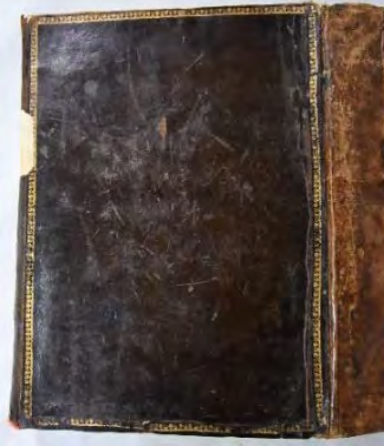
Resim 1a: 1 numaralı yazma arka kapak