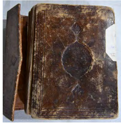
15b: 15 numaralı yazma ön kapak