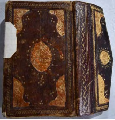
Resim 2a: 2 numaralı yazma ve arka kapak