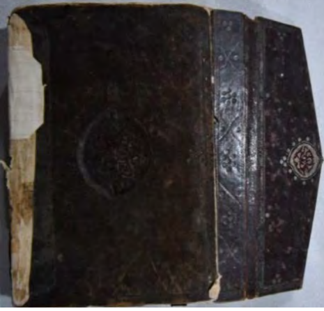
14a: 14 numaralı yazma arka kapak