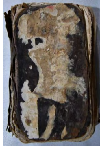
11b: 11 numaralı yazma arka kapak