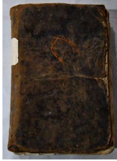
12b: 12 numaralı yazma arka kapak