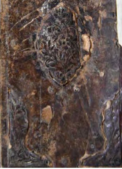
Resim 10c: 10 numaralı yazma kapak süslemesi