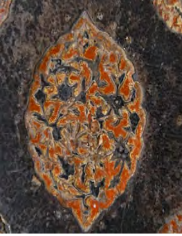
Resim 3d: 3 numaralı yazma şemse motifi detay