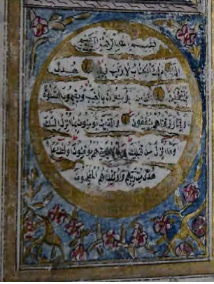
Resim 2e: 2 numaralı yazma ve serlavha detay