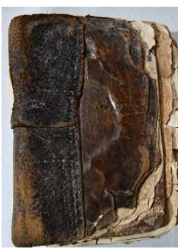
Resim 8a: 8 numaralı yazma arka kapak