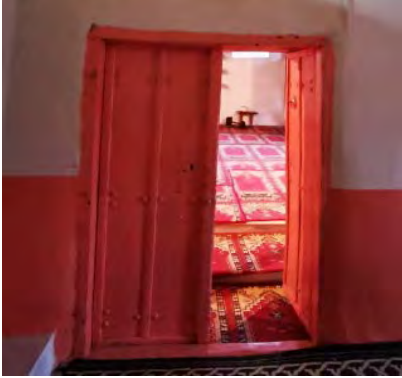
Resim 3: Harim giriş kapısı