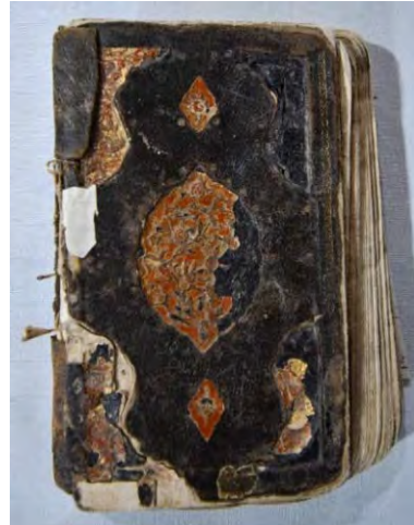
Resim 3b: 3 numaralı yazma arka kapak