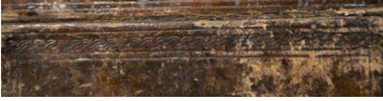
15d:15 numaralı yazma kapakta zencirek motifi