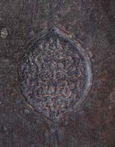
14c: 14 numaralı yazma kapakta şemse motifli