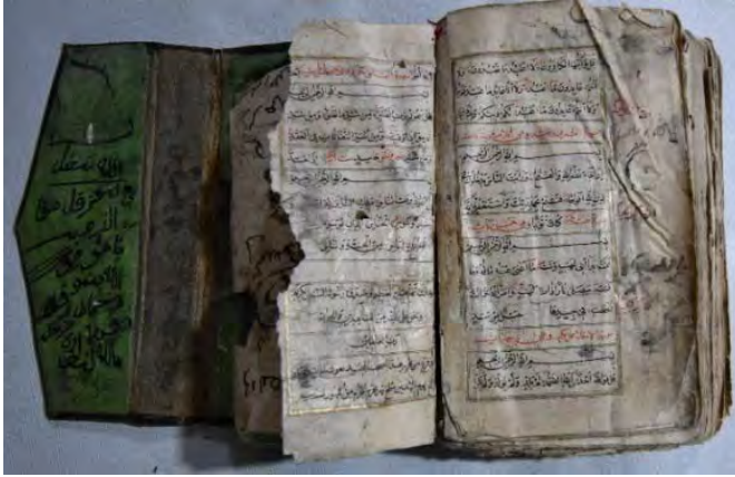
Resim 7d: 7 numaralı yazma iç sayfalar