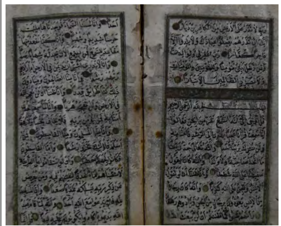
Resim 10g: 10 numaralı yazma iç sayfalar