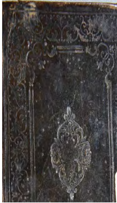
13d: 13 numaralı yazma kapak süslemesi