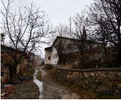
Resim 1: Cami genel görünüş