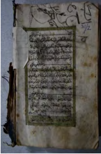
Resim 4a: 4 numaralı yazma iç sayfa