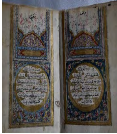
Resim 2d: 2 numaralı yazma ve serlavha bölümü