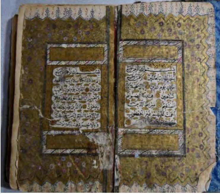
9c: 9 numaralı yazma serlevha bölümü