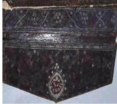
14d: 14 numaralı yazma kapakta mikleb ve sertâb tezyinatı