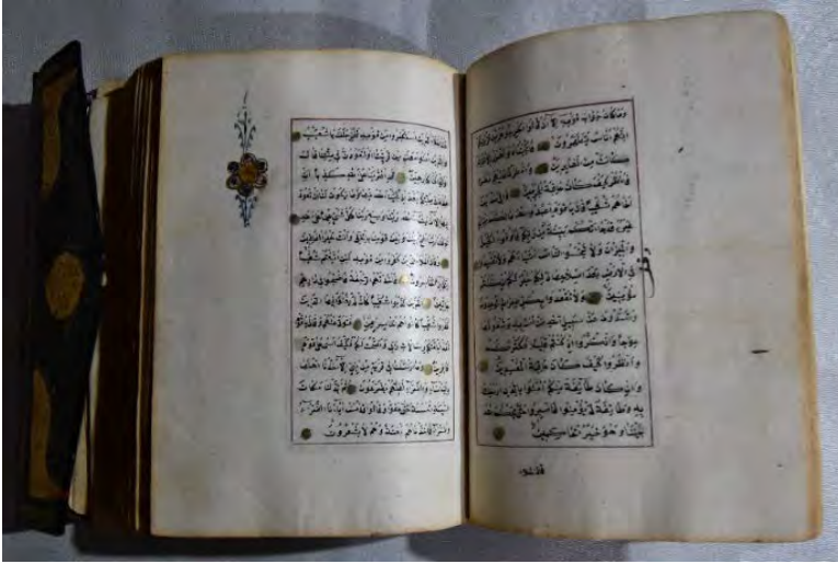
Resim 2g: 2 numaralı yazma iç sayfada cüz gülü