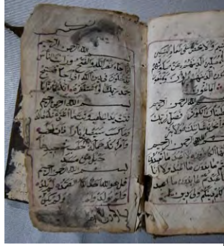
11e: 11 numaralı yazma iç sayfalar