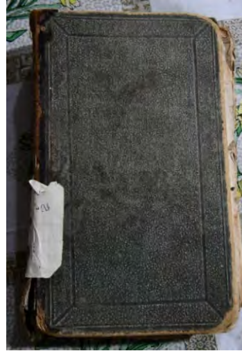
Resim 9b: 9 numaralı yazma arka kapak