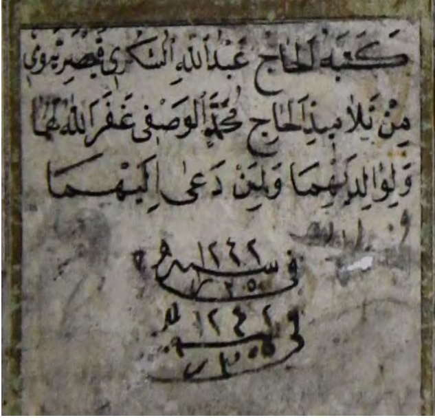
9f: 9 numaralı yazma hatime sayfası