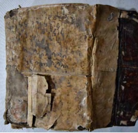
Resim 5a: 5 numaralı yazma arka kapak