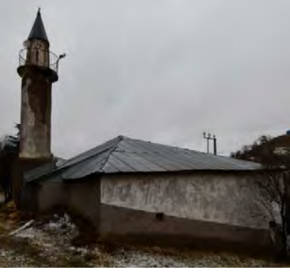
Resim 5: Cami ve sac örtüsü