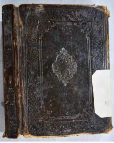
13a: numaralı yazma arka kapak