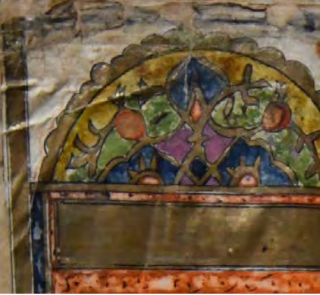
Resim 10e: 10 numaralı yazma serlevha süslemesi