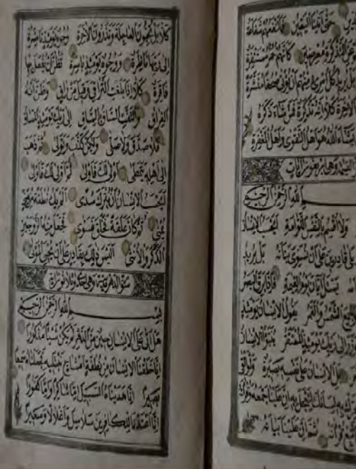
13c: 13 numaralı yazma iç sayfalar