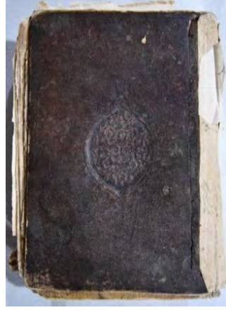
14b: 14 numaralı yazma ön kapak