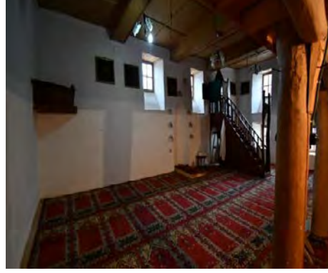
Resim 6: Cami harim mekânı ve kontrplâk tavan

Caminin mihrap ekseninde kadınlar mahfiline yer verilmiştir. Harimde üst örtü, üzerine kadınlar mahfilinin de oturtulduğu üç ahşap direk taşınmaktadır. Asıl ibadet mekânını oluşturan bu bölüm beşi batı duvarında, üçü de mihrap duvarında olmak üzere toplam sekiz adet dikdörtgen formlu ahşap pencere ile aydınlatılmaktadır (Resim 7).