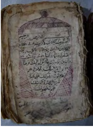
11d: numaralı yazma serlevha bölümü