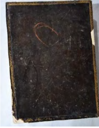
Resim 1e: 1 numaralı yazma ön kapak