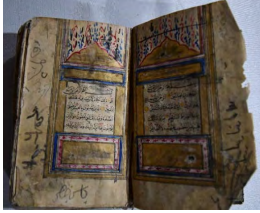
Resim 7c: 7 numaralı yazma serlevha bölümü