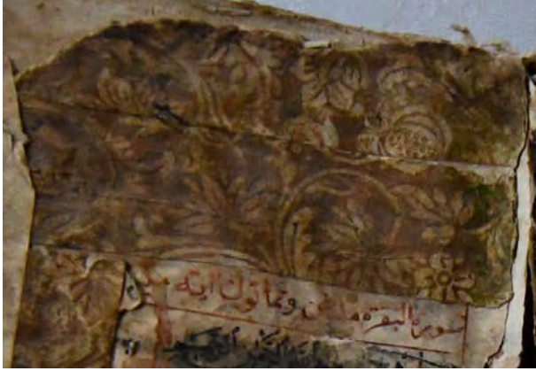
Resim 8d: 8 numaralı yazma serlevha tezyinatı