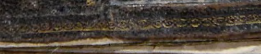
Resim 3 c: 3 numaralı yazma kapak üzerinde zencirek motifi