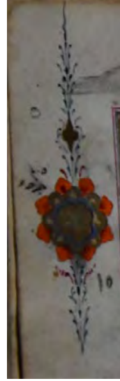
9e: 9 numaralı yazma cüz gülleri