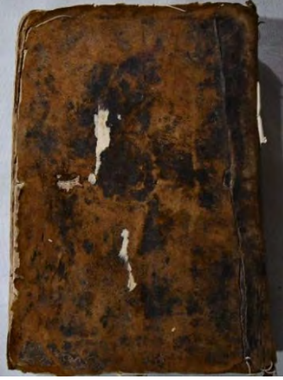
12a: 12 numaralı yazma ön kapak