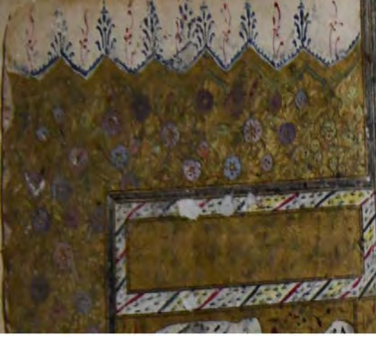
9d: 9 numaralı yazma serlevha süslemesi