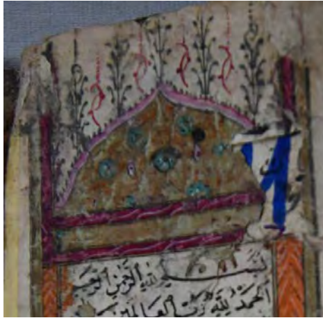
Resim 3f: 3 numaralı yazma serlevhada mihrabiye detayı