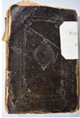
13b:13 numaralı yazma ön kapak