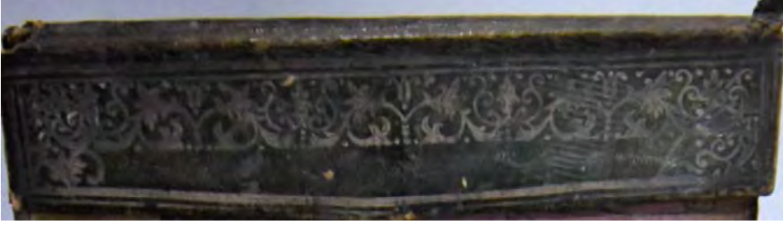
13e: 13 numaralı yazma mikleb süslemesi