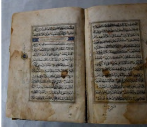
Resim 1f: 1 numaralı yazma iç sayfalar