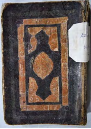
Resim 6a: 6 numaralı yazma ön kapak