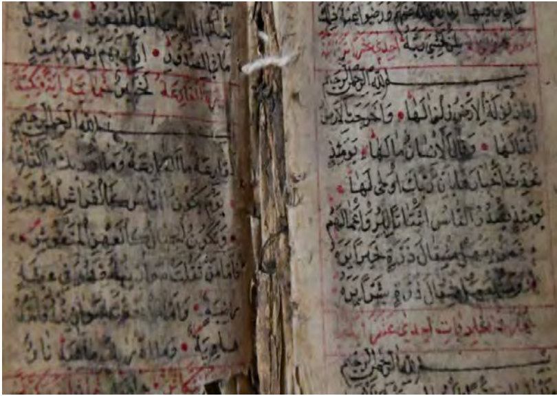
11c: 11 numaralı yazma iç sayfalar