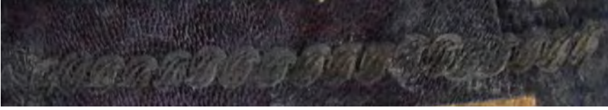
Resim 6c: 6 numaralı yazma ön kapakta zencirek motifi