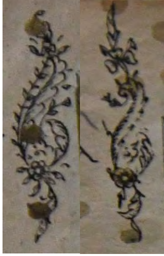
13h: 13 numaralı yazma cüz gülleri