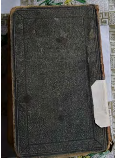
Resim 9a: 9 numaralı yazma ön kapak