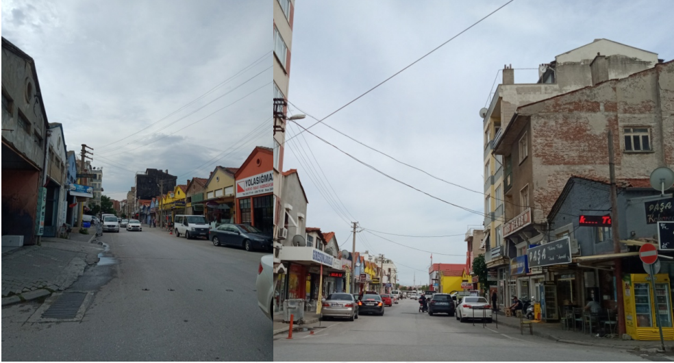
Foto 1. X Kafe ile TTM arasındaki güzergâhta yer alan oto bakım ve yıkamacılar (23 Haziran 2020)

Etrafındaki oto yıkama ve bakım hizmetleri, erkek egemen kullanım alanları olması bakımından kadınların mekânsal hareketliğini kısıtlayıcıdır. K1'in anlatısında, kafenin çevresindeki ulaşım olanakları (TTM, Kırsal Mahalle Durakları) ise erişimi destekleyici olmaya işaret etmektedir.