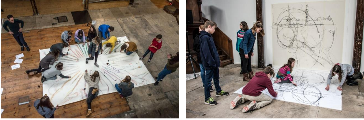
Resim 9. Çocuklarla Draw To Perform Atölyeleri, https://drawtoperform.com/children/ (Erişim tarihi: 12.03.2021)