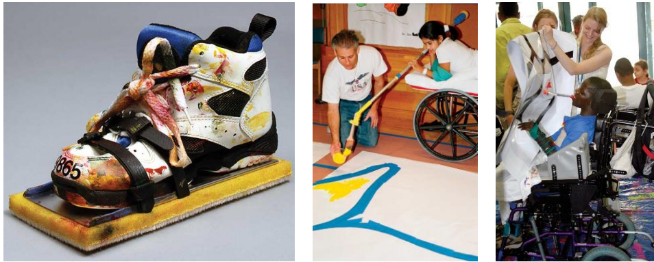
Resim 13.a. Ayakkabı Fırçası, b. Teleskop Fırça Kullanımı, c. Ağız Fırça Kullanımı https://www.portraitsofhope.org/creative-therapy/ , (Erişim Tarihi:23.03.2021)