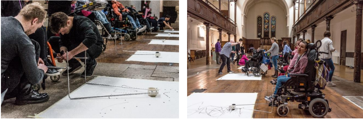
Resim 10.a. Chailey Heritage School Hanbury Bölümü öğrencileri (2018), b. enAball Projesi, Fabric Galeri’de, https://www.chf.org.uk/enaball.html , (Erişim tarihi: 17.03.2021)

Bu projelerde gözlemlendiği üzere sanatsal deneyimler sırasında deneysel arayışlar devreye girdiğinde sanatın eleştirel, sorgulayan, karşı ve muhalif yönü adeta bir tarafa itilmekte, özünde bulunan oyunusal ve terapatik yönü güçlenerek ortaya çıkmaktadır.