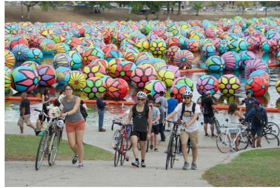
Resim 14.a. Portraits Of Hope Projesi kapsamında boyanan bir uçak görseli, https://www.portraitsofhope.org/galleries/garden-in-transit-airborne/ , (Erişim tarihi: 02.04.2021) b. Nascar Projesi, Mac Arthur Parkı Göl yüzeyinde yüzen küreler, https://www.portraitsofhope.org/galleries/the-spheres-at-macarthur-park/ , (Erişim tarihi:02.04.2021).