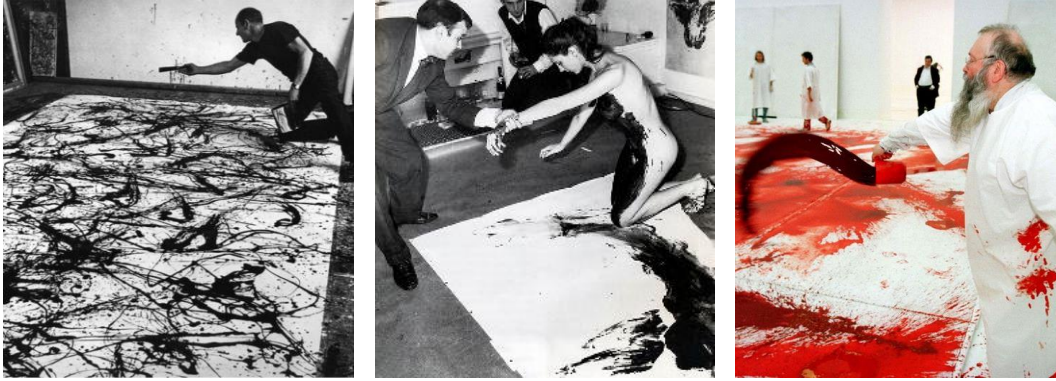
Resim 1. Jackson Pollock, Action Painting, 1950, Doğu Hampton Stüdyosu, https://www.chegg.com/flashcards/midterm-flashcards-73c07e1d-ddde-4ad4-ae32-2a45d9f19ab3/deck , (Erişim tarihi: 23.03.2021) Resim 2. Yves Klein, Body Paintings, http://www.sanatatak.com/view/zero-sanatcilarini-yakindan-taniyalim-yves , Resim 3. Hermann Nitsch, Viyana Modern Sanat Müzesinde gerçekleştirilen bir performanstan, https://www.huffpost.com/entry/hermann-nitsch-bull-blood-protest_n_58f76718e4b0de5bac42841c , (Erişim tarihi: 20.03.2021)