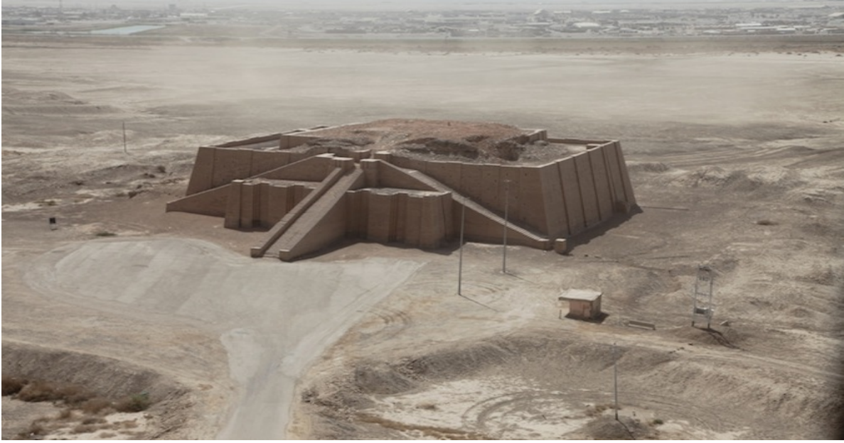
Resim 1: Ur Zigguratının günümüzdeki kalıntılarında görünüm. 52

Hız. İbrahim'in doğduğu Ur şehrinde M.Ö. 2112 yılında yönetimi ele geçiren hanedanlık 53 bölgede inşa edilen yapıların projesini de örnek alarak büyük bir inşaat başlattı ve Ay tanrısı Nanna'nın tapınağı olan büyük Zigguratı Ay'ın görünme açısını da hesaplayarak büyük bir kompleks üzerine kurdu. 54 Çocukluk ve gençlik dönemini Ur'da geçiren Hz. İbrahim'in bu büyük Zigguratı haberdar olması muhtemeldir. Kâbe'nin dikdörtgen yapısıyla Zigguratlara şeklen benzediği iddiası da kısmen makuldür. Çünkü Zigguratların tepesinde bulunan kare yapı ile aynı mimarî özellikteki Kâbe motifi benzeşmektedir. Kurban ve dua gibi dinî ritüellerin iki yapının ibadet hayatının bir parçası olduğu da bir gerçektir.