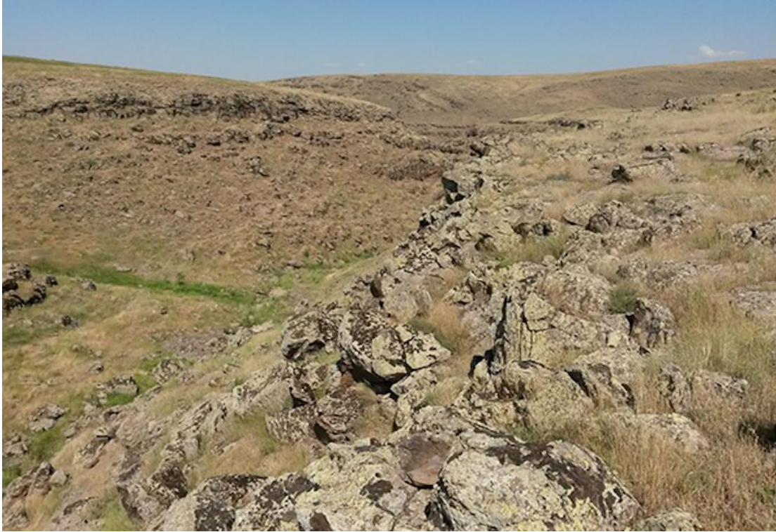
Şekil 6. Duracak köyünde türün dağılış gösterdiği alandan genel bir görünüş (Temmuz-2014), Foto: M. Z. YILDIZ

Türün tarafımızca belirlenen son dağılış alanı olan Duracak ile Ortayayla köyleri etrafında kalan vadidir. 373 hektarlık bu alan diğer alanlara göre daha geniştir. Tamamen volkanik kayaların oluşturduğu bir vadi olması sebebiyle diğer alanlara göre farklılık teşkil etmektedir (Şekil 6).