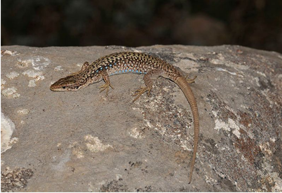
Şekil 7. Darevskia sapphirina türüne ait genel bir görünüş

fark ederek kendilerini gözlemleyemeden büyük kayalıkların arasındaki çatlaklara veya kayaların altına gizlenmeleri ve kayaların üzerinde hareket ederken ses çıkarmamaları popülasyon büyüklüğü tahmin sonuçlarını etkilemiştir.