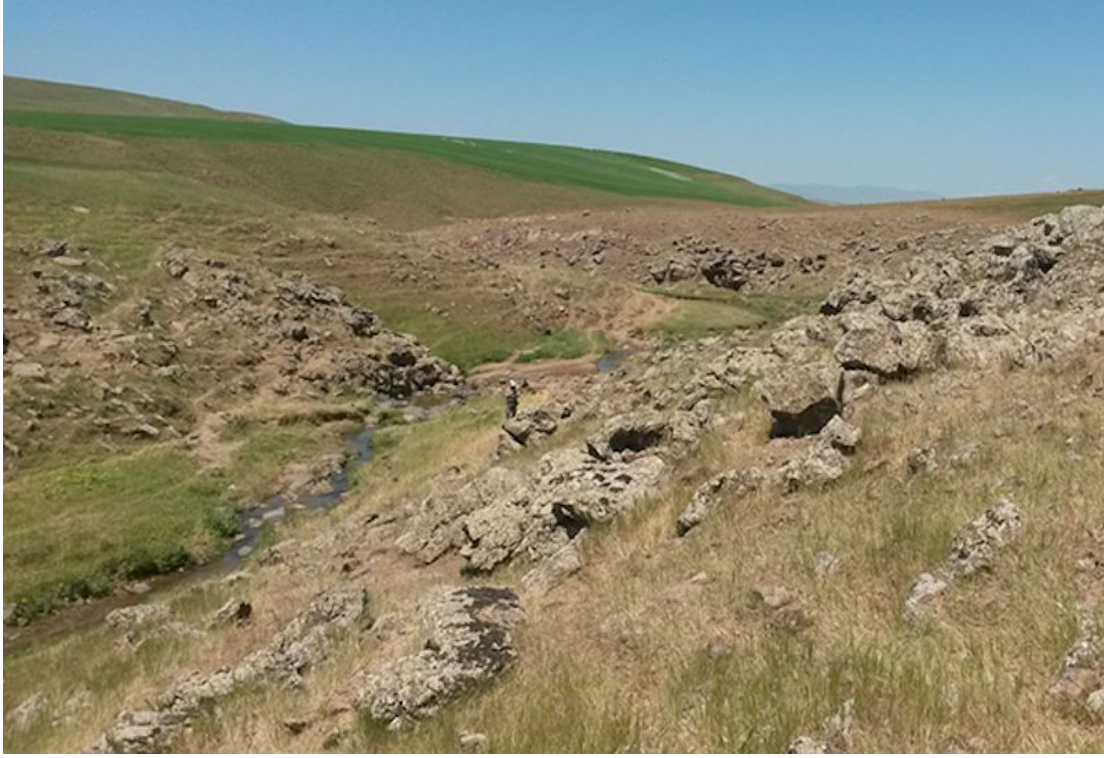
Şekil 3. Türün tip lokalitesinden genel bir görünüş (Haziran-2014)

Türün tip lokalitesinde çoğu Poaceae (Graminae) familyasına ait Bromus tectorum , Poa bulbosa , Stipa holocericea , Hordeum bulbosum , H. murinum , Alopecurus sp., Dactylis glomerata , Aegilops cylindrica ve Festuca callieri taksonlarını ihtiva eden step vejetasyonu tipi hakimdir. Cruciata taurica , Teucrium polium , Euphorbia sp. ve Astragalus sp. alandaki diğer step taksonlardır. Sulak alanda ise Urtica dioica , Mentha longiflora , Veronica anagallis-aquatica , Ranunculus arvensis , Bellis annua , B. perennis ve Trifolium pratense taksonları hâkim durumdadır. Yeni bulunan lokaliteler de benzer vejetasyon özellikleri göstermektedir.