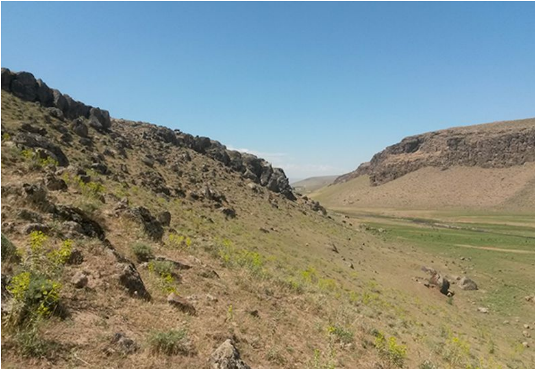
Şekil 5. Türün dağılışı gösterdiği Derecik köyü ile Zallı köyü arasından genel bir görünüş (Temmuz-2014), Foto: M. Z. YILDIZ

2) Derecik-Zallı (Patnos/Ağrı) lokalitesi: Rakım 1800 m, tip lokalitesinin 5 km kuzeybatısı Tür için yeni bir lokalite olan bu alan, akarsu kenarında hafif step vejetasyonuna sahip, kayalık bir vadi olmasıyla türün tip lokalitesine benzemekte ancak daha derin ve 80.4 hektarlık daha geniş bir alana sahip olmasıyla kısmen farklılık göstermektedir (Şekil 5).