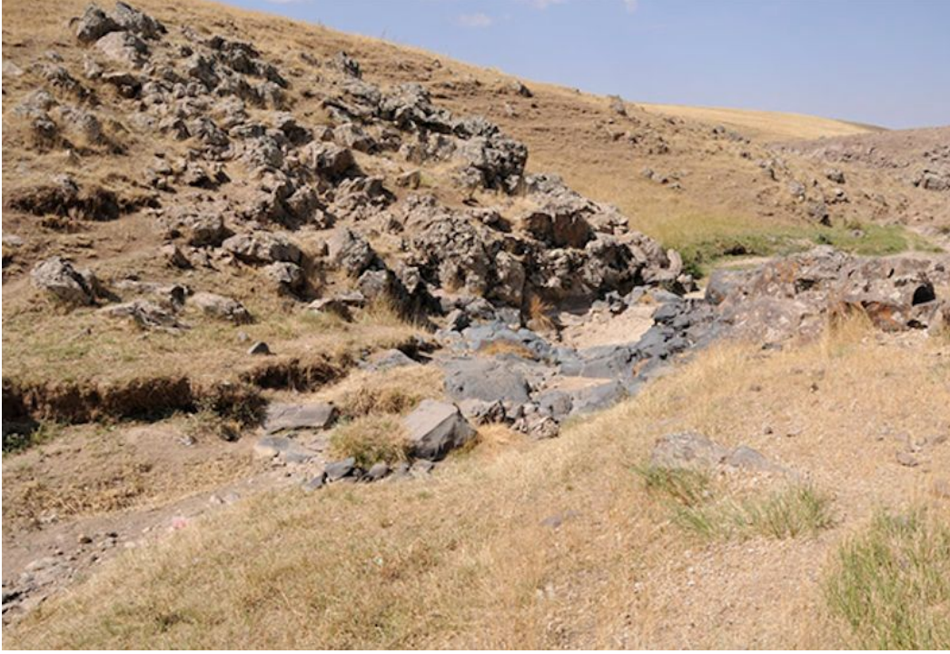
Şekil 4. Türün tip lokalitesinden genel bir görünüş (Eylül-2014)

2) Derecik-Zallı (Patnos/Ağrı) lokalitesi: Rakım 1800 m, tip lokalitesinin 5 km kuzeybatısı Tür için yeni bir lokalite olan bu alan, akarsu kenarında hafif step vejetasyonuna sahip, kayalık bir vadi olmasıyla türün tip lokalitesine benzemekte ancak daha derin ve 80.4 hektarlık daha geniş bir alana sahip olmasıyla kısmen farklılık göstermektedir (Şekil 5).