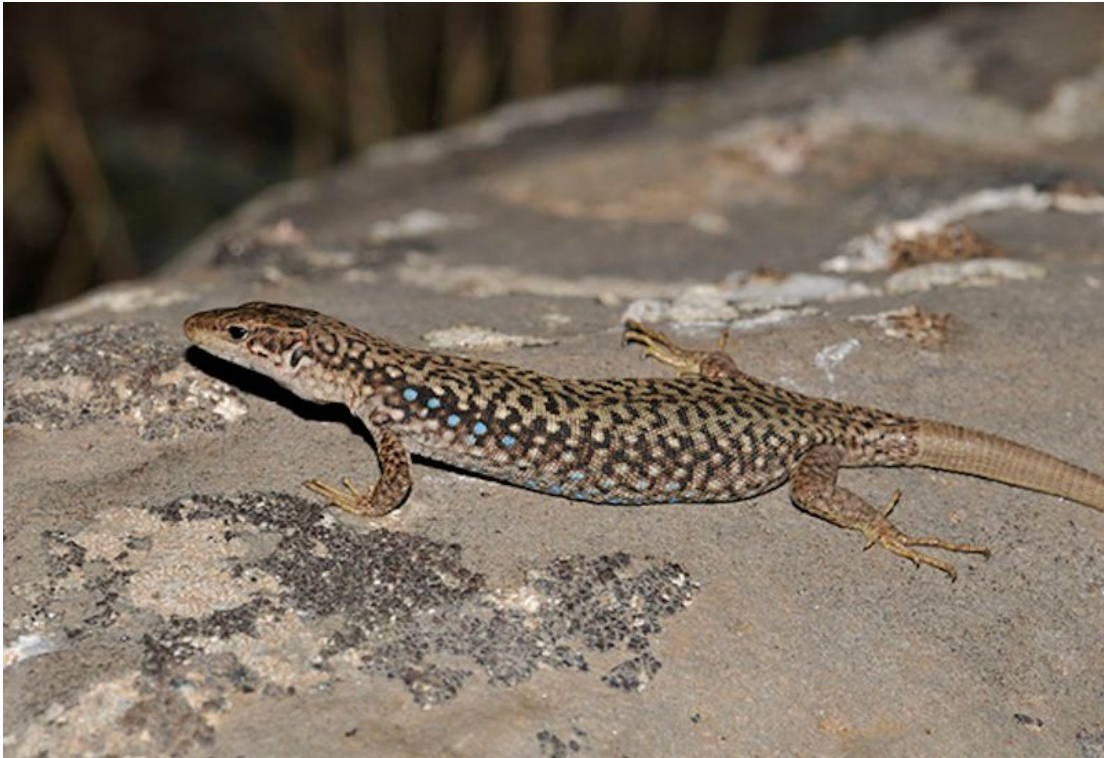
Şekil 8. Darevskia sapphirina türüne ait genel bir görünüş, Foto: M. Z. YILDIZ