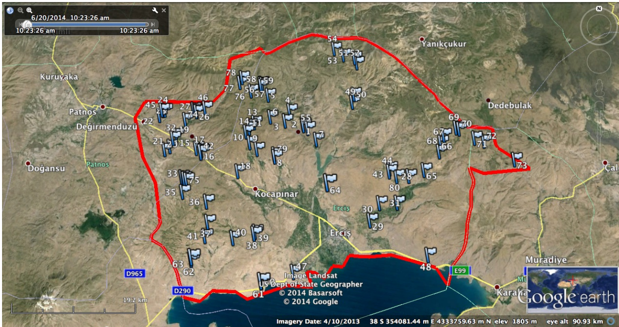
Şekil 1. Türün dağılımı sınırlarının belirlenmesi için arazi çalışması yapılan alanın ve lokalitelerin Google Earth görüntüsü

Popülasyon büyüklüğü türün en fazla gözleendiği tip lokalitesinde, Haziran ayında gerçekleştirilmiştir. Bu alan harita üzerinde 50x50 m 2 'lik alanlara ayrılmış ve birbirine komşu olmayan 5 farklı karede 3 kişilik ekip tarafından gözlenen bireyler kayıt edilmiştir. Her bir karede gözlenen toplam birey sayısı, gözlem yapılan kare sayısının ortalaması hesaplanarak, tip lokalitesinin yüz ölçümü ile orantılanmıştır.