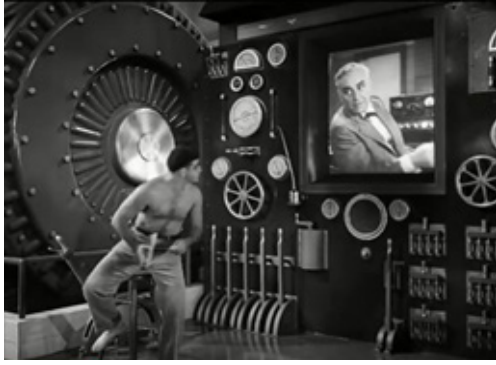
Resim 3. Filmden ekran fotoğrafı