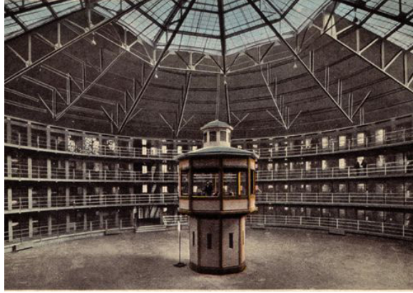
Resim 1. Panoptikon, İngiliz filozof ve toplum kuramcısı Jeremy Bentham'ın 1785 yılında tasarlamış olduğu hapishane. https://www.publicationcoach.com/panopticon/