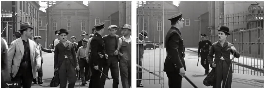
Resim 7. Filmden ekran fotoğrafı

Nitekim Chaplin'in canlandırdığı işçi, kendine yüklenen bu ağır iş yükünü ve gözetim baskısını kaldıramamıştır. Çalışma esnasında geçirdiği bir sinir krizi sonucu, kısa bir süre fabrikada üretimin durmasına neden olmuştur ki bu iktidar tarafından affedilebilir bir durum değildir. Chaplin'in canlandırdığı işçi, yaşananlar sonunda işinden olmuştur. Ancak dış dünyanın toplumsal ve ekonomik bunalımı, fabrikadakinden farksızdır (Resim 7). Fabrika sonrasında girdiği hiçbir işte mutlu olamayan Chaplin, benzer patron-işçi ilişkilerine maruz kalmış, umutsuz ancak aynı zamanda çalışmak zorunda olduğunun farkındadır ve işini kaybetmeyi göze alamaz. Çünkü yaşamını devam ettirmesini gerektiren sorumlulukları vardır.