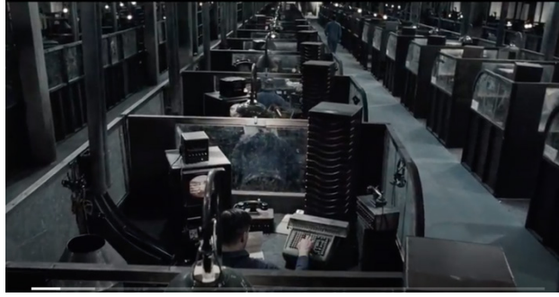
Resim 8. Filmden ekran fotoğrafı

sürekli gözetilen bir fabrika tasviri yaratılmıştır (Michael Radford, 1984). Her bir köşesi kameralarla gözetlenen ve işçilerin her hareketine müdahale edilen fabrika işçileri, sistem içerisindeki önemlerini fark etmezler. Çünkü fark etmeleri demek başkaldırmaları ve greve gidecekleri anlamına gelecektir. Bundan dolayı sistem tarafından sürekli aşağılanırlar, koyun sürüleri halinde denetim altında tutulmaları ve gözetlenmeleri gerekir. Filminin başında gördüğümüz sahne bir hapisane değildir, bir çalışma mekânıdır. Çalışanlar, mahkumların tek tip üniformaları gibi giydirilmiştir ve hapisane hücreleri gibi küçük bölmelerde tek başlarına çalışmaktadır (Resim 8).