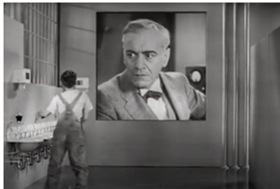
Resim 5. Filmden ekran fotoğrafı

Bir diğer karede, Chaplin, lavabo molası vermek için montaj bandından kısa bir süre ayrılır. Tuvalet içerisinde sigarasını yakar ve kısa bir keyif yapmak ister. Ancak burada kapalı olan gizli ekran tekrar açılır ve büyük patron, şiddetle işçinin sallanmayı bırakıp işinin başına dönmesini azarlayıcı bir ses tonuyla emreder. Bu sahne, panoptik bakışın bireyi farkında olmadan her yerde gözetlediğinin, ve bireye müdahale ettiğinin açık bir göstergesidir. Aynı zamanda bireysel mahremiyetten söz etmek mümkün değildir, bireyin özel alanına doğrudan müdahale vardır ve bu meşrudur. İşçi, nerede ve kim tarafından gözetlendiğini bilemese de, her an gözetim altında olduğunu bilerek iktidara karşı itaatkar olması gerektiğinin farkındadır. Çünkü kapitalizmin üretim yöntemi işçiyi ve emeğini hiçe sayarak onun korku ve tedirginlik içinde sistemi sorgulamasını engellemektir. İşçiler birer koyun gibi güdülecek itaatkar nesnelere dönüştürülmüştür. Bu sayede fabrika işçilerinden maksimum verim alınır. Fordist üretim sisteminin bir diğer esası da budur; bireyin kendine ayıracak özel alanını yok etmek ve mahremiyetine müdahaleden çekinmemek.