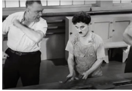
Resim 4. Filmden ekran fotoğrafı

Bir diğer karede, Chaplin, lavabo molası vermek için montaj bandından kısa bir süre ayrılır. Tuvalet içerisinde sigarasını yakar ve kısa bir keyif yapmak ister. Ancak burada kapalı olan gizli ekran tekrar açılır ve büyük patron, şiddetle işçinin sallanmayı bırakıp işinin başına dönmesini azarlayıcı bir ses tonuyla emreder. Bu sahne, panoptik bakışın bireyi farkında olmadan her yerde gözetlediğinin, ve bireye müdahale ettiğinin açık bir göstergesidir. Aynı zamanda bireysel mahremiyetten söz etmek mümkün değildir, bireyin özel alanına doğrudan müdahale vardır ve bu meşrudur. İşçi, nerede ve kim tarafından gözetlendiğini bilemese de, her an gözetim altında olduğunu bilerek iktidara karşı itaatkar olması gerektiğinin farkındadır. Çünkü kapitalizmin üretim yöntemi işçiyi ve emeğini hiçe sayarak onun korku ve tedirginlik içinde sistemi sorgulamasını engellemektir. İşçiler birer koyun gibi güdülecek itaatkar nesnelere dönüştürülmüştür. Bu sayede fabrika işçilerinden maksimum verim alınır. Fordist üretim sisteminin bir diğer esası da budur; bireyin kendine ayıracak özel alanını yok etmek ve mahremiyetine müdahaleden çekinmemek.