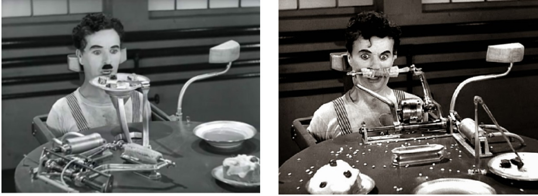
Resim 6. Filmden ekran fotoğrafı

çalışanların iş gücünden daha çok yararlanılacağı hedeflenmektedir. Chaplin'in otomatik beslenme makinesiyle beslenme sahnesi fiyaskoyla sonuçlansa bile, bu sahne büyük patronun iktidar ve üretim hırsını gözler önüne seren trajikomik bir sahnedir (Resim 6).