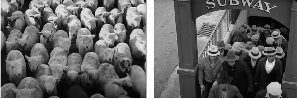
Resim 2. Filmden ekran fotoğrafı

Devam eden sahnelerde, fabrika işçilerinin üretim alanlarını görmekteyiz. Çalışma esnasında patron, birden monitörde belirir ve makinaların hızlandırılması talimatını verir (Resim 3). İşçiler izlenildiklerinin farkındadırlar ve hızlanan montaj bandında maksimum hızla çalışmaya başlarlar. Ustabaşı, işçileri her an denetlemekte ve işçilerin, patronun talimatlarına uyup uymadıklarını kontrol etmektedir. Ustabaşı burada disiplin mekanizmasının bir parçasıdır. Disiplinin sağlanması için çalışanlara sert ve kaba davranmaktan çekinmemektedir (Resim 4).