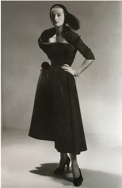
Şekil 7. Christian Dior, 1948 (Sinclair, 2014, s. 59)

Yine aynı dönemlerde, sinema dünyasının altın çağını yaşadığı ve film yıldızlarının giydiği göz kamaştırıcı siyah elbiselerin şıklığın göstergesi olarak yeni bir kadın imgesinin oluşmasında etkili olduğu görülmektedir (bkz. Şekil 5 ve Şekil 6).