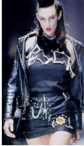
Şekil 9. , Saditionaries Koleksiyonu , Vivienne Westwood, 1977 (Buxbaum, 1999, s. 121).

1930'lu yıllardan itibaren Cristóbal Balenciaga, Christian Dior, Hubert de Givenchy, Yves Saint Laurent, gibi modacılar siyah rengin popülerliğine katkıda bulunmuşlardır (bkz. Şekil 7 ve Şekil 8). 1950'li yıllarda siyah moda otoriteleri tarafından kabul görüp modanın temel renklerinden biri olurken, çeşitli alt kültürlerin ve entelektüel hareketlerin kıyafetlerinde de anlam taşıyıcı olarak yer almıştır. Örneğin, 1950'li yıllarda San Francisco ve New York çevresinde gelişen, toplumsal ve edebi bir hareket olarak nitelendirilebilecek Beatnik'lerin , Paris'te filizlenen varoluşçuluk (Miloşyan, 2014, s. 1) felsefesinin renginin de siyah olduğu görülmektedir. Benzer şekilde, 1950'li yılların sonunda, Londra'da bir alt kültür olarak moda, müzik ve eğlence anlayışlarıyla ön plana çıkan Mod'larda siyah ve beyaz renkler ile kendilerini ifade etmişlerdir. Bu akım ile ekonomik özgürlüğüne kavuşmuş, feminen, yenilikçi, cesur, bakımlı ve stil sahibi bir kadın imajı oluşmuştur. 1960'lı yıllar, günlük yaşam alanlarında siyah rengin kullanımının azaldığı gençlik kültürleri, siyasi ifadelerde kullanılmaya devam ettiği yıllar olmuştur.