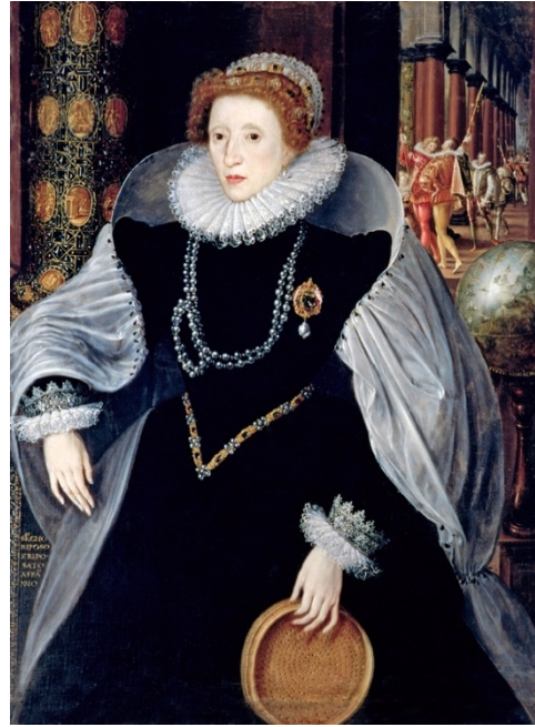
Şekil 2. İngiltere kraliçesi I. Elizabeth, 1583 (Andrews, 2017).

İspanya, XVI. yüzyılda siyasi, kültürel ve ekonomik güç olarak Avrupa modasını belirleyen ülke konumuna gelmiştir. İmparator V. Charles (1500-1558) ve oğlu II. Philip (1527-1598) gibi İspanyol yöneticiler hemen hemen her gün siyah kıyafet giyerek siyahın yükselişine ve bu modanın yayılmasına katkıda bulunmuşlardır (Harvey, 2012, s. 77). Bu dönemde siyah rengin şık, asil, mesafeli ve vakur bir görünüm sağlaması nedeni ile Yeni İspanya, Hollanda, Napoli ve İngiltere (bkz. Şekil 2) gibi ağırlıklı olarak Protestan ülkelerde ve şehir devletlerinde yaygın olarak kullanıldığı yönünde bir değerlendirme yapılabilir.