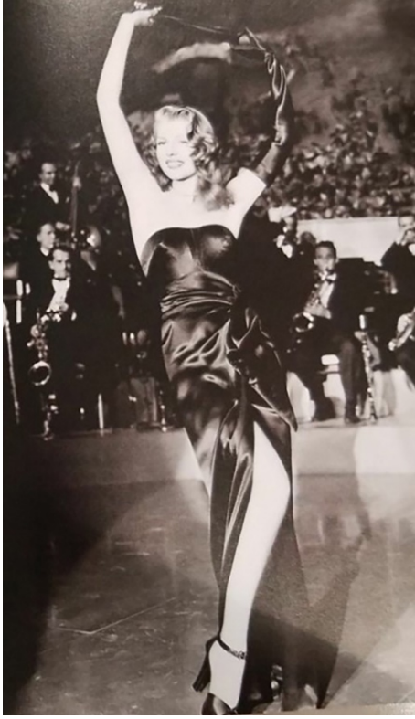
Şekil 5. Rita Hayworth için Jean Louis tarafından 1946 yılında hazırlanan 'Gilda' film kostümü (Steele, 2007, s. 91)