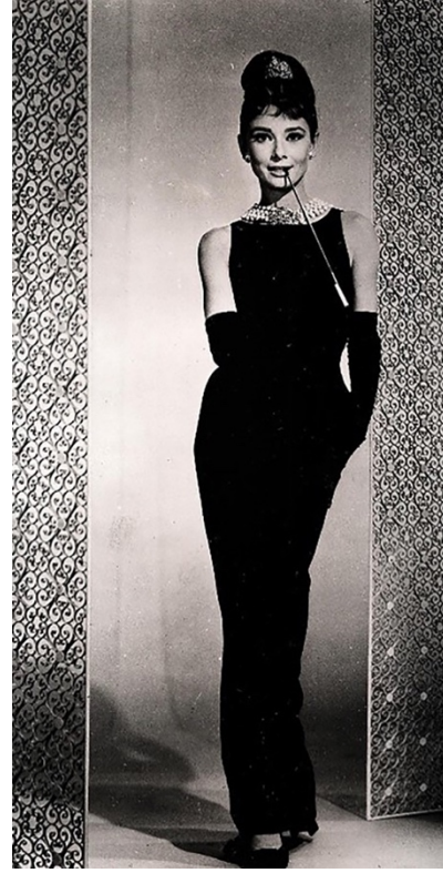
Şekil 6. Audrey Hepburn için Hubert de Givenchy tarafından hazırlanan 1961 yılında 'Breakfast at Tiffany's' film kostümü (Heyman, 2015)

Yine aynı dönemlerde, sinema dünyasının altın çağını yaşadığı ve film yıldızlarının giydiği göz kamaştırıcı siyah elbiselerin şıklığın göstergesi olarak yeni bir kadın imgesinin oluşmasında etkili olduğu görülmektedir (bkz. Şekil 5 ve Şekil 6).