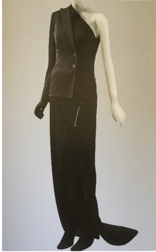
Şekil 11. Ann Demeuemeester, 1996 (Steele ve Menkes, 2016, s. 180).

1980'li ve 1990'lı yıllarda siyah birçok tasarımcı için önemli bir renk olmuştur. Özellikle siyah rengi Domenico Dolce ve Stefano Gabbana, Gianni Versace, Azedine Alaia, Claude Montana, Thierry Mugler, Jean Paul Gaultier ve John Galiano gibi tasarımcılar, kendi stillerindeki tasarımlarında sıklıkla kullanmanın yanı sıra, siyah rengin fetişist alt etkenlerle de sıklıkla ilişkilendirilmesi nedeni ile kadının cinsel gücüne vurgu yapan tasarımlarda kullanarak fetiş, moda ve fanteziyi birleştirmişlerdir. "Bazı tasarımcılar siyahın zarafetine odaklanırken, diğerleri onun içindeki yıkımı ve cinsel sapkınlığı göstermektedir. Böylece siyah hem moda hem de moda karşıtlığı ile yakından ilişkilendirilen renk haline gelmiştir" (Steele, 2007 s. 24).