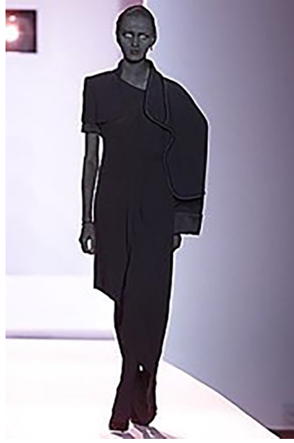
Şekil 12. Black Hole , Kış hazır giyim koleksiyonu, Victor & Rolf, 2001 (Viktor & Rolf fall 2001 ready to wear, 2001).

XX. yüzyılın sonlarında başlayan yapıbozum XXI. yüzyılda moda tasarımcılarını etkilemeyi sürdürmektedir. Fukai'e (2004, s. 32) göre Belçikalı tasarımcılar gibi Viktor&Rolf'un kurucu ortakları Viktor Horsting ve Rolf Snoering de bu akımdan etkilenmişler ve 1998 yılında, Paris'te ilk koleksiyonlarında siyahın kült bir renk olarak tanıtılmasına katkı sağlamışlardır. Viktor&Rolf'un kavramsal tarzda hazırladığı, her biri tek bir renge dayanan ve üç ardışık konu içeren koleksiyon, siyah, beyaz ve mavi renklerinden oluşmaktadır. Viktor&Rolf için renk, biçim ve sunum kadar değerli olmuştur. Şekil 12'de örneği yer alan, 2001 kış sezonu tamamen siyah renkten oluşan Black Hole hazır giyim koleksiyonunu sunan Victor&Rolf'un tasarımlarında, kasıtlı hatalar ve çelişkili bilmeceler öne çıkmaktadır. Koleksiyonun konusu siyah olması nedeni ile, tasarımları sunan tüm mankenler makyajları ve yüzleri de dahil olmak üzere tepeden tırnağa siyah renge boyanmıştır.