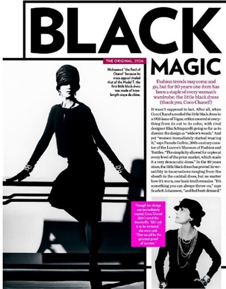
Şekil 4. The little black dress, Gabrielle Coco Chanel, 1926 (Exton, 2018)

XX. yüzyıla gelindiğinde, toplumsal değişimler, kadın özgürlük hareketlerindeki artış, korselerin kaldırılması, Paris'in modanın merkezi olması, hazır giyimin 1900-1910 yılları arasında önemli bir endüstri haline gelmesi ve Birinci Dünya Savaşı ile modada hızlı değişimler gerçekleşmiştir. Siyah renk ciddiyet ve sadelikle ilişkilendirilerek, iş hayatında en çok kullanılan renkler arasında yerini almıştır. Yine siyah rengin yas ve ölümle ilgili kullanımının, bu yüzyılda yaşanan iki dünya savaşı ile ilgili olduğu görülmektedir.