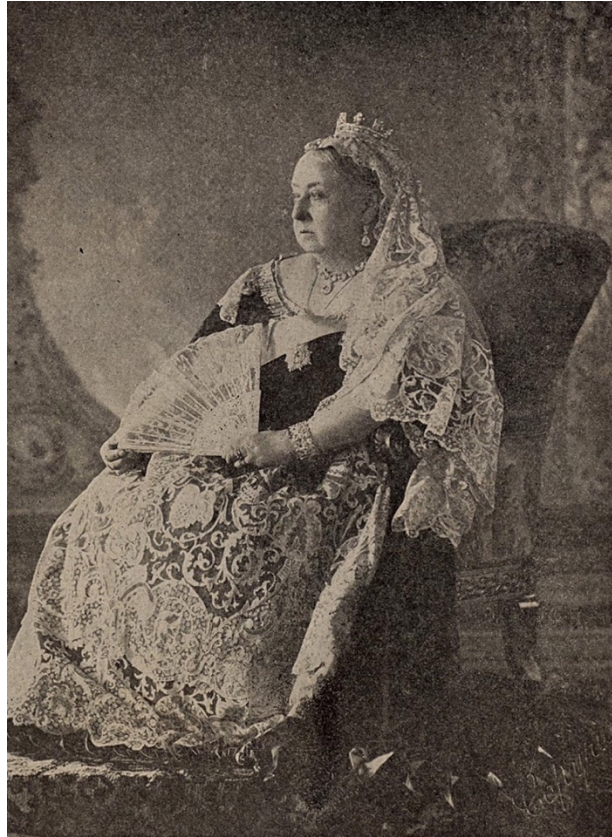
Şekil 3. İngiltere kraliçesi Victoria, 1897 (Queen Victoria in 1897, t.y.)

Diğer taraftan Avrupa'nın varlıklı sınıfının geçmiş dönemlerde ortaya çıkan ve bu dönemde pekişen siyah giyme hevesi Harvey'e (2012, s. 185-186) göre, güç ve para ile ilgili olmanın yanı sıra feragat, yoksullaşma ve kayıpla da ilişkili olmuş ve Dickens, John Ruskin, Oscar Wilde, Baudelari, Gautier, Musset ve Maupassant gibi yazarlar eserlerinde keder, matem ve yas nedeni ile siyah giyme tutkusunu işlemişlerdir. Yüzyılın ilerleyen yıllarında çok dindar kesim ve yas tutma kıyafetleri dışında, siyah rengin kadın giyiminde kullanımı gerilemiştir. Yas tutma geleneği ve giyimi ile ilgili önemli etkiye sahip olan İngiltere Kraliçesi Victoria, 1861 yılında Prens Albert'in ölümünden kendi ölümüne (1901) kadar siyah giysiler giyerek (bkz. Şekil 3) siyah modasının şekillenmesi, yas kıyafetleri ve süresi ile ilgili yasa ve görgü kurallarının çıkarılmasında etken olmuştur. Matem dönemleri için özel olarak hazırlanmış siyah elbiseler, gerekli görüldüğünde ciddi ortamlarda da giyilebilmiştir.