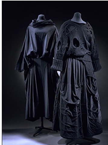
Şekil 10. Comme Des Garçons , Rei Kawakubo, 1982 (Master of deconstruction!, 2012).

Siyah rengin benzer kullanımı 1970'li yıllarda Punk akımı ile gündeme gelmiş, Malcolm McLaren ve Vivienne Westwood'un katkıları ile modaaya yansımış ve gençler tarafından büyük ilgi görerek yaygınlaşmıştır (bkz. Şekil 9). Punk akımında da kullanılan siyah deri ceketler özellikle renginden dolayı, kullanım alanları ve kullanan kişilere göre anarşi, asilik, güç, disiplin ve resmiyetle ilişkilendirmiş, kadın giyim modasında sıklıkla kullanılan bir moda ürünü olmuştur. 1970'lerin sonları 1980'lerin başında ise, siyah renk Gotik modası ile anılır olmuştur. Gotik modası Punk sonrası Londra'da ortaya çıkarak, Orta Çağ'ın Neo-Viktorya döneminin karanlık, gizemli ve egzotik yönlerini yansıtan kadın giyim modasında siyah rengin sembolik anlamlarına güçlü vurgular yapan bir akım olarak karşımıza çıkmaktadır.