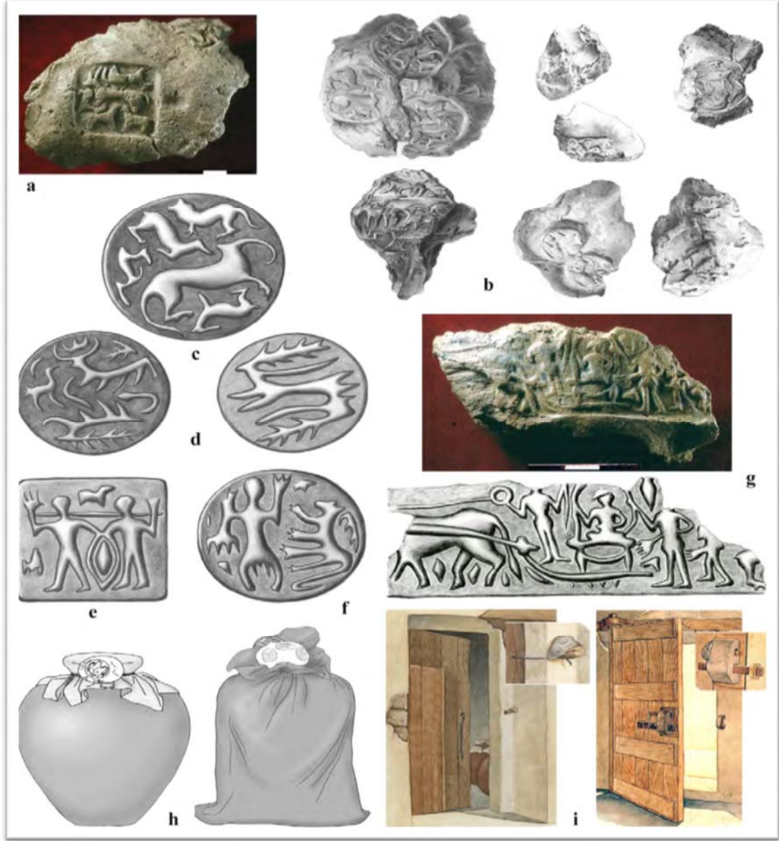
Şekil 4: Höyükte Bulunan Mühürler ve Çizimleri (Frangipane, 2018: 84).

Çok sayıda mühür, kabartma (Şekil 6) ve duvar bezemelerinin olması saray işlerinin belirli kurallarla yapıldığını ve idari işlerin varlığını göstermektedir. Bulunan iki binden fazla öge (mühür, cretula vb.) depolama ve muhasebe sisteminin güçlü olduğuna işaretir (Frangipane: 2012: 34). Depolamanın ve dağıtımın farklı alanlarda yapılması, yerleşim yerinde bir tür uzmanlık ve işbölümü anlayışının izlerine işaret edebilir. Ayrıca dağıtımın belirli mühürler ile yapılması dağıtan memurların olduğunu göstermektedir. Muhtemelen memurlar, üst otoriteden aldığı yetki ile hareket etmekte ve yaşamın sürdürülebilmesi için işbölümü yapmaktadır. Bu kararların belirli usul ve kaidelere göre yapıldığı düşünülmektedir. Ayrıca iki yüzden fazla mühürde tarım ve hayvancılığı simgeleyen figürler (Şekil 4, a-g) bulunmaktadır. Bu bulgunun ise toplumun geçim kaynakları ile ilgili bilgiler taşıdığı düşünülebilir. Bu figürlerin kendi içinde bir sistematik içerisinde olduğu söylenebilir.