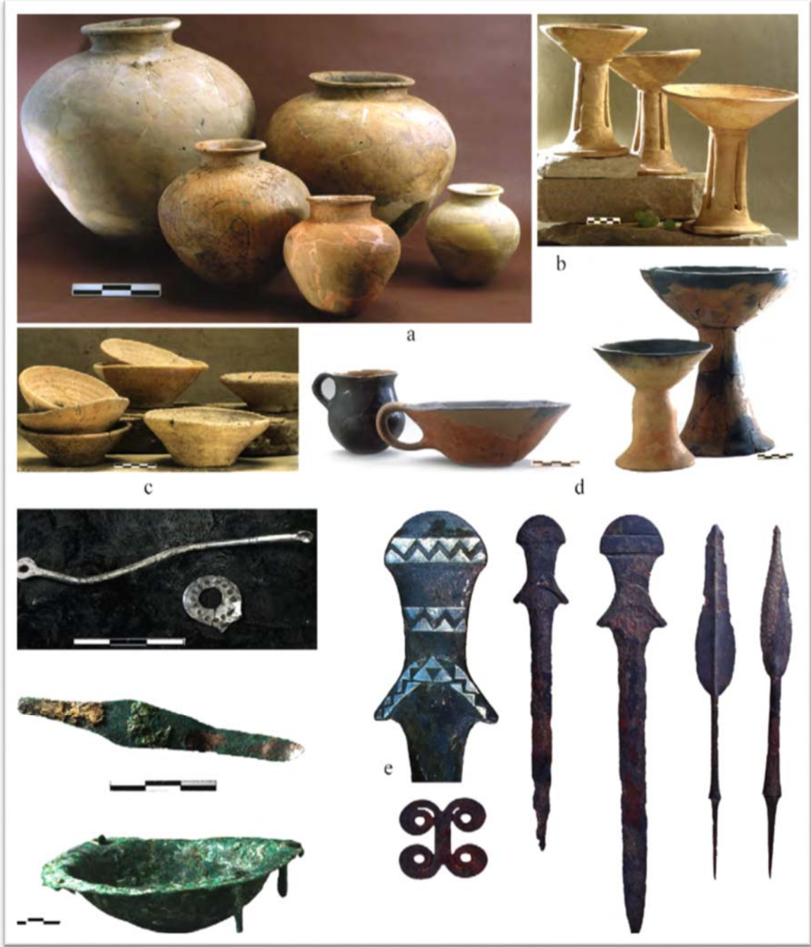
Şekil 5: Arslantepe’de Seramik ve Metal Objeler (Frangipane, 2018: 86).

Arslantepe’de çok özenli bir şekilde metal ürünlerin imal edildiği ve farklı türde metaller kullanıldığı görülmüştür. Bakır, kurşun, altın, gümüş ve metal alaşımlı öğeler dönemin madenciliği hakkında önemli fikirler vermektedir. En önemli metal öğeler arasında mızrak uçları ve kılıçlar yer almaktadır (Şekil 5). Her biri farklı metal ve büyüklükte olan öğeler muhtemelen şef veya rütbeli kişilerin saygınlığı ile doğru orantılı olarak imal edilmiştir (Frangipane, 2018: 97). Bu durum askeri hiyerarşinin varlığına işaret etmektedir. Bir başka açıdan yüksek statülü bir kişinin mezarı (Kral mezarı) taş sanduka içinde bulunmuştur. Burada ise metal nesne, silah ve mücevher gibi farklı semboller bulunması siyasi ve askeri hiyerarşik yapıyı çağrıştırmakta ve lidere, komutana verilen önemi ifade etmektedir. Liderin gücü ve otoritesinin vurgulanması ve hiyerarşik bir yapının oluşması geleneksel bürokrasinin izlerine işaret etmektedir.