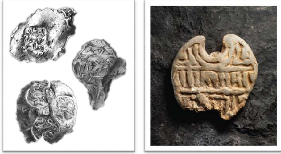
Şekil 6: Mühür ve Kabartmalar (Atlas, 2015).

Arslantepede kral veya liderin ihtişamlı bir iktidar alanı olduğu söylenebilir. Söz konusu iktidarın tepenin en üst noktasında saray yapılanmasında olduğu düşünülmektedir. Ayrıca devredilmiş yetkilere sahip bir memur sınıfı olarak bürokrasinin ortaya çıkışı, Astantepede erken devlet ve bürokrasi adına önemli bir bulgudur (Frangipane, 2018: 10). İktidar veya güç bağlamında duvar resimlerinin binaya erişim alanları boyunca en belirgin yerlere yerleştirilmesi, korundukları resimlerin saf ve basit süslemeler olmadığını, bu resim veya çizimlerin önemli figüratif motifleri temsil ettiği düşünülmektedir. Sembolik içeriği nedeniyle ziyaretçiye ideolojik mesajlar da vermektedir. Saray kompleksinin iki bölgesinde (mağazalara ve iç avluya erişim odası ve koridorun en kuzey bölümü) olağanüstü iyi korunmuş figürler, son aşamada yok edilmiştir (Frangipane, 1997a: 64).