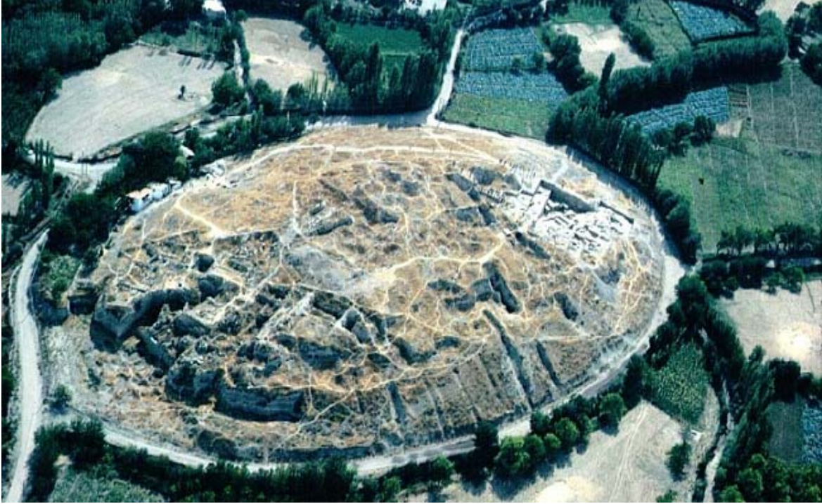
Şekil 1: Arslantepe Höyüğü (Frangipane, 2011: 134).

Şekil 1'deki fotoğrafta Malatya ili Battalgazi ilçesinde yer alan Arslantepe Höyüğü'nün kuşbakışı görüntüsü yer almaktadır. Malatya'nın kuzeydoğusunda il merkezine 7 km uzaklıkta yer alan höyük sadece Malatya için değil Anadolu topraklarında ortaya çıkarılmış önemli bir arkeolojik yerleşimdir. Arslantepe'de yapılan çalışmalarda elde edilen bulgulara göre M.Ö 4500'li yıllarda "Geç Kalkolitik 1-2" diye adlandırılan dönemde, Mezopotamya'nın farklı kültürleri bölgede yer almıştır. Tablo 1'de kronolojik, dönemsel ve kültürel bilgiler derlenmiştir. Söz konusu tablodan anlaşılacağı üzere Arslantepe tarihin farklı dönemlerinde birçok medeniyete ev sahipliği yapmıştır. Böylesine tarihi birikimi olan bir yapıda idari ve ekonomik işlerin yoğun olduğu tahmin edilebilir.