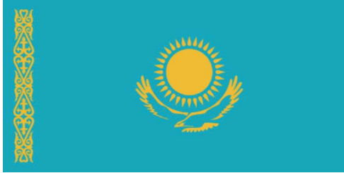
Görsel 8: Kazakistan bayrağı ( https://en.wikipedia.org )

nın ayinlerinde şamanlar büyülerine başlarken Tanrı Ülgen'in oğlu Karakuş'tan yardım isterler. Karakuş kara kartal olarak da bilinir. Kartal, Tanrı'nın ulağı olarak kabul edilir. Yakutlar için kartalı yaralamak çok büyük günahdır, çünkü inançlarına göre karların ve buzların erimesi, ilkbaharın gelmesi gibi birçok doğa olayı kartalların kanatlarını sallamasına bağlıdır. Kartal bir defa kanatlarını sallarsa buzlar erimeye başlar, ikinci defa sallarsa ilkbahar gelir. Eğer bir kartal yanlışlıkla ölürse onu kayın ağacı kabuğuna sarar ve şamanların ölümlere yaptığı gibi özel bir kerevetin üzerine veya bir ağaca defnedirler (Bilgili, 2019: 89-94). Kartalların iki başlı olarak tasviri hayatın iyi ve kötü yönlerini sembolize etmektedir. Ayrıca kartalın iki başı doğu ile batının hâkimiyetini de işaret etmektedir. Geniş kanatlı olan kuşlar tanrısal güce sahiptir. Gökte süzülüp uçarlar ve yeryüzündekileri korurlar. Kartal gözünü kırpmadan güneşe bakabilen bir kuş olduğundan ateşi bile alt edeceğine inanılır. Hızlı kapıp aniden çok yükselebilmek özelliğinden dolayı yıldırımla; uzun yaşamasından dolayı sağlık ile özdeşleştirilir. Türk mitolojisinde kartal ağacı, ağaç da kartalı korur. Selçuklu bayrağında yer alan çift başlı kartal (Görsel 9), gücü temsil eden bu kuşun önemini bir kez daha kanıtlar niteliktedir. Doğu ile batının hâkimi olmak anlamı da taşımaktadır. Günümüzde de Arnavutluk bayrağında (Görsel 10) çift başlı kartal figürü yer almaktadır.