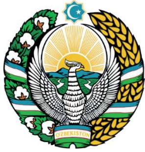
Görsel 20: Özbekistan devlet arması ( https://en.wikipedia.org )

Kül Tigin'e ait olduğu düşünülen heykel başındaki ongunun da Hüma kuşu olduğu belirtilmektedir. Göktürklerde de birçok şeyin sembolü olarak Hüma kuşunun kullanıldığı düşünülmektedir (Kalafat, 2013: 37). Kültigin'in başında Hüma kuşu bulunan tasvirini (Görsel 21) hükümdarlık sembolü olarak düşünmek mümkündür, bu kuş kimin başına konarsa hükümdar olacağı anlayışını da desteklemektedir. Ayrıca alında veya baş üzerinde yer alan kuş figürü, o kişinin koruyucu ruhu olarak da düşünülebilir. Baht, şans, devlet kavramlarını çağrıştıran Hüma kuşu, Görsel 20'de görüldüğü gibi Özbekistan devlet armasında da güneşi dahi kapsayan güçlü kanatlarıyla sembol olarak kullanılmıştır, ülkesinin temsili bayrağını geniş kanatları altına alarak onu koruma vazifesini üstlenmiş bir bekçi gibi görülmektedir. Armada yer alan güneş ve kuş unsurlarının gökyüzü ile ilgili olması kutsiyet yüklediğinin göstergesi olarak düşünülmektedir.