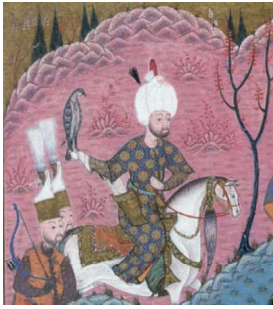
Görsel 17: Kanuni Sultan Süleyman'ı Doğanıyla Avdayken Gösteren Minyatür (Aydın, 2013: 43)

Doğanlar yuvalarını genellikle, sarp kayalıkların kenarına bazen de terk edilmiş yuvalara kurarlar. Özel kanat yapısına sahip olan bu kuşlar uçarken çok yüksek bir hıza ulaşmaktadır. Havada uçan en hızlı kanatlılar arasında kabul edilen doğanlar, avlarına kilitlenip hız almaya başladıklarında, ilk önce kanatlarını aşağı yukarı çırpıp hızlarını arttırmaları, sonra hedefe doğru alçalmaya başladıklarında kanat çırpışını bırakıp kendilerini boşlukta salarak kanatlarını arkaya iter ve göğü yararcasına aşağıya inerler. Yırtıcı ve güçlü kuşlar arasında olması sebebiyle mitolojik anlamda ön plandadırlar. Eski Türkler; avcılığı, günlük hayatlarının bir parçası olarak görmekteydi, beslenme ve ekonomileri yarı yarıya avcılığa dayanmaktaydı. Türk beyleri yeri ve zamanı geldiğinde özellikle, belli amaçlarla avlanmışlardır. Türk topluluklarında beylerin yanında ava giderken (Görsel 17) avcı kuşlar olması sebebiyle mutlaka yanında doğanları da bulunmaktadır.