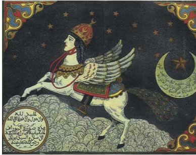
Görsel 14: Burak ( https://en.wikipedia.org )

Bütün bu özellikleriyle Tulpar, Yunan mitolojisinde uçan at olarak bilinen Pegasus'la (Görsel 15) benzer özellikler göstermektedir. İslamiyet döneminde de peygamber efendimiz Hz. Muhammed (sav)'i Miraç olayında gökyüzüne uçuran at "Burak"ın (Görsel 14) da burada anılması gerekmektedir. Bunlar da kanatlı ve kutsal kabul edilen atlardır.