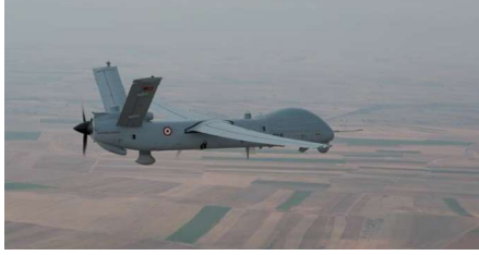
Görsel 6 : Anka ( https://www.ssb.gov.tr )