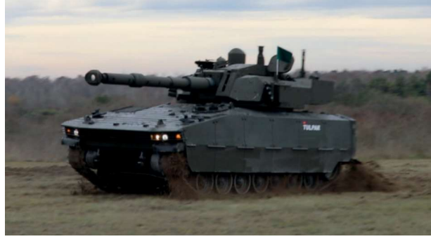
Görsel 16: Tulpar ( https://www.ssb.gov.tr ) Hükümdarlık Alameti Olanlar