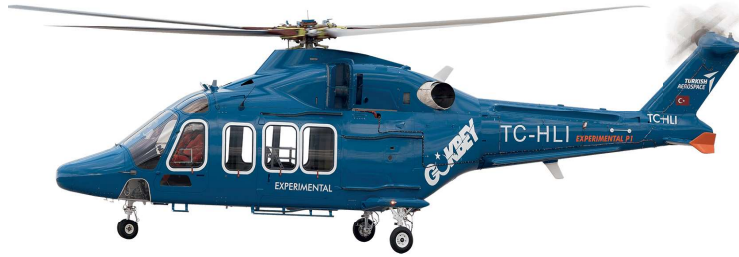
Görsel 3: Gökbey

şöyle ant içmektedir: “Göğsü tüylü yağız yer beni vursun, dipsiz yüksek mavi gök, keskin ay beni parçalasın.” Tüylü yağız yer ve dipsiz yüksek gök ifadelerine ilk defa burada rastlanmaktadır. Türk milletinin yaratılışla ilgili olarak üzerinde en çok durduğu unsur; gök ve yer ikiliğidir. Gök ak renkle, yer kara renkle sembolize edilmektedir, kara ve yer kelimeleri de toprak parçası anlamında kullanılmaktadır. Aynı şekilde gök eril, yer dişil ögeler olarak kabul edilmektedir. Altay Türkleri evreni üç bölgeye ayırır: gökyüzü, yeryüzü ve yeraltı. Hayat ağacı bu üç bölgeyi birbirine bağlayan mitolojik bir unsur olma özelliği taşımaktadır. Gökyüzü, Tanrı Ülgen ile; yeryüzü, kişiöglü ve yeraltı ise Erlik Han ile bağdaştırılmaktadır. Yeraltı ruhları Körmös, gökyüzü ruhları Kuday ve yeryüzü Altay olarak isimlendirilmektedir. Uygur Türklerine göre yer ve gök kavramları yaruk ve kararığ olarak ifade edilmektedir. Yaruk, ışıklar; kararığ, karanlık anlamına gelmektedir. Bunların Çinliler arasında görülen Ying ve Yang ilkesine benzer şekilde, gök ve yer kavramlarının ikiliği ile bağlantılı eril ve dişil unsurlar olduğunu söylemek mümkündür (Bilgili, 2017: 11-12). Evrende birçok varlığın karşıtıyla birlikte yaratıldığı görülmektedir. Kadın-erkek, su-ateş, iyi-kötü birbirinin zıddı olup birbirini tamamlayan unsurlardır; gökyüzü ile yeryüzünün de bu anlamda tamamlayıcı unsurlar olduğu bilinmektedir. Ak ve kara renkleri ile sembolize edilmelerini de bu zıtlığa bağlamak mümkündür.