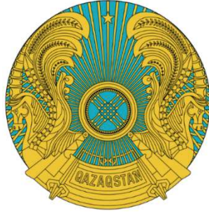
Görsel 12: Kazakistan Devlet Arması ( https://en.wikipedia.org )

Kazakistan ve Moğolistan devlet armalarında (Görsel 12 ve 13) Tulpar motifi yer alır. Asalet ve güç sembolü olarak yer aldıklarını söylemek mümkündür.