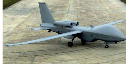
Görse 7: Anka Gökşungur ( https://tusas.com/urunler/iha )