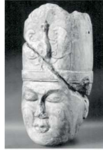
Görsel 21: Kül Tigin büstü (Tansü, 2017: 801)