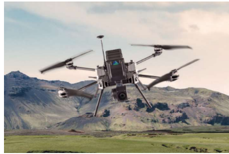
Görsel 18: Togan