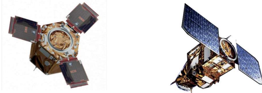
Görsel 1: Göktürk-1 ve Göktürk-4 Uydusu ( https://www.ssb.gov.tr )

Türklerde gökyüzünün kutsal olması yönündeki inançlar, daha önce eski Türk dininde görülürken daha sonra İslamiyet döneminde görülmeye devam etmektedir. Buna bağlı olarak da mitolojik anlayıştan günümüze uzanan dönemde gökyüzü kutsallığını ve önemini devam ettirmiştir, gökyüzü her zaman insanoğlunun ihtişamına kapıldığı bir yer olarak kabul görmektedir. Çağımız modern teknoloji sistemiyle yapıлып uzaya gönderilen uyduya (Görsel:1) da gök kavramının sonsuzluğundan ve gücünden esinlenerek tarihte Türk adını taşıyan ilk devletin de ismi olarak “Göktürk” adı verilmiştir. Bununla birlikte Görsel 2’de görülen ve savunma sanayisinde üretilen füze “Göktuğ”; Görsel 3’te yer verilen helikopter de “Gökbey” olarak adlandırılmıştır. Göklerin hâkimi olma anlayışı göz önünde bulundurularak oldukça güçlü isimlerle anılan bu araçlar, Türk milletinin şanlı geçmişini bugüne taşıma vesilesi de olmaktadır. Günümüzde bu isimler taşıdığı bu manevi değerler bakımından birçok erkek çocuğa da isim olarak verilmektedir.