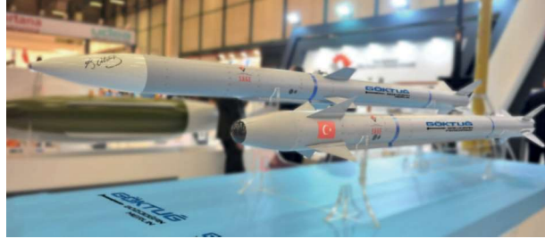
Görsel 2: Göktuğ ( https://www.ssb.gov.tr )