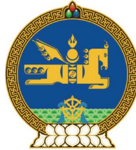
Görsel 13: Moğolistan Devlet Arması

Bütün bu özellikleriyle Tulpar, Yunan mitolojisinde uçan at olarak bilinen Pegasus'la (Görsel 15) benzer özellikler göstermektedir. İslamiyet döneminde de peygamber efendimiz Hz. Muhammed (sav)'i Miraç olayında gökyüzüne uçuran at "Burak"ın (Görsel 14) da burada anılması gerekmektedir. Bunlar da kanatlı ve kutsal kabul edilen atlardır.