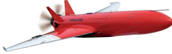
Görsel 22: Tuna