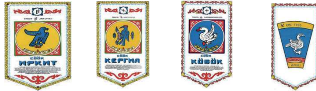
Görsel 4: Türk Boylarının Damgaları (Kalafat-Güven, 2011: 63-73)

Birçok Türk boyunun damgasında kuşlar sembol olarak kullanılmıştır. Bunlardan bazıları İrkit, Kergil, Almat, Köbök boyları Görsel 4’te yer aldığı şekildedir: