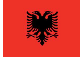
Görsel 10: Arnavutluk bayrağı ( https://en.wikipedia.org )