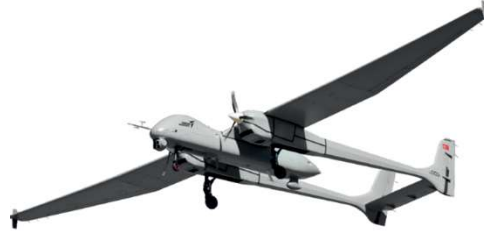
Görsel 19: Anka Aksungur ( https://tusas.com/urunler/iha )

Hikâyeden alınan bu bölümden de görüldüğü üzere sungur kuşu kahramanlığı ve gücü ifade etmede sembol olarak kullanılmıştır. Sungur dışında alaca ördek, kara kaz yer verilen diğer kuşlardır. Birçok yırtıcı ve güçlü kuşun isminde olduğu gibi günümüz İHA'larından birine (Görsel 19) Aksungur ismi verilmiştir.