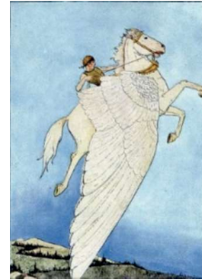
Görsel 15: Pegasus ( https://en.wikipedia.org )

Günümüzde yerli üretim olan tanklardan birinde (Görsel 16) bu isim kullanılmıştır. Her türlü arazi şartında gidebilen bu araca karanlıkta bile gidebilen, uzun mesafe yol alan ve rüzgârdan hızlı giden efsanevi atın ismi verilerek gelecek nesillere aktarımı sağlanmıştır.