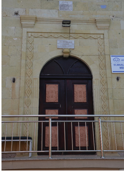
Fotoğraf 7. Elmaalan Mahallesi Merkez Camii Kuzey Cephe Ana Giriş Kapısı