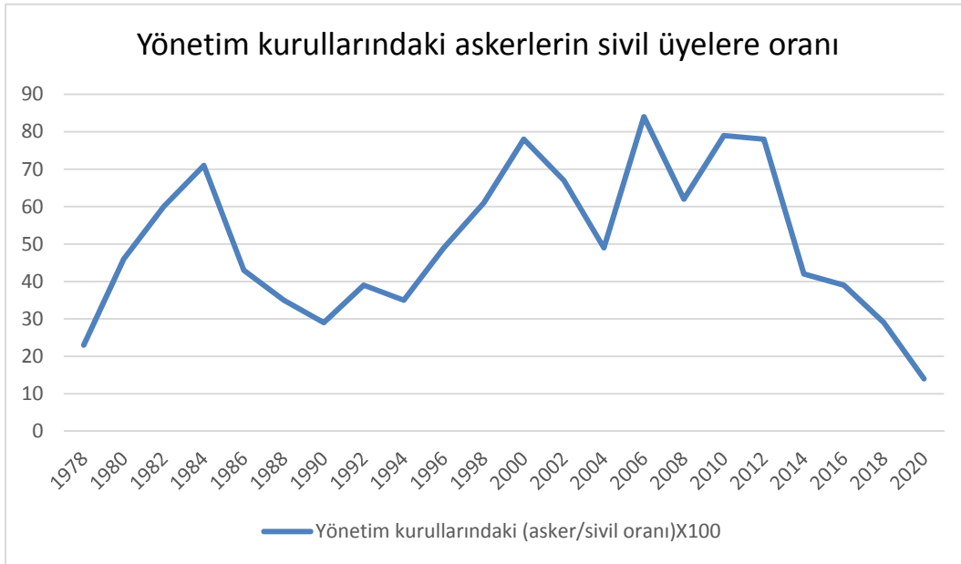
Grafik 1. TSKGV ve OYAK'ın ortaklığı bulunan bazı şirket yönetim kurullarında görev alan asker üyelerin, sivil üyelere oranında yıllara göre değişim.

Aşağıdaki grafikte, Tablo 1 kullanılarak TSKGV ve OYAK'ın ortaklığı bulunan bazı şirket yönetim kurullarında görev alan üyelerin asker/sivil oranlarında yıllara göre değişim gösterilmiştir.