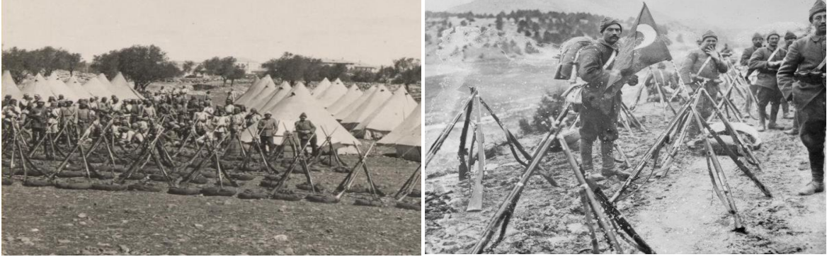
Fotoğraf 1-2: Türk Tarihinde Tüfek Çatıları Oluşturan Birlik Görüntüleri