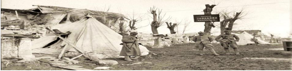
Fotoğraf 3: 1939 Erzincan Depremi Sonrası Yardım İçin Kurulan Jandarma Karakolu (1939)