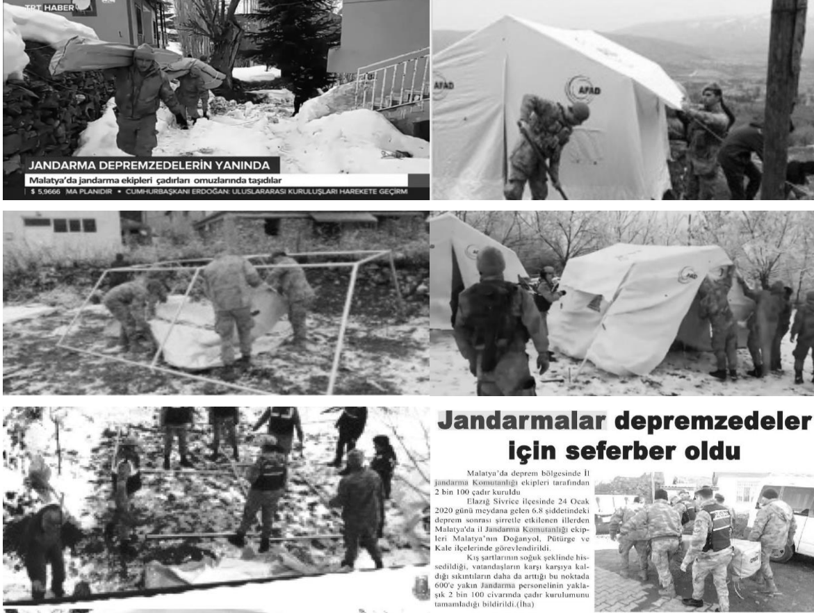
Fotoğraf 4-9: Malatya ve Elazığ'da Meydana Gelen Depremde Jandarma