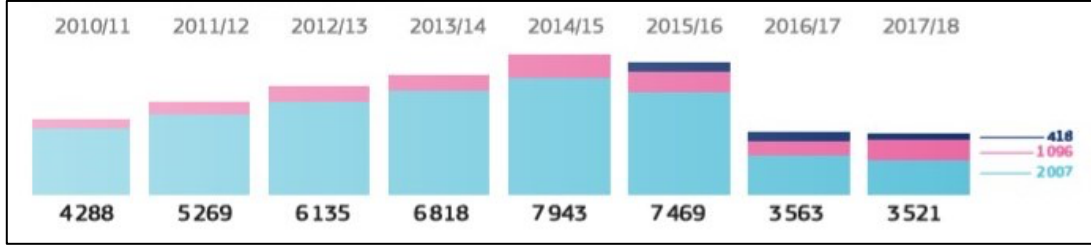
Şekil 1. 2010/2011-2017/2018 yılları arasında Türkiye’de erasmus+ kapsamında bulunan öğrenci sayıları.

Kaynak: Avrupa Komisyonu (European Commission)