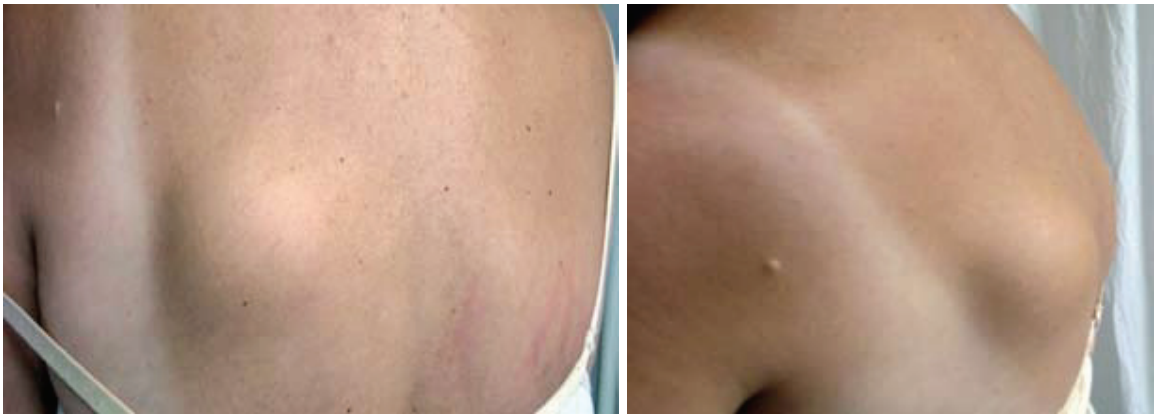
Şekil 1. Skapula alt köşesinde elastofibroma dorsinin görünümü.

Tüm tümörler skapula alt köşesinde, serratus anterior, romboid ve latissimus dorsi kaslarının arasında, altıncı, yedinci kotların periostuna yapışık olarak saptandı. Tümör sınırları hiçbir olguda tam olarak seçilebilir değildi, kapsüler yapıya rastlanmadı. Ameliyat