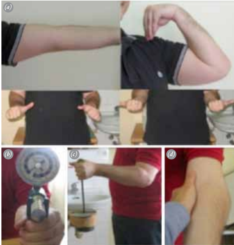
Şekil 4. İki yıllık takipte fonksiyonel sonuçlar (a) Eklem hareket açıklığı. Hasta tam bir ekstansiyona ve 120°'lik dirsek fleksiyon açısına ulaştı. Pronasyon-supinasyon hareketi normale yakındı. (b) Son kontrolde elin kavrama gücü 35 kg. (c) Hasta 12 kg kaldıracabiliyordu, (d) Hastanın hafif bir asemptomatik varus instabilitesi vardı. [Bu şekil, derginin www.aott.org.tr adresindeki çevrimiçi versiyonunda renkli görülebilir.]

51 kg olarak ölçüldü (Şekil 4b). Hasta 12 kg'ı kaldıracabiliyordu (Şekil 4c) ve varus stres testi uygulamasında makul oranda laksite görülmesine rağmen dirseğinde instabilite yakınması yoktu (Şekil 4d).