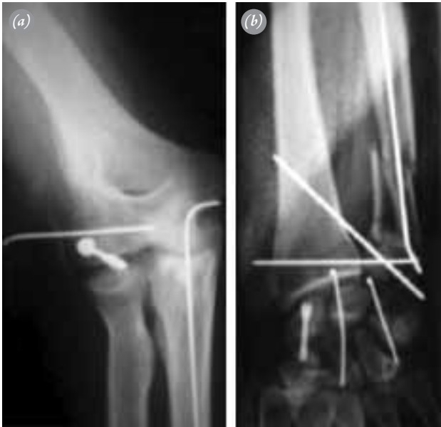
Şekil 1. Kliniğimize başvuru sırasındaki radyografiler. Kazadan 6 hafta sonra sol dirseğin ve el bileğinin radyografik görüntüsü: (a) Humerus kondil kırığı 4.0 mm'lik spongiöz vida ve Kirschner teli kullanılarak tespit edilmiş. (b) Intramedüller Kirschner teli ile ulna osteosentezini, distal radioulnar ekleme transfiksasyonu ve karpus transskafoid karpal çıkığa Kirschner teli ve Herbert vidası ile fiksasyonu gösteren el bileği radyografisi.

Hasta önerilen yeni bir cerrahi rekonstrüksiyon işlemini onayladı. Hastaya, el bileğinde Sauvé-Kapandji ve dirsekte ters Sauvé-Kapandji yöntemi ile rekonstrüksiyon uygulandı (Şekil 3a-c). Radius başının küçük sigmoid çentiğe arthrodezi yapılacak şekilde distale kaydırılması ile kapitelluma takılma önlenildi ve dirsek fleksiyon ekstansiyonu açıldı. Radius ve distal ulna boynunda psödoartroz oluşturulup pronasyon-supinasyon açıldı.