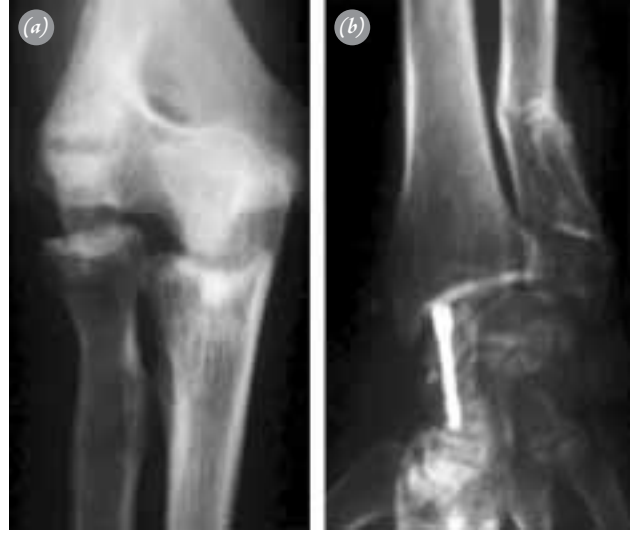
Şekil 2. Vidaların ve çivilerin çıkarılmasından sonra dirsek radyografileri: (a) Humerus kondilindeki deformite ve radiusun proksimal migrasyonu. (b) Radiusun distal migrasyonuna bağlı kötü kaynaklı ulna ve radioulnar uyumsuzluk.