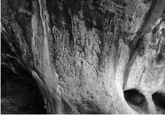
Res. 2 Silifke Savaşçı Mahallesi Athena Oreia Yazıtı (Fotoğraf: H. Şahin 2006).