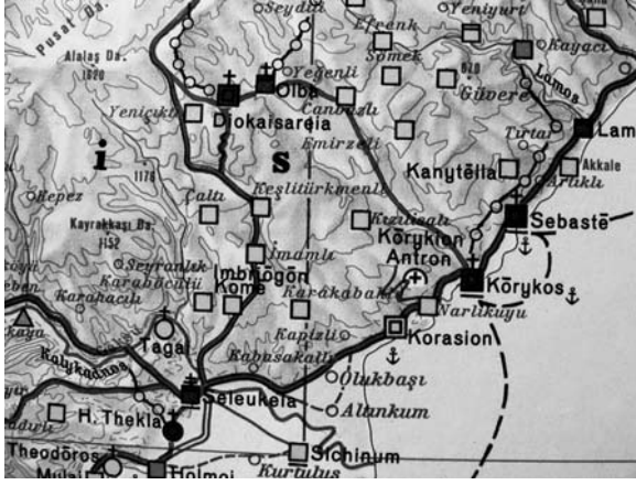
Harita Diokaisareia ve Çevresi (Hild – Hellenkemper 1990).