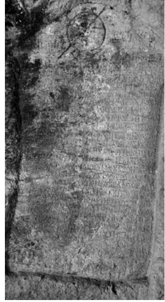
Res. 3 Silifke Eyceli Köyü, Öter Kale Mevkii Antlaşma Yazıtı.