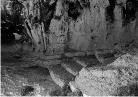
Res. 4 Silifke Eyceli Köyü Öter Kale Mevkii Athena'ya ait Kutsal Alan (Fotoğraf: H. Şahin 2006).