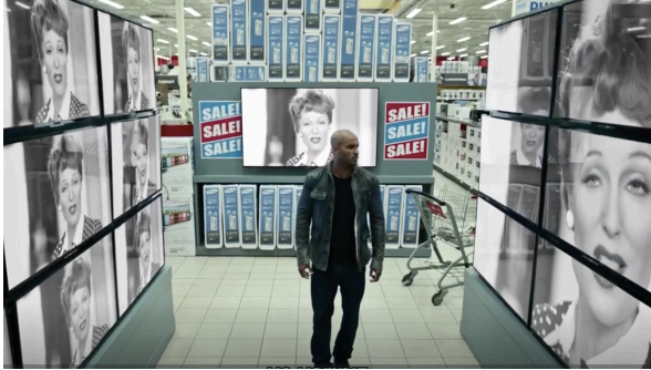
Resim 1. Shadow ve Medya Tanışma Sahnesi.

Dizide daha birinci bölümden itibaren yeni tanrıların ana karakter olan Shadow'u elde etme, bildiklerini öğrenme ve kendi taraflarına geçme için ikna etme çabalarını görüyoruz. Bunu kimi zaman kaba kuvvetle, tehditle yapmaya çalışıyorlar kimi zamansa bir şeyler vaat edip aklını çelmeye çalışarak. Zorla taraf değiştirtme görevi Teknoloji tarafından üstlenilirken, ikna etme kısmı medyanın görevi oluyor. Medya elindeki her türlü cazibeyi kullanarak Shadow'u kendi taraflarına çekmeye çalışıyor. Kimi zaman Shadow'un hayranı olduğu çekici bir Hollywood yıldızı olarak karşısına çıkıyor, kimi zamansa ona ün, şöhret ve para vaat ediyor. Bunları yaparken de adeta bir pazarlama stratejisi ile hareket ediyor. Reklam kampanyası gibi sunulan teklifler her seferinde Shadow tarafından reddediliyor.