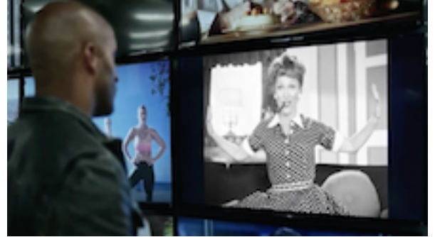
Resim 2. Shadow ve Medya Tanışma Sahnesi