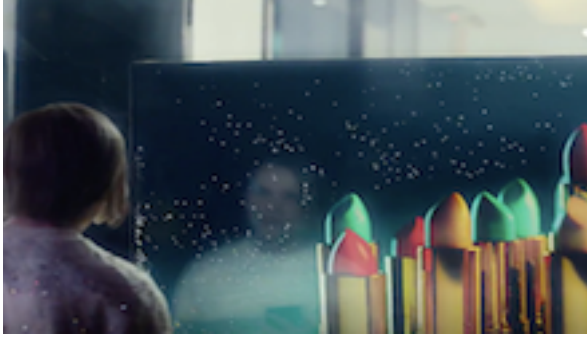
Resim 5. Medya'yı Bulma Sahnesi

Dizinin 1. Sezonun final bölümünde Paskalya bayramı için toplanmış tanrıların eğlencesinde Medya eski tanrılarla görüştüğü için kızdığı Paskalya Tanrısını tehdit eder. Ona görüntüsü olmayan bir tanrının unutulup yok olacağını söyler. Paskalya medyada yanlış bir imajla temsil edildiğini düşünmektedir ama Medya böyle düşünüyorsa bu hislerle yaşamayı öğrenmesi gerektiğini, sonuçta azizlerin bile bu şekilde gösterildiğini söyler. Ona göre dünya artık ateisttir ve dinler evrimleşmelidir. Bu sırada söze giren Mr. Wednesday dinlerin yeniden yayılmasıyla tekrar canlanabileceğini savunur. Medya dağıtımı yapanların kendileri olduğunu, platformları ve mekanizmayı, dolayısıyla tüm akışı kontrol ettiklerini söyler. Bu sırada ortaya çıkan Mr World tüm silahların kendilerinde olduğunu, savaşlar da savaşmalar da kazananın her zaman kendileri olacağını anlatır.