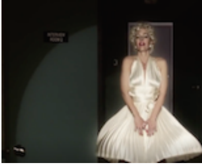
Resim 3. Medya İkna Sahnesi

biri olarak görüyor. İnsanların ona tapınma biçimiye onu izlemek, takip etmek, onu izlemek uğruna her şeyden vazgeçmek. Medya kendisine insanların onun için neyi feda ettiğini sorduğunda “Zaman ve bazen de birbirlerini” diye cevap veriyor. Gerçek ilişkilere zaman ayırmayan insanların zamanlarını medyaya vermesi ve ilgilerinin hep medya üzerinde olması onun için bir çeşit ibadet olarak tanımlanıyor. Burada günümüz insanın izleme bağımlılığı, gelişmeleri kaçırma korkusu eleştiriliyor. İnsanların artık tamamen teknolojiye bağımlı olduğu ve ilerleyen zamanlarda arabaların yapay zekalar tarafından sürülmesi, her şeyin üç boyutlu yazıcılarda yazılarak üretilecek olması hatta sağlığımızın bile dijital araçlar tarafından kontrol altında tutulacak olması insanlığın gidişatının da bir göstergesi. Eskiye takılı kalanların ve eski yöntemlerle yaşamını sürdürmek isteyenlerinse bu sistemde var olma şansı yok.