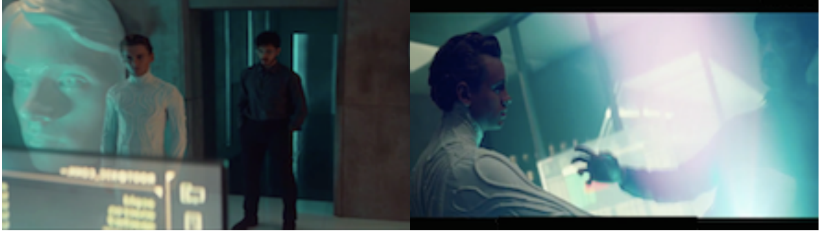
Resim 9. Tanrı Dokunuşu Sahnesi

2. sezonun final bölümü medyanın kitleler üzerindeki etkisini anlatan bir sahne ile başlar. Radyonun tüm evlerde dinlendiği 50’li yıllarda bir aile akşam haberlerini dinlemektedir. Radyodaki spiker büyük bir patlamanın sonrası olay yerinden canlı yayın yapmaktadır ve bir uzay gemisinin düştüğünü, içinden yılanla ahtapot arası tuhaf görünümlü, korkunç yaratıkların indiğini söyler. Radyodan çılgınlıklar gelmektedir. Evde bir panik havası başlar. Aile arabalarına inip kaçmaya başlar. Ertesi gün tüm gazeteler uzaylı istilasını yazmıştır. Ardından Mr World ‘ü bir Hollywood stüdyosunda görürüz. Uzaylılarla ilgili bir film çekilmektedir ve yönetmen koltuğunda da Mr World oturmaktadır. Mr World kameraya dönüp konuşmaya başlar. Toplumların sevgi ile değil korku ile düzene sokulacağını, dünyanın sevgi ile değil korku ile döndüğünü söyler. Burada korkuyu yaratan da kitleleri buna inandıran da medyadır. Olmayan bir şeyi varmış gibi gösteren, olan bir şeyi olmamış gibi de gösterebilir. Medya toplumun dizginleyicisi, kural koyucusu konumundadır. Medyanın gücü Mr World’ün şeytani tavırlarıyla anlatılır: “Sevginin dünyayı dönüştüreceğini söylüyorsunuz. Dönüştürmez. Geceleri kapınızı komşunuzu sevdiğiniz için kilitlemiyorsunuz. Onlardan korktuğunuz için kilitliyorsunuz. Korku düzendir. Korku kontroldür. Korku güvendir. Korku kurgudur... Korku hayal ürünüdür. Beyninizin yarattığı bir şeydir. Ne kadar korkarsanız, o kadar inanırsınız!”