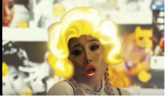
Resim 8. Yeni Medya Dönüşüm Sahnesi