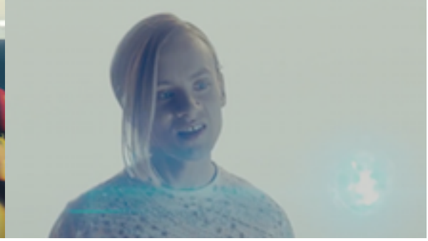
Resim 6. Medya'yı Bulma Sahnesi