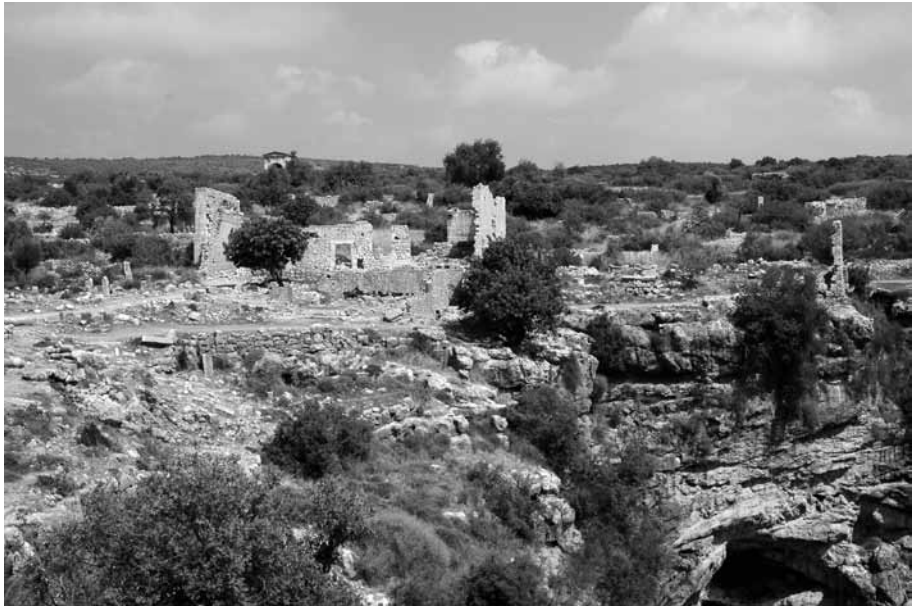
Res. 2 Kanytella, Genel Görünüş