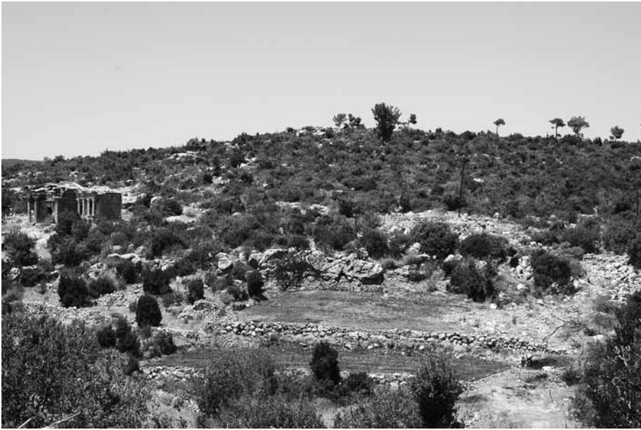
Res. 4 Imbriogon Kome, Genel Görünüş