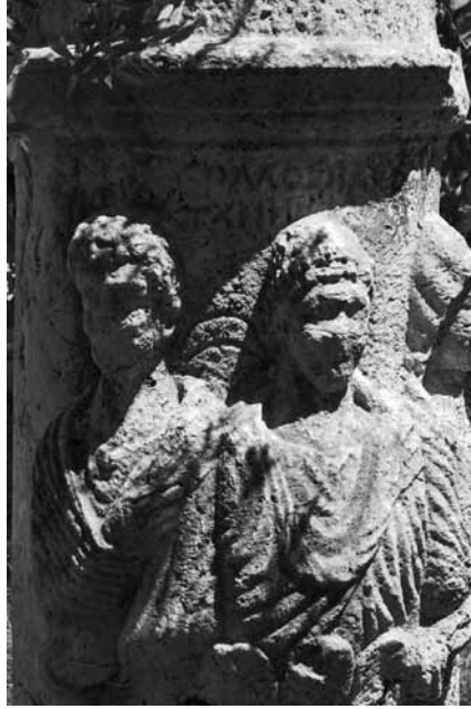
Res. 5 Yazıtlı Mezar Sunağı (Silifke Müzesi)