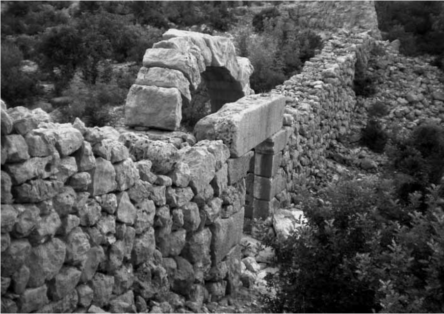
Res. 8 Korasion, Dellek Mevkii Duvar Yapısı ve Kapı