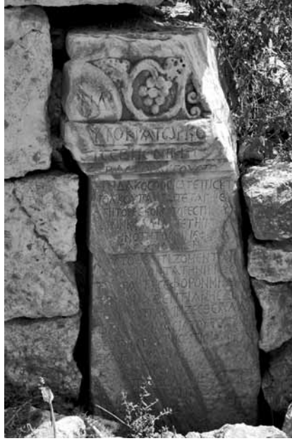
Res. 3 Korykos, Anastasius Yazıtı