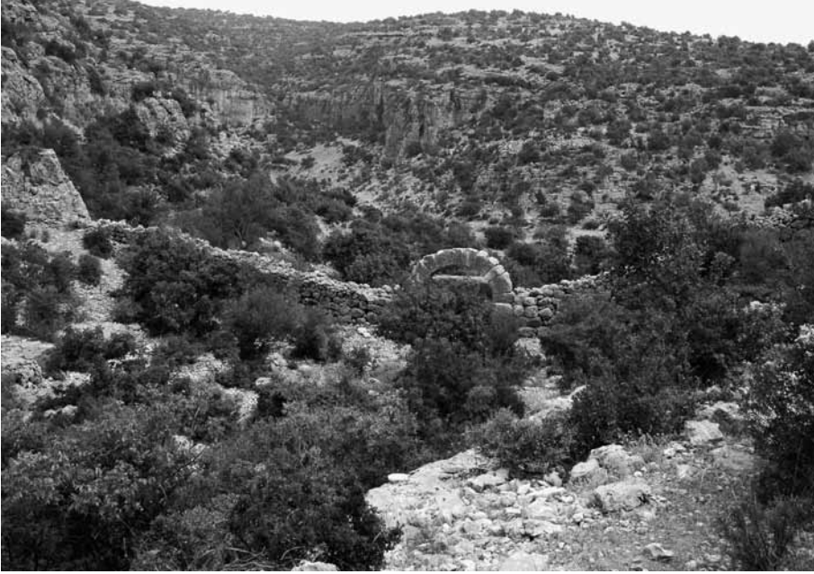
Res. 7 Korasion, Dellek Mevkii Duvar Yapısı ve Kapı Genel Görünüşü