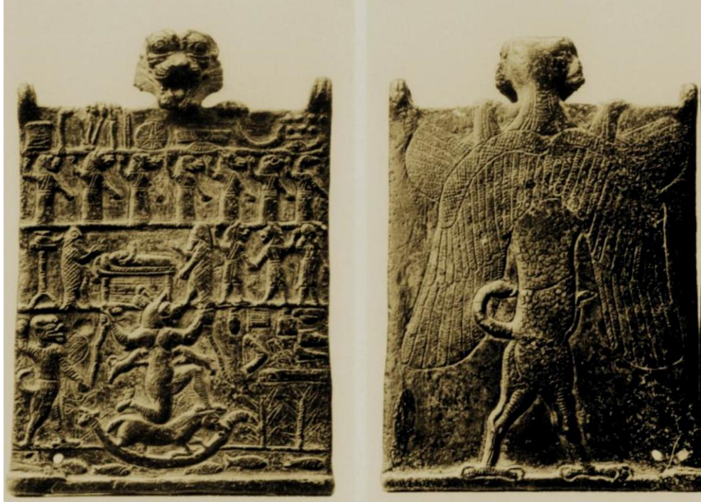
Resim- 2: Akrep kuyruklu Pazuzu (Duymuş Florioti, 2014a: 367).