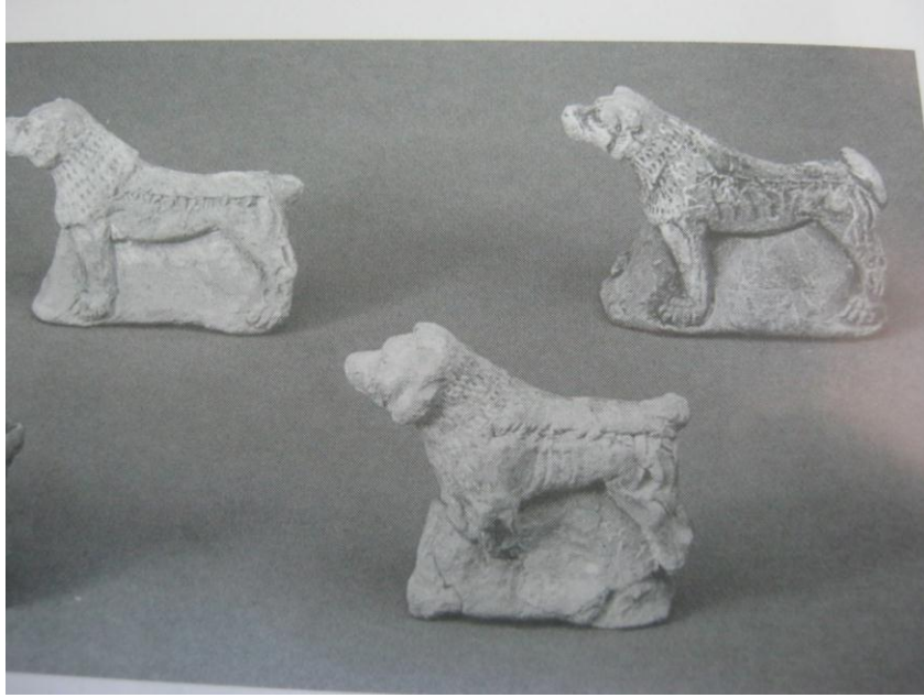
Resim-4: Ninova Sarayı giriş kapısına, kötülükleri önlemek amacıyla yerleştirilmiş terra-cotta köpek figürinleri (Watanabe, 2002: ekler, fig. 37).