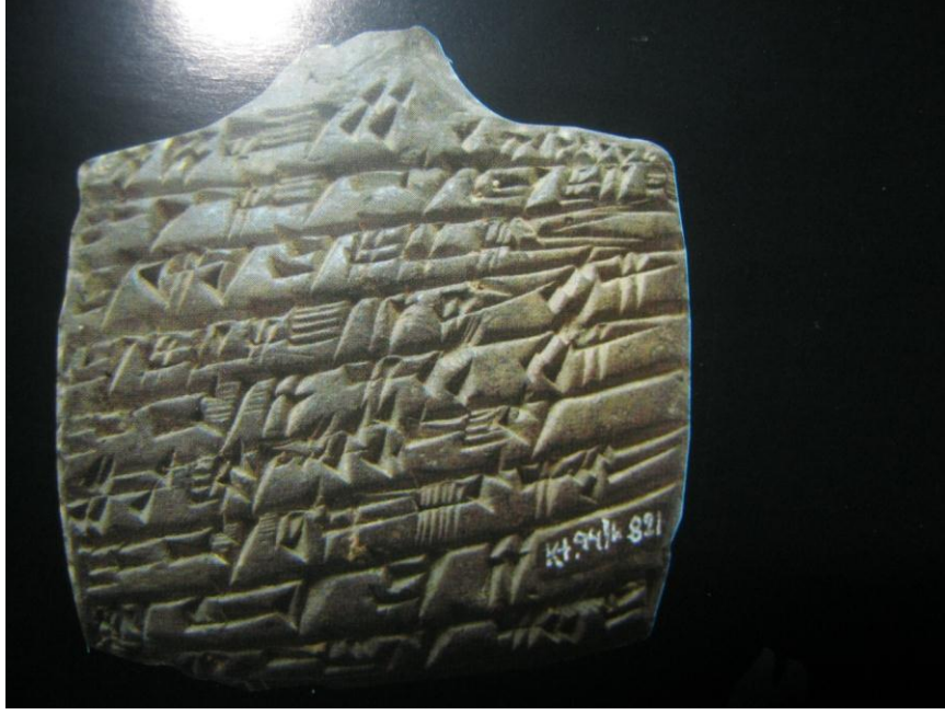
Resim-3: Lamaštu'ya karşı muska şeklinde yapılmış tablet (Erol, 2013: 67).