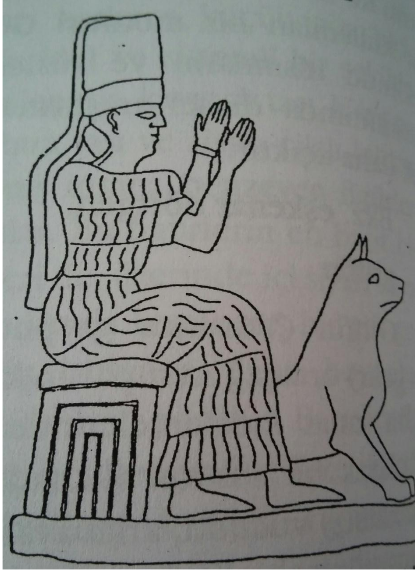
Resim-5: Tanrıçası Gula ve köpeği. Babil kralı Nabû-mukin-apli dönemine ait bir kudurru 'dan alınmıştır (Black ve Green, 2003: 92).