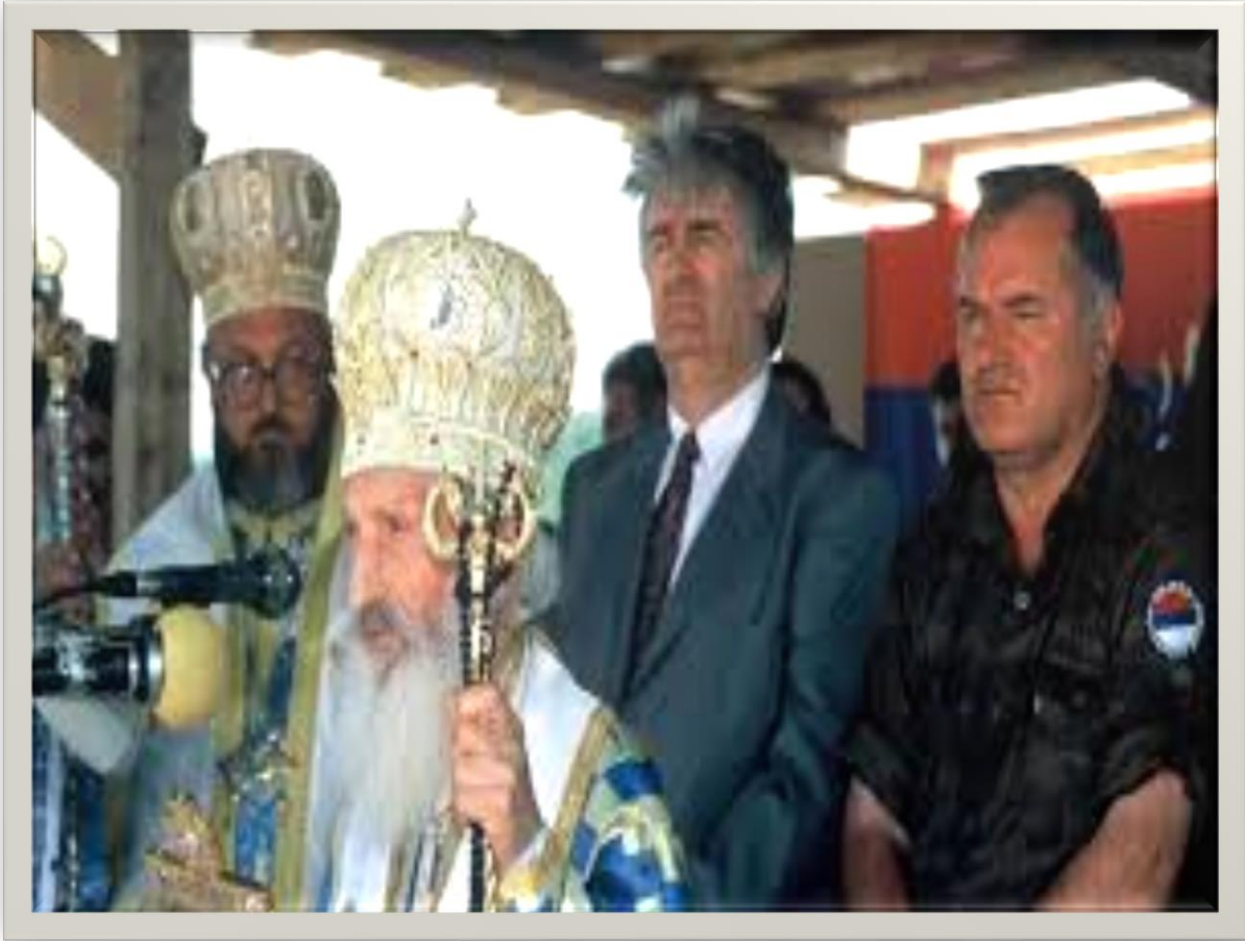
(11 ve 12 Temmuz 1995 günü Srebrenica Soykırımı'nın mimarları)

cephesinin tarihi derinliğinde görebiliyoruz. Ord. Prof. Dr. İsmail hakkı Uzunçarşılı'ya göre (I/186), işte bu karakter ve manevi cephe, devletin şuurlu siyaseti ve azim ve irade kudretiyle bir ahenk teşkil edince bunun neticesinin ne olabileceğini yine Osmanlı tarihi gösteriyor. Bunun için Gibbons'un Osmanlılardan bahsederken "yeni bir millet teşekkül ediyor" ifadesi çok yerinde kullanılmıştır. Bu, tarihi hadiselerin mâ'kes bulmasıdır.