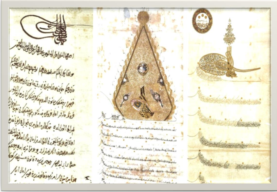
(Fatih Sultan Mehmet Han'ın Fetih sonrası Galata halkına verdiği yazılı ahidnâme.)

mesi'nin (Önkal,1999: 199-200) yansımasından başka ne olabilir ki?