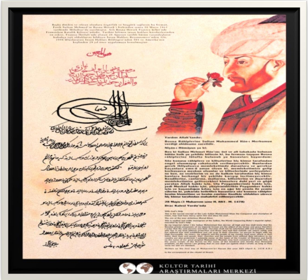
(Bosna-Hersek Fojnica şehrindeki Fransisken Kilisesi'nde bulunan Fatih Sultan Mehmed Han'ın Bosnalı ruhanilere verdiği tarihî ferman.)