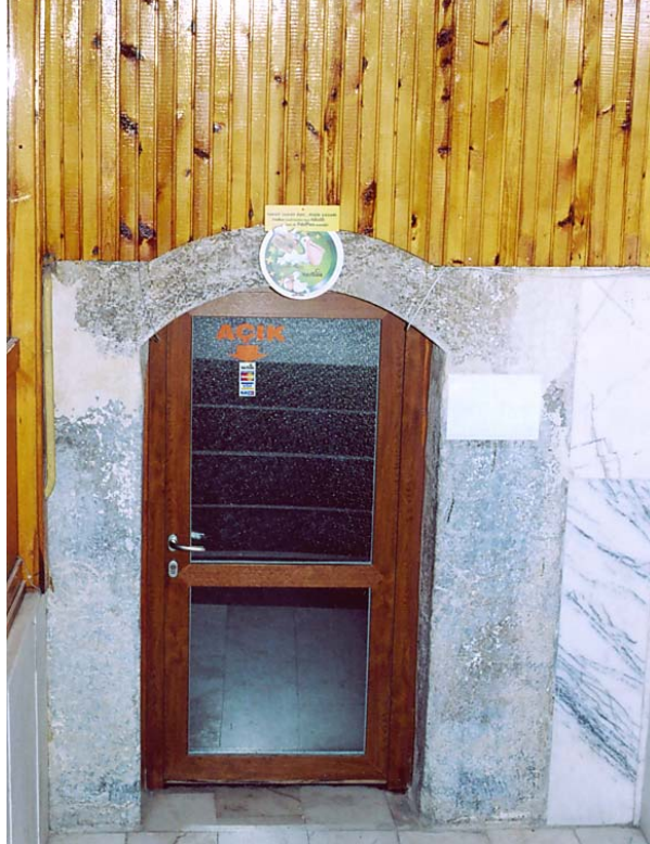
Resim 6. Mahkeme Hamamı Erkekler Bölümü Soyunmalık Giriş Kapısı