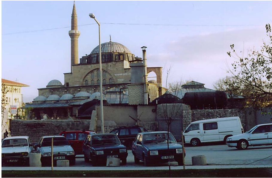
Resim 4. Mahkeme Hamamı Su Deposu ve Külhanı, Kuzeyden Görünüm