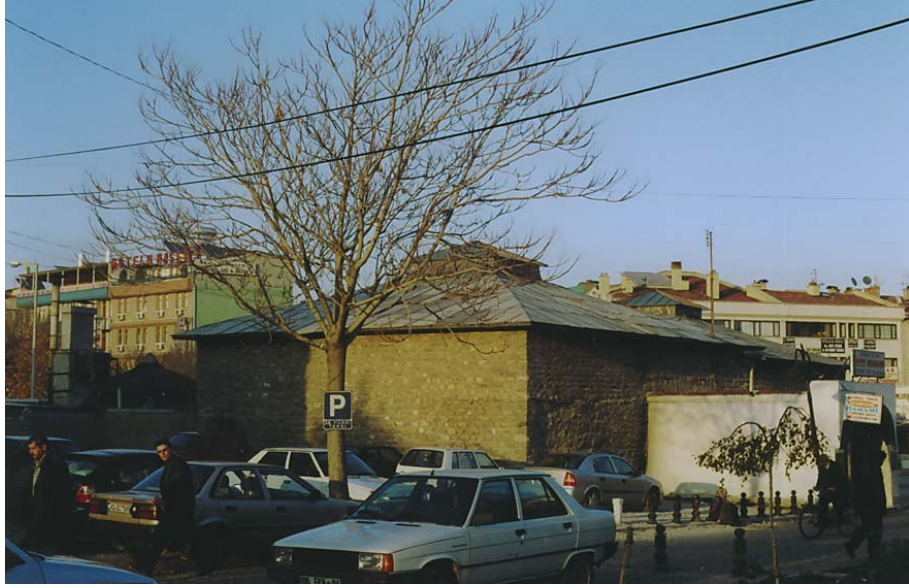
Resim 3. Mahkeme Hamamı Erkekler Bölümü, Güney batıdan görünüm