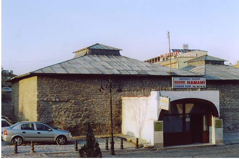
Resim 1. Mahkeme Hamamı'nın Erkekler Bölümü Girişi, Güneyden Görünüm