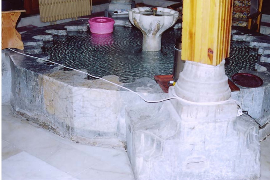
Resim 7. Mahkeme Hamamı Erkekler Bölümü Soyunmalık Şadırvanı