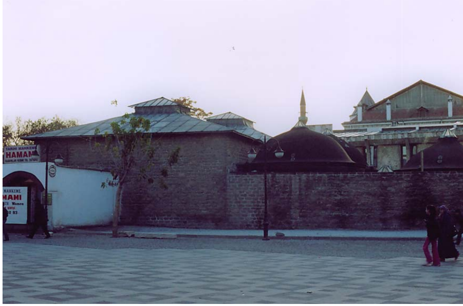
Resim 5. Mahkeme Hamamı Kadınlar Bölümü, Doğu Cephesi