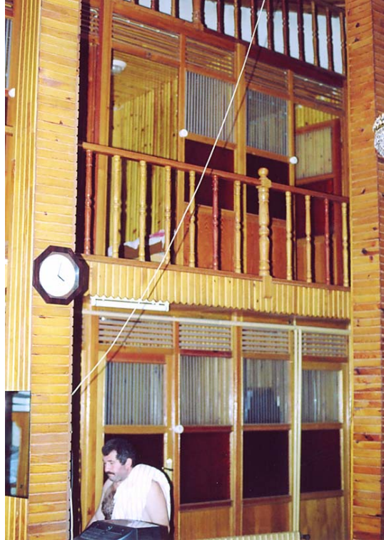
Resim 8. Mahkeme Hamamı Erkekler Bölümü Soyunmalık Camekanları