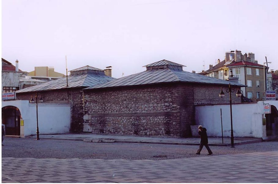
Resim 2. Mahkeme Hamamı Kadınlar Bölümü Girişi