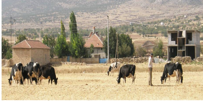
Foto 6. İlçe Merkezinde Otlayan Büyükbaş Hayvanlar

Küçükbaş Hayvancılık: Küçükbaş hayvancılığının 15.167'sini koyun, 1431'i kıl keçisi oluşturur. Koyun yetiştiriciliği genelde köylerde, kıl keçisi yetiştiriciliği ise Hacıba Dağı eteklerindeki yörelerde yapılmaktadır. Koyun işletmelerinin % 80'i, keçi işletmelerinin %60'ı 1-50 baş kapasiteli işletmelerdir.