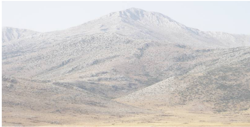
Foto 1. Kâzımkarabekir batısındaki Hacıbaba dağı

Kâzımkarabekir ilçesi, jeomorfolojik görünümü itibarıyla batısındaki Hacıbaba Dağı (2481 m.) ile kuzeydoğusundaki volkanik Karadağ (2271 m.) kütlesi arasında kalan dalgalı düzlüklere sahiptir. Hacıbaba Dağı (Busala Dağı) 2481 m. yüksekliği ile Konya bölümünün en yüksek noktasını teşkil etmektedir. Bu dağın kuzey yamacı, Konya Kapalı Havzası'na, güney yamacı ise Göksu Nehri ile Akdeniz'e sularını boşaltır. Dağın kalker yapıda olması önemli ölçüde karstik erime ve aşındırma şekillerinin görülmesine neden olmuştur. Yerleşim birimlerinin tamamı Karadağ ve Hacıbaba Dağı arasındaki ovalık sahada yer alır.