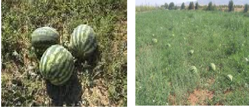
Foto 4. Kâzımkarabekir’de Paşa Karpuzu

Yıllara göre sebzeçilikte de çok fazla bir değişikliğin görülmele yalnızca kabak üretimindeki azalma dikkati çeker. Kabak üretimindeki düşüş gerek tarım müdürlüğü gerekse çiftçilerden alınan bilgiler doğrultusunda ekonomik değerinin az olmasından kaynaklandığı belirtilmiştir. Yine 2003 yılında sebze üretiminde bir düşüşün olduğu görülür (Tablo: 7).