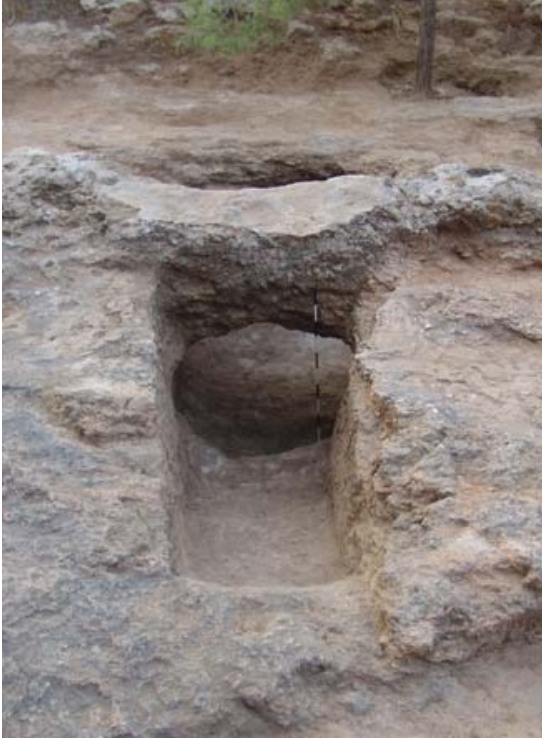
Resim 1: Mezarın güneydoğudan görünüşü