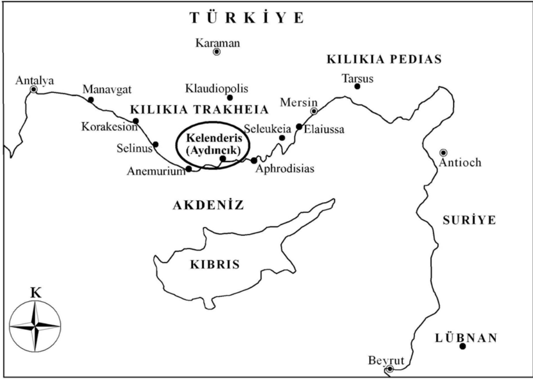
Harita 1: Kilikya Bölgesi ve Kelenderis'in yerini gösteren harita