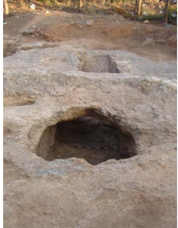
Resim 2: Mezarın kuzeybatıdan görünüşü