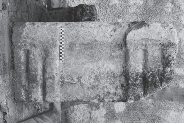
Levha 4. Tarsus Müzesi II nolu triglif-metop bloğu.