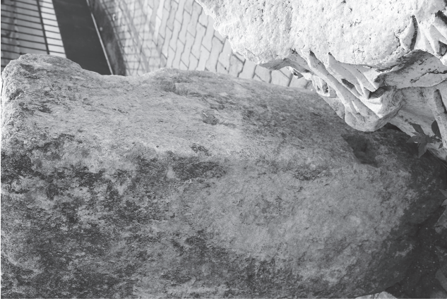
Levha 2. Tarsus Müzesi I nolu triglif-metop bloęu, üst ve arka yüzey.