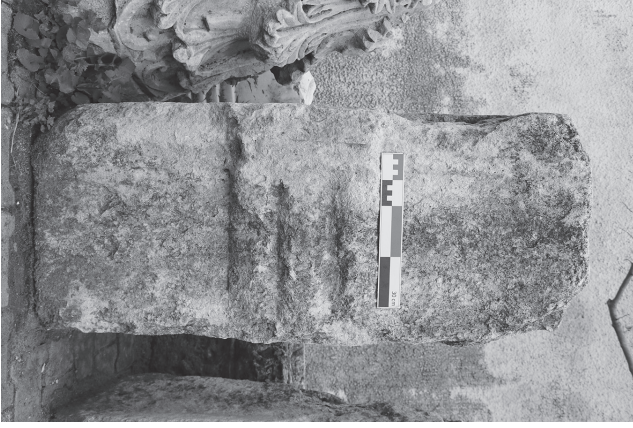
Levha 1. Tarsus Müzesi I nolu triglif-metop bloęu.