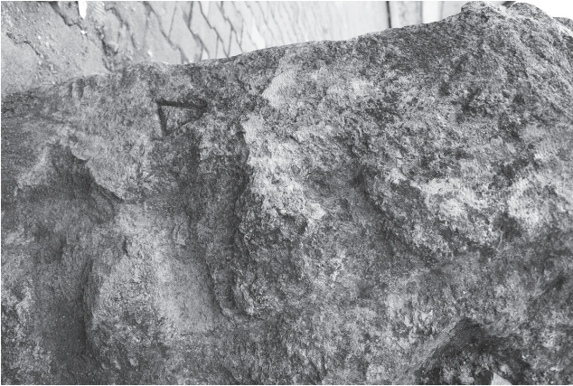
Levha 5. Tarsus Müzesi II nolu triglif-metop bloğu, alt yüzey.