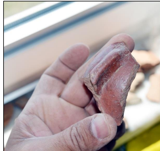
Resim 4: Asarıntaş Yerleşimi M.Ö. II. Binyıl Keramik