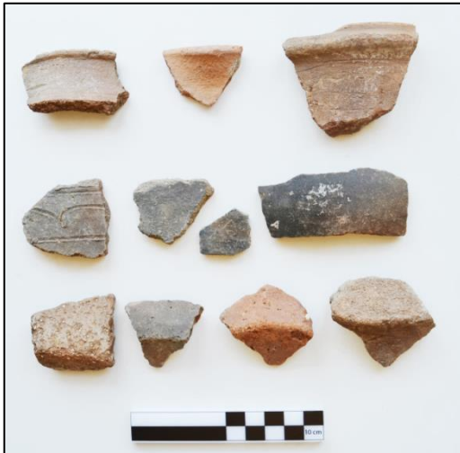
Resim 3: Sarıtaş Yerleşimi M.Ö. II. Binyıl Keramikleri