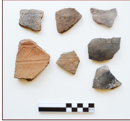
Resim 2: Köroğlu Kalesi M.Ö. II. Binyıl Keramikleri