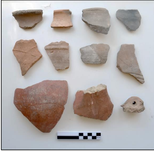
Resim 1: Kaledere Kalesi M.Ö. II. Binyıl Keramik Örnekleri