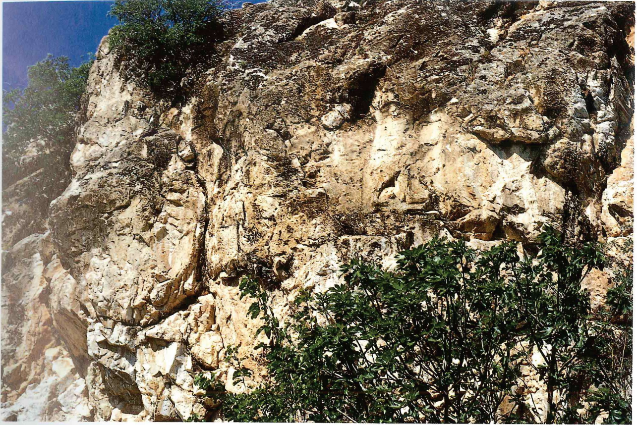
Abbildung 1: Die Gesamtansicht des Felsmonuments.