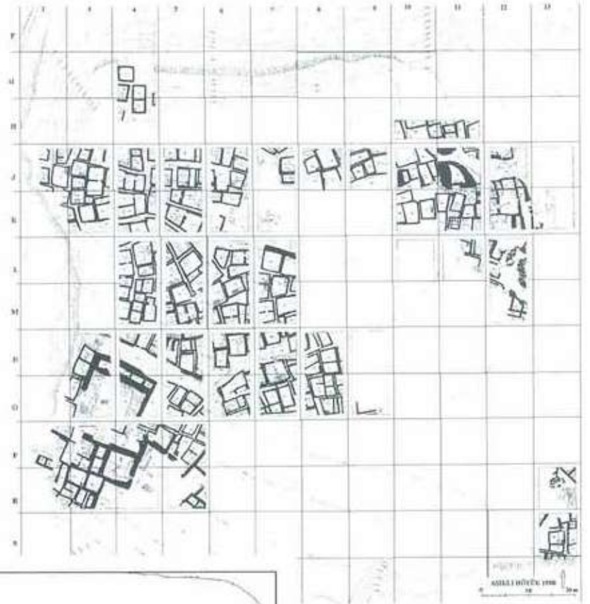
Fig. 1: Aşıklı Höyük (Esin, U; Harmankaya, S. 1999, 90).

Feeding Cities: Specialized Animal Economy in the Ancient Near East , Washington, D. C., Smithsonian Books.