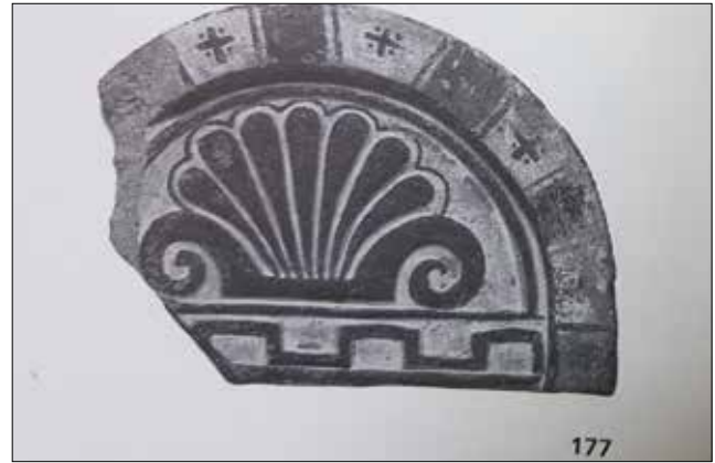
Figür 10. Ny Carlsberg Glyptotek Müzesi'nde korunan Düver buluntusu antefiks, Johansen 1994, 235, Fig. 177. / The Antefix found Düver, in The Ny Carlsberg Glyptotek Museum, Johansen 1994, 235, Fig. 177.

Yarım disk biçimli olmaları nedeniyle Lakonia tipi 35 kiremitler sınıfına giren Düver antefiksleri (fig. 1-10) Anadolu'daki diğer bütün buluntu merkezlerindeki (fig. 11) örneklerden form ve bezek yönünden ayrılır, kendine has form özelliği ve bezeme anlayışı sergiler. İonia atölyelerinin ürünleri olan ve Euromos 36 , Miletos 37 , Koranza 38 , Didyma 39 , Klazomenai 40 ,