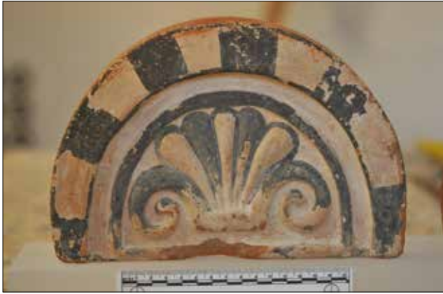
Figür 7. Katalog 7'ye ait antefiks, foto S. Ateşlier. / Catalogue 7-Antefix, foto by S. Ateşlier.