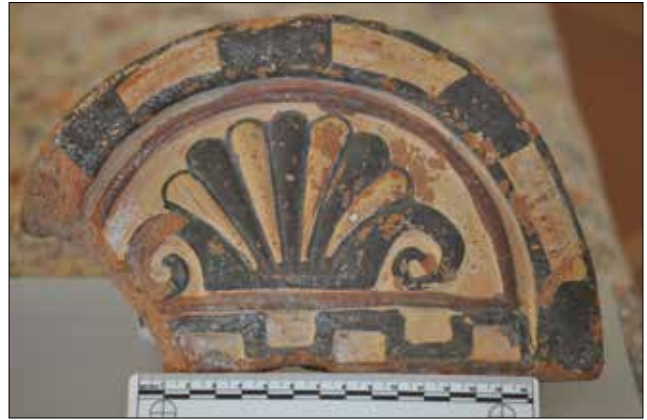
Figür 5. Katalog 5'e ait antefiks, foto S. Ateşlier. / Catalogue 5-Antefix, foto by S. Ateşlier.

sahip olanlar Katalog 1-4'de (fig. 1-4), genişlikleri 24 cm. civarında olanlar ise Katalog 5-9'da (fig. 5-9) düzenlenmiştir. Yarım disk biçimli Lakonia tipi 18 kiremitler sınıfına giren Düver antefikslerinin 19 formu aynıdır, sadece kaplandıkları çatılara göre değiştiği için ölçülerinde farklılıklar vardır.