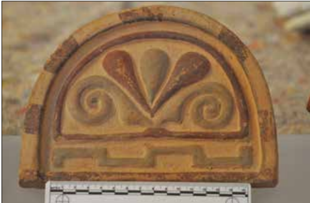
Figür 2. Katalog 2'e Ait Antefiks. / Catalogue 2-Antefix.