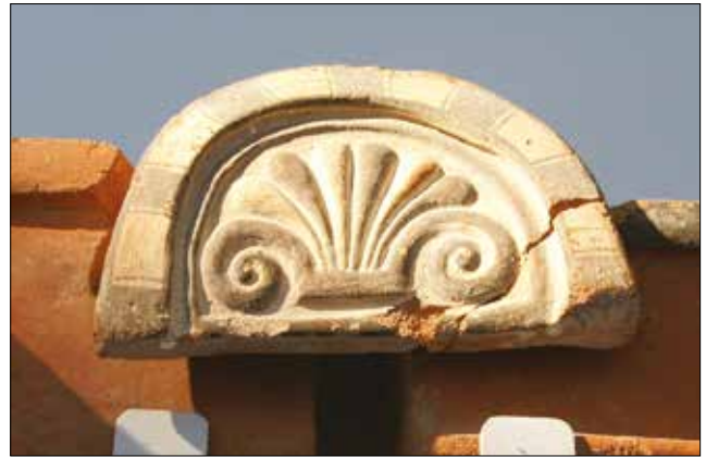
Figür 9. Katalog 9'a ait antefiks, foto S. Ateşlier. / Catalogue 9-Antefix, foto by S. Ateşlier.