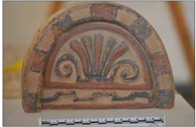
Figür 4. Katalog 4'e ait antefiks. / Catalogue 4-Antefix.