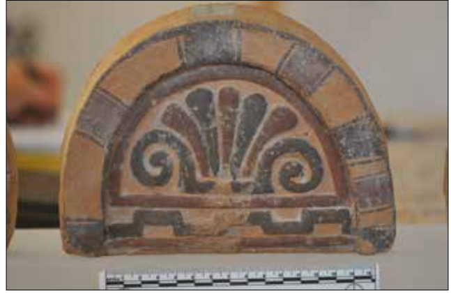
Figür 3. Katalog 3'e Ait Antefiks, foto S. Ateşlier. / Catalogue 3-Antefix, foto by S. Ateşlier.