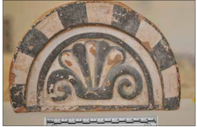
Figür 8. Katalog 8'e ait antefiks. / Catalogue 8-Antefix.