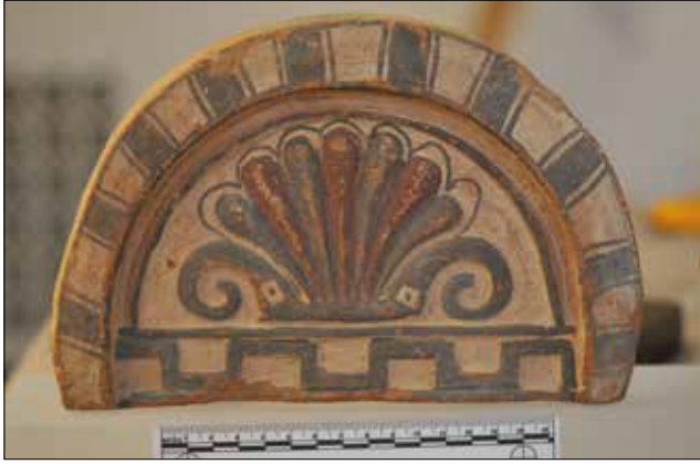
Figür 6. Katalog 6'ya ait antefiks, foto S. Ateşlier. / Catalogue 6-Antefix, foto by S. Ateşlier.