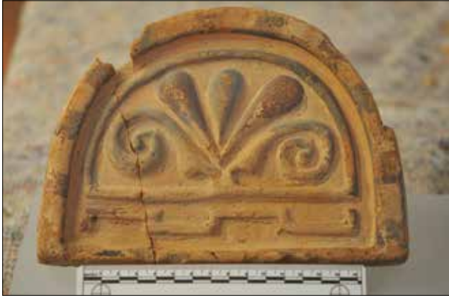
Figür 1. Katalog 1'e Ait Antefiks. / Catalogue 1-Antefix.

Ny Carlsberg Glyptotek Müzesi'ndeki antefiksler, envanter numaraları, müze içindeki yerleri ve ölçüleri verilerek, detaylıca tanımlanıp, Katalog 1-9'da (fig. 1-9) sunulmuştur. Eserler birer mimari eleman olduğu için katalog sıralaması işlevlerine göre yapılmış, ölçüleri dikkate alınarak yaklaşık 20 cm. genişliğe