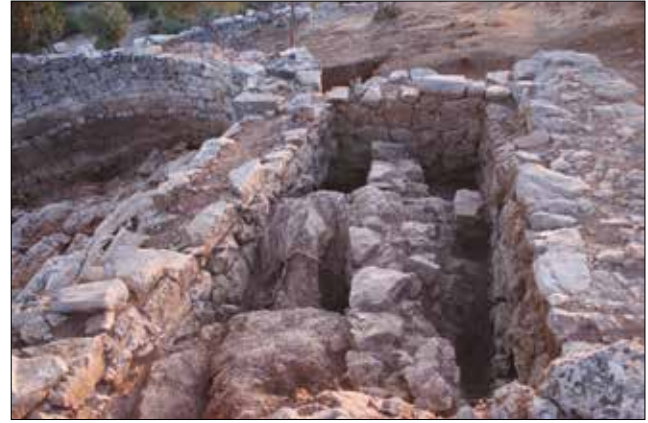
Figür 8: Kilise Güney Nef İçerisindeki Duvar Kalıntısı / Wall Remains in the Southern Nave of the Church (M. Bulba)

yapılmış kuzey-güney doğrultusunda uzanan duvar sonradan yapılarak doğu-batı doğrultusunda uzanan duvarla birleştirilmiş olup, iki duvarın organik olarak birbirlerine bağlanmadığı görülmektedir. Bu duvarın batı tarafında adaklara ait buluntu tabakası yer almaktadır. Kiliseden erken oldukları kesin olan bu duvarları buluntu tabakaları ile ilişkilendirmek mümkündür. Kısmen özenli kesilmiş anakaya oturmasıyla hem de daha iyi korunan doğu-batı doğrultusundaki duvarın kaliteli işçiliği nedeniyle adaklarla aynı dönemden yani MÖ 4. veya 3. yüzyıldan olduğu düşünülmektedir. Bu özenli işçiliğine rağmen, çok küçük bir alanının korunması ve duvarın ince olması nedeniyle çok yüksek ve büyük bir yapıya (tapınak vb) ait olamayacağından altar ya da benzeri bir işleve sahip olma ihtimali yüksektir.