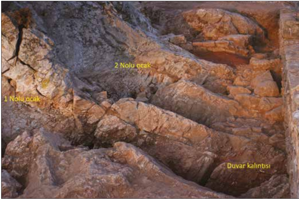
Figür 9: Ocaklar ve Kuzey Yöndeki Duvar / Hearts and Wall in the North (M. Bulba)

bölüm bağımsız bir duvar olmaktan çok anakayaya işlenmiş olan ‘sunu çukurlarını’ ve ‘kanallarını’ sınırlayan küçük bir ‘teras’ duvarı olarak yapılmış olmalıdır. Duvarın kuzey kenarı düz bir hatta sahip iken güney bölümü anakayaya kadar doldurulmuştur. Anakayanın üzerine oturan ve nispeten iri taşlardan yapılmış olan bu alçak duvarın üzeri oldukça düzdür. Korunan haliyle duvar sunu çukuru kanallarının başlangıç seviyesine kadar yükselmektedir. Duvarın hemen üzerindeki küçük bir alanda yoğun şekilde çatı kiremidi kırıklarına rastlanmıştır (Fig. 10). Bu kırıklar, duvarın üzerinde basit, çatısı kiremitlerle kaplı, olasılıkla da ahşap bir konstrüksiyon bulunduğunu göstermektedir. Şu ana kadar terasın diğer alanlarında yapılan kazılarda başka herhangi bir mekanda çatı kiremidi kalıntısına rastlanmamıştır. Bu duvar sunu çukurları önündeki kült uygulamaları sırasında üzerinde durmak amacıyla