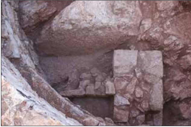
Figür 7: Kilise Apsisi İçerisindeki Duvar Kalıntıları / Wall Remains in the Church Apse (M. Bulba)