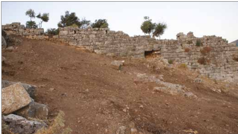
Figür 4: Teras Doğu Duvarı ve Niş / The Wall of the Terrace from East and Niche (M. Bulba)

Teras, son evrede kuzeybatı köşesine eklenen küçük teras bölümü hariç olmak üzere bugünkü genişliğine üçüncü evresinde ulaşmış olmalıdır (Fig. 4). Ortadaki birleşik iki duvarın doğu ve batı taraflarına olasılıkla eş