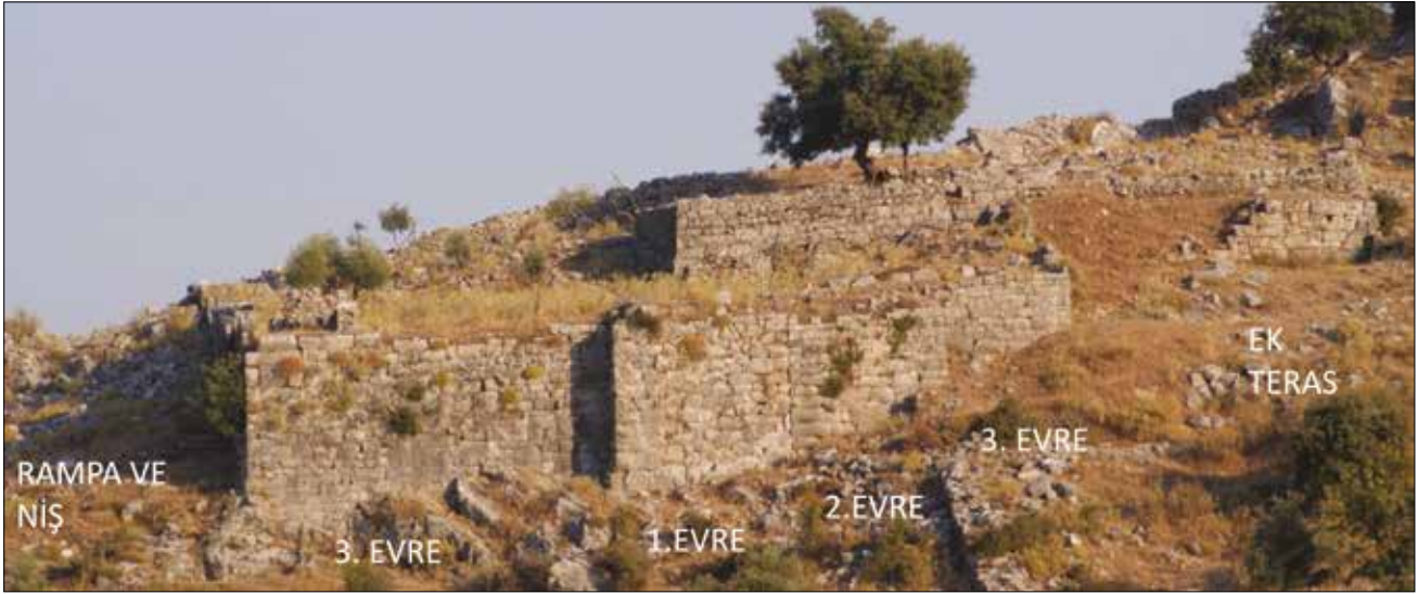
Figür 6: Terasın Olası Evreleri / Possible Phases of the Terrace (M. Bulba)