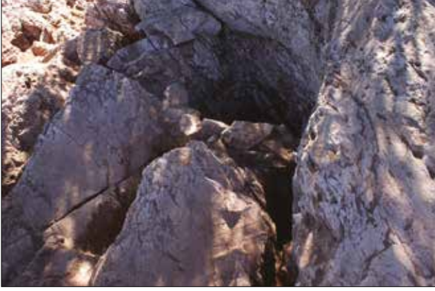
Figür 15: 2 Nolu Ocak ve Kanallar / Hearth No:2 and Trenches (M. Bulba)