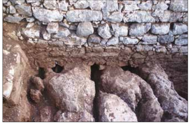
Figür 12: Kilise Orta Nefi Kuzey Yönündeki Kanallar / Trenches in the North of the Center Nave

Kaunos'un kiliseleri hakkında çalışan A. Zâh tarafından yayınlanan iki makalede de bazilikal planlı olarak nitelendirilen Demeter Terası'ndeki bu yapı olasılıkla kentin en erken ve en büyük kilisesidir 10 . Zâh'e göre kilise erken döneme ait yapıların üzerine ve bu yapıların devamı olarak inşa edilmiştir. Kendisi, kilisenin kuzey duvarının terasın destek duvarının bir kısmını oluşturduğunu düşünmektedir. Zâh aynı şekilde dışarıdan yarım daire biçimli olan apsisin de olasılıkla düz olan teras