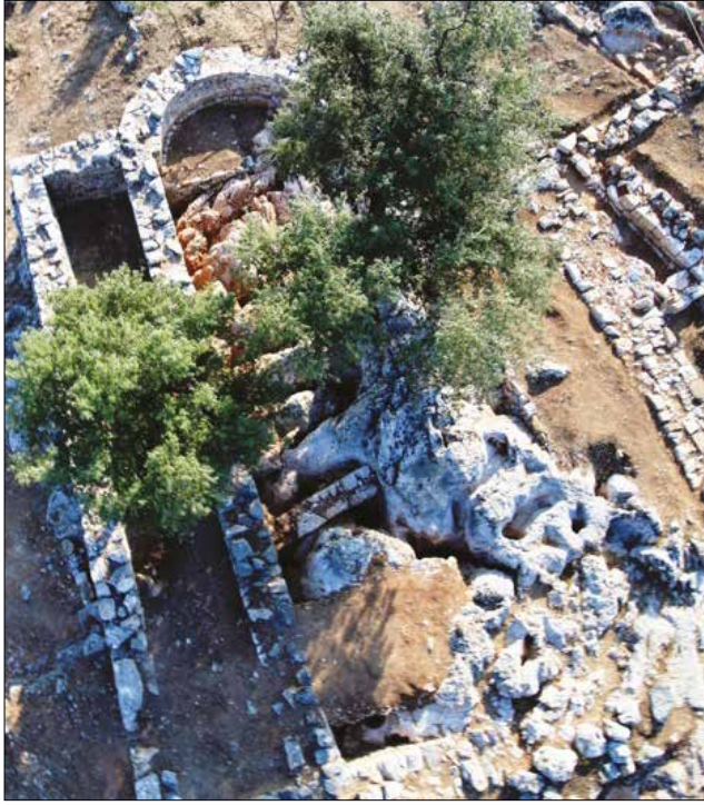
Figür 3: Kilise ve Kayalık Alan / Church and the Rocky Ground

Eğimin en yüksek olduğu kuzey tarafta korunduğu kadarıyla teras duvarının yüksekliği 6.30 m'ye kadar ulaşmaktadır. Belirgin bir şekilde farklı taş işçiliklerine sahip olan bu duvar terasın yapım aşamaları hakkında güvenilir bilgiler vermektedir. Buradaki duvarın özelliklerine göre teras tek bir evrede değil üç aşamada oluşmuş, dördüncü aşamada ise batı tarafına iri bloklardan bir destek duvarı örülerek küçük bir teras daha yapılarak son halini almıştır. Terasın kente bakan cephesini oluşturan bu yönde yapılaşma evreleri şu şekilde olmalıdır: Kuzey duvarının orta kısmında terasın