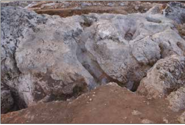
Figür 16: Anakaya Bloğunun Batısındaki Kanallar ve Oyuklar / Trenches and Cavities to the West of the Bedrock Block (M. Bulba)

391 yılında tüm çoktanrılı inançların yasaklandığı ve 379-395 tarihleri arasında imparator Theodosius tarafından çıkarılan ferman ile tapınakların ve kutsal alanların kiliseye dönüştürülmeye başlandığı bilinmektedir 12 . Pagan yapılardan dönüştürülen kiliseler genel olarak Erken Bizans Dönemi'ne aittirler 13 . Kaunos'un en erken ve en büyük kilise kalıntısının karşımıza çıktığı bu yapı olasılıkla da kentin ilk piskopos kilisesidir ve bu alanın terk edildiği MÖ 7. yüzyıldan önce yapılmış olmalıdır 14 . Kazı ve araştırmalar Bizans Dönemi'ne ait çok küçük iki sırlı seramik parçası dışında herhangi bir buluntu ortaya koyamamıştır.