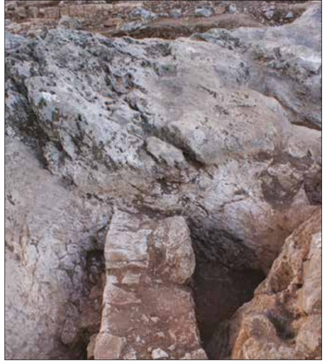
Figür 5: Teras Batı Duvarı ve Kaya Bloğu Üzerindeki İzler / The Western Wall of the Terrace and Traces on the Rock Block (M. Bulba)

Üçüncü evrede yapılan ve surlara kadar uzanan batı teras duvarının izleri kilisenin ortasındaki kaya bloğu üzerinde izlenebilmektedir. (Fig. 5) Eğer kutsal alanın sınırları