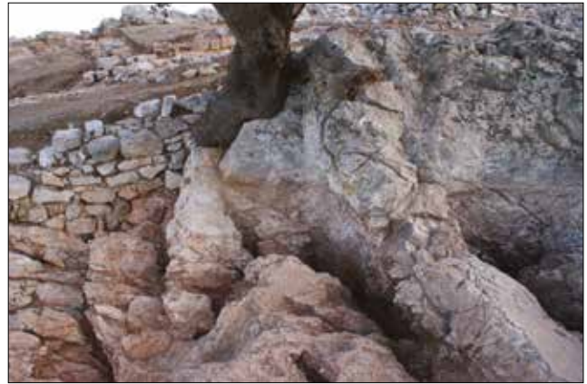
Figür 14: Ocak ve Kanallar / Hearts and Trenches (M. Bulba)

duvarının değiştirilmesi sonucu oluşturulduğu sonucuna ulaşmıştır 11 . Ancak yazar buradaki gözlemlerini alanda temizlik ve kazı çalışmalarından önce yapmıştır. Bu nedenle yukarıda da vurgulandığı gibi kilise tamamen bağımsız olarak yapılmıştır ve erken dönemde altında herhangi bağımsız bir mekana ait iz bulunmamaktadır.