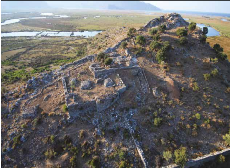
Figür 1: Küçükale ve Demeter Terası (Kazı Arşivi) / Küçükale and the Terrace of Demeter (Archiv of the Caunos-Excavation)

Bizans Dönemi'nde merkezine bir kilisenin inşa edildiği kutsal alan için yapılan teras Küçükale'nin önemli bir bölümünü kaplamaktadır (Fig. 1). Terasın limana ve kente hakim konumu, kutsal alana verilen önemi göstermektedir. 31.10 x 32.20 m boyutlarıyla ana teras yaklaşık kare biçimlidir ve köşelerinin uçları yaklaşık olarak kuzey, güney, doğu ve batı gibi ana yönlere gelecek şekilde konumlandırılmıştır. Büyük Akropolis'den gelen surların uzandığı Küçükale'nin sırtı terasın güney sınırını oluşturmaktadır. Terasın batı bölümünü, terasın son evresine ait polygonal bloklardan yapılmış duvar oluşturmaktadır. Ancak yukarı uzanan merdivenlerin terasla birleştiği noktadan itibaren bu duvar büyük oranda tahrip olmuştur. Bizans Dönemi'nde bu alana nartheksin giriş duvarı yapılmış olan bu duvar da büyük oranda yıkılmıştır.