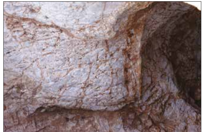
Figür 16: Kanal Üzerindeki Matkap İzleri / Drill Marks on the Trench (M. Bulba)

Terasın üzerine Kaunos'un en erken ve en büyük kilisesinin inşa edilmiş olması, bu alanın kutsallığının Bizans Dönemine kadar devam ettiğini göstermektedir. Ancak alanda bu döneme ait hiçbir buluntunun ele geçmemesi kilisenin olasılıkla hiçbir zaman bitirilmediği ve kullanıma alınmadığını göstermektedir.