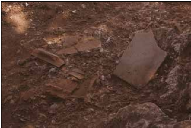
Figür 10: Çatı Kiremitleri / Roof Tiles (M. Bulba)

Kilise ve müstemilatı dışında ele geçen ve birbirleriyle alakalı olmadıkları anlaşılan üç duvar kalıntısından başka, zemini ve duvarlarının ikisi kısmen anakayadan işlenmiş oda biçimli bir mekan yer almaktadır (Fig. 11). Bu odanın zemini anakayanın düzlenmesiyle oluşturulmuş, zemindeki boşluklar da anakaya kırıklarıyla doldurularak düz bir zemin elde edilmeye çalışılmıştır. Batı ve güneyde odanın kenarları anakayanın izin verdiği seviyeye kadar düzgün bir şekilde dik olarak biçimlendirilmiş olup diğer bölümlerinde sınırlayıcı bir kalıntı korunmamıştır. Hıristiyanlık döneminde nartheksin bir bölümünü oluşturan bu oda içerisinde yapılan kazılarda buranın işlevini ya da kült uygulamalarını açıklayabilecek herhangi bir buluntuya rastlanmamıştır. Bununla birlikte, merdivenlerin olduğu batı tarafın hemen girişinde yer