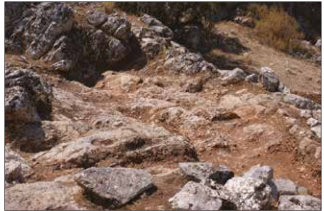
Figür 11: Kaya Odası / The Room in the Rocky Area (M. Bulba)