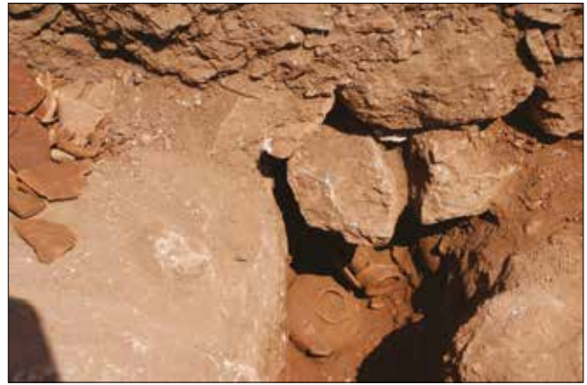
Figür 13: Kilise Orta Nefi Kuzey Duvarı Altındaki Kanal ve İçerisindeki Adaklar / The Trench Under the Northern Wall of the Church and the Offerings (M. Bulba)