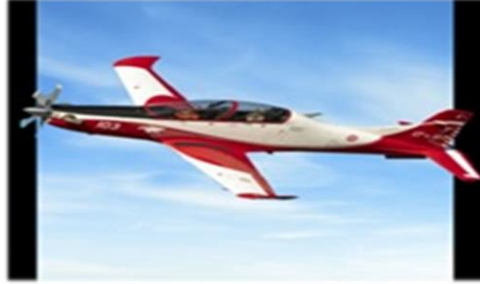
Şekil-2: Hürkuş Eğitim Uçağı

İsmi tarihi kahraman şahsiyetlerden alan bir diğer savunma sanayii ürünü, Hürjet ve Hürkuş'tur. Türk havacılık tarihinin başlangıcında yer alan; ilk Türk uçağı tasarımcısı ve üreticisi olan Vecihi Hürkuş'a ithaf edilen bu eğitim uçağı ve jetleri, temel eğitim ve savaş uçağı dönüşümü arasındaki tüm eğitim kademelerinde kullanılmak ve zorlu operasyonlarda yakın hava desteği görevlerini yerine getirmek üzere, yeni nesil gelişmiş eğitim ve hafif taarruz uçağı olarak üstün performans sağlaması amacıyla tasarlanmıştır. Hürkuş'un, en zorlu görevler için maliyet etkin bir çözüm sunduğu belirtilmektedir (Savunma Sanayii Ürün Kataloğu 10 , 2019: 136).