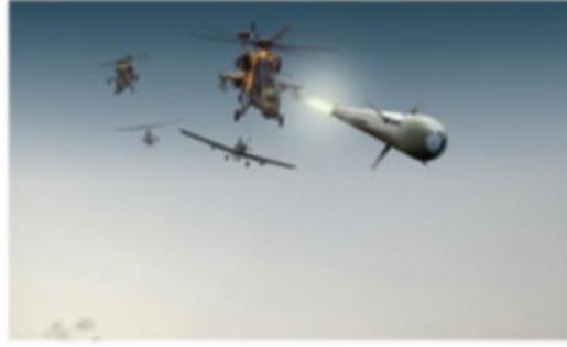
Şekil-3: Cirit Füzesi

Göz ile görülemeyen dalga boyunda ışımaya yapan cihaz, gece görüş gözlüğü kullanan dost unsurlara hedef göstermek için kullanılmaktadır (SSÜK, 2019: 385). Yine Türklerin hem savaş hem de geleneksel sporlarında kullandıkları Cirit, günümüze savunma sanayiince, lazer güdümlü füze ad olarak verilmiştir. Lazer Güdümlü Füze, taarruz helikopterlerinden hafif zırhlı/zırhsız, sabit ve hareketli hedeflere karşı kullanılan yüksek hassasiyetli bir silah olarak kullanıma sunulmaktadır. Füze ismi olarak karşımıza çıkan başka bir isim de Kara Ok'tur. Taşınabilir anti-tank füze sistemi olarak hava hücum, hava indirme ve amfibi harekâta komando ve piyade taburlarının düşman zırhlı ve mekanize birliklerini kısa menzilde durdurma, geciktirme, kanalize etme ve imha etme görevlerini gerçekleştirmek amacıyla kullanılacak olan Kara Ok, rengi ve şekli ile Türklerin kadim savaş aletlerinden olan ok ile kurulan analogi sebebiyle bu ismi almıştır (SSÜK, 2019: 191).