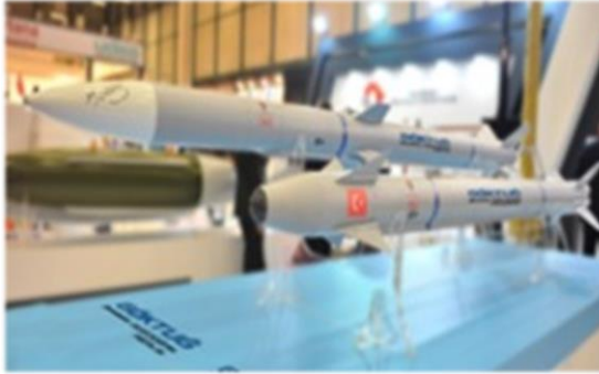
Şekil-6: Bozdoğan Füzesi

Türk mitolojisinde ongun olarak kullanılan doğanlar, pek çok alt türe sahip bir canlı olarak karşımıza çıkmaktadır. Mitolojik anlatımlarda Bozdoğan, Tanrı ile Türkler arasında aracılık yapan, adeta tanrının elçisi kabul edilen kutsal bir kuş olarak görülmektedir. Gücü ve yırtıcılık özelliğiyle de ön plana çıkan bozdoğan ve gökdoğanlar, en üstün öldürücülük kabiliyetine sahip hava-hava füzelerine ad olarak verilmiştir 11 .