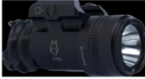
Şekil-1: Gök Börü