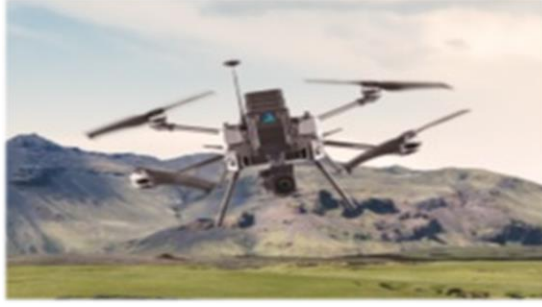
Şekil-5: Togan İnsansız Hava Aracı

Bahsedilen isimlerden olan Togan, kadim Türk mitolojisinde doğan kuşudur ve her Oğuz boyunun doğan kuşunun bir cinsi olan türevinden ongunu olduğu bilinmektedir. Savunma sanayiinde genel maksatlı keşif ve gözetleme görevlerinde kullanılmak üzere özgün görev planlama ve uçuş kontrol yazılımına sahip, özerk olarak veya uzaktan kumanda ile tek personel tarafından kullanılabilen ve taşınabilen, Çok-Rotorlu, Döner Kanatlı Milli Mikro İHA platformuna da Togan ismi verilmiştir (SSÜK, 2019: 206).