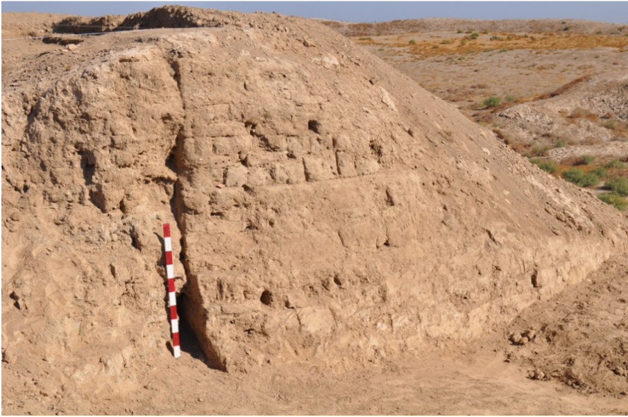
Yerkurgan Merkez Tapınağı dođu duvarı (Foto. İ. eřmeli 2013)