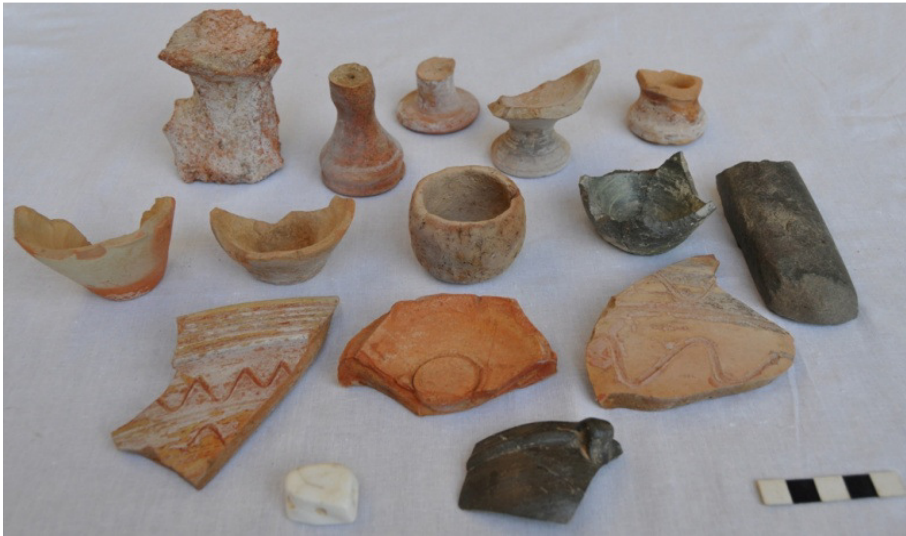
Yerkurgan Merkez Tapınağı kazısı ritüel ve günlük objeler