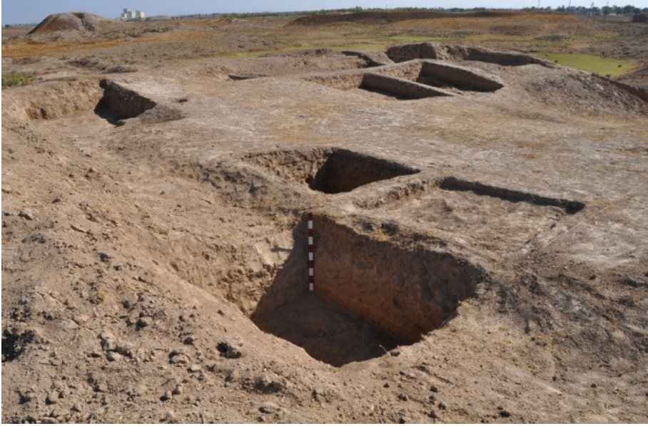
Yerkurgan Merkez Tapınağı kazı alanı kuzeydoğusu (Foto. İ. Çeşmeli 2013)