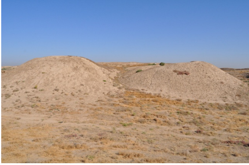
Yerkurgan Merkez Tapınağı güneyden görünüm