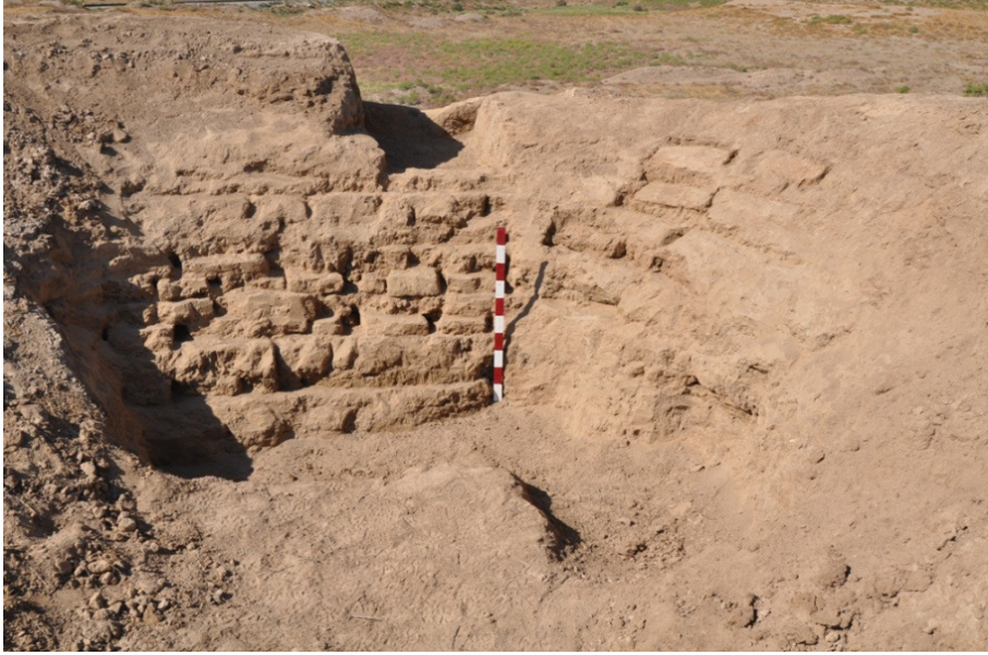
Yerkurgan Merkez Tapınağı kuzeybatı köşe duvarı