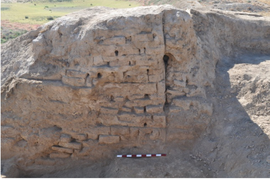
Yerkurgan Merkez Tapınağı dođu duvarı (Foto. İ. eřmeli 2013)