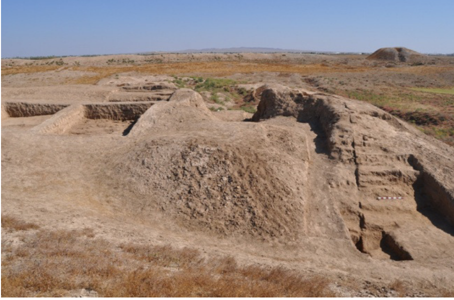
Yerkurgan Merkez Tapınağı kazı alanı güneydoğusu (Foto.İ. Çeşmeli 2013)