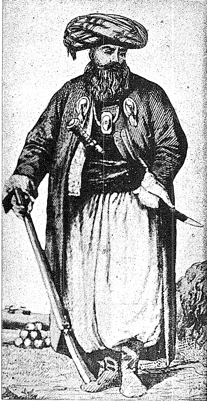
I. Cezayirli Gazi Hasan Paşa.