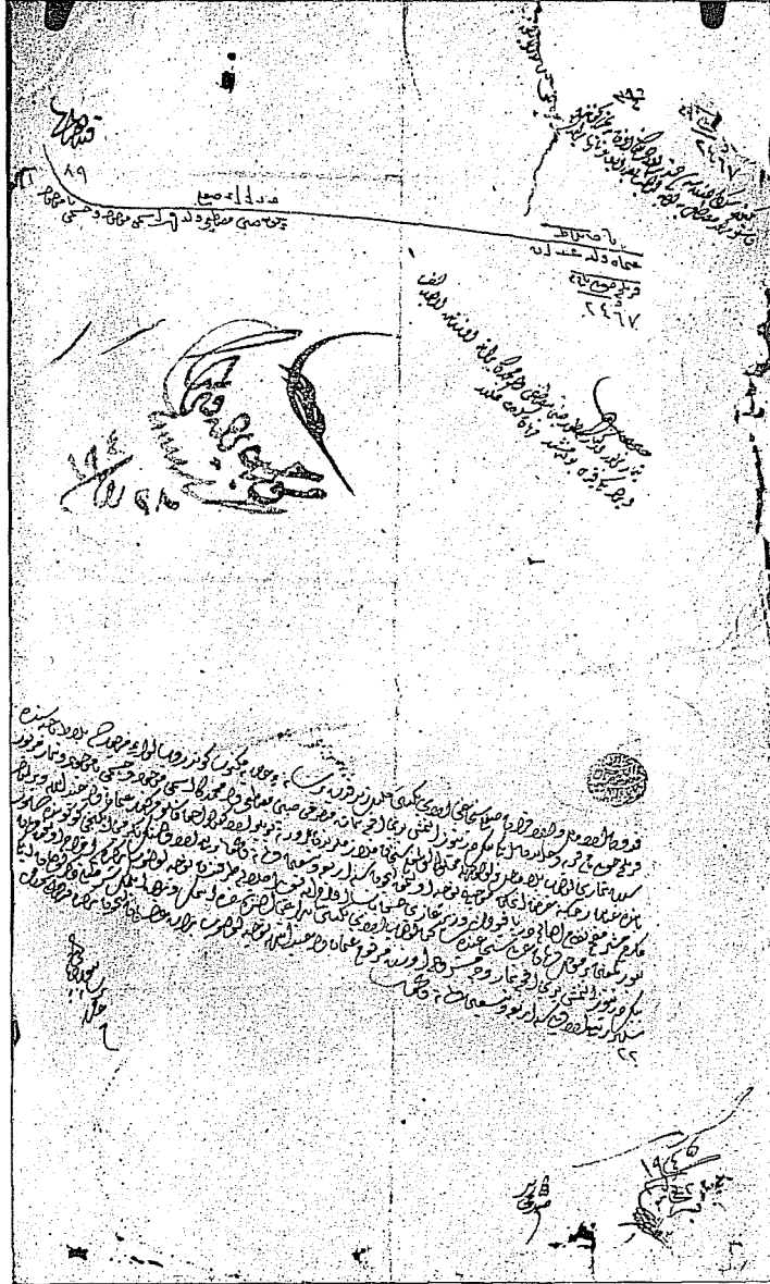
IV. Gazi Hasan Paşa'nın timar tevcihi için hükümete gönderdiği tersane buyruğudur ve cereyan eden muamele.