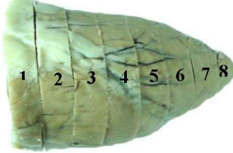
Şekil 1. Stereolojik kesit alımı. Figure 1. Taking stereological section.

Olsen, 1991; Mazonakis ve ark., 1998). Bu kesitlerin, aynı yöne bakan yüzleri üste gelecek şekilde dizilerek kesit numarası verildi.