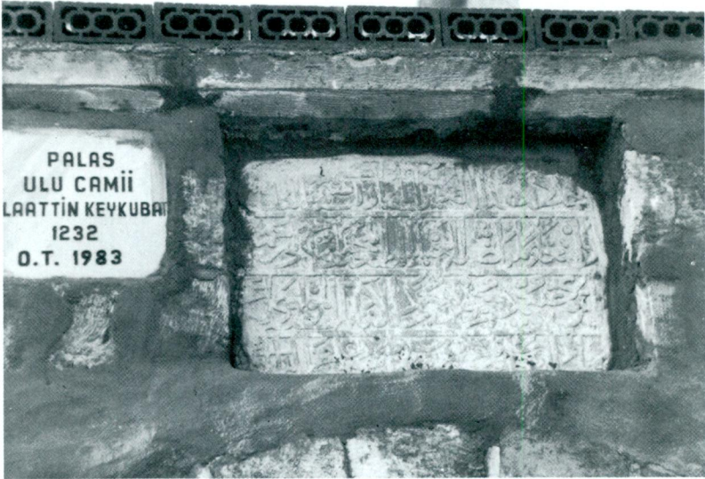
Resim 4 — Palas Köyü Kitabesi