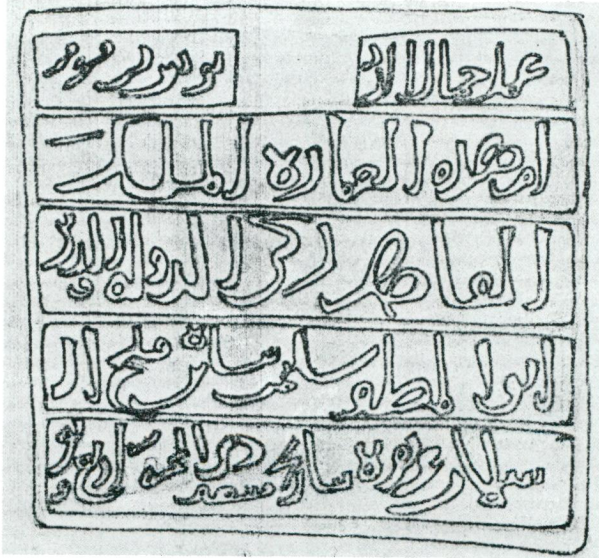
Resim 2 — Niksar Süleyman Şah Kitabesi Çizimi