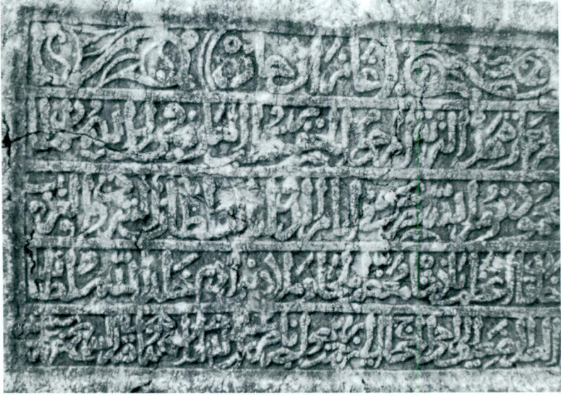
Resim 3 — Gazan Mahmud Han Kitabesi - Gümenek