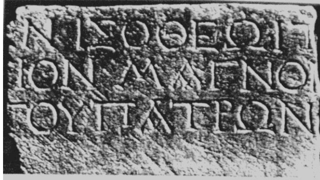
Resim 3. Side halkının General Pompeius için adadığı onurlandırma yazıtı fragmanı. Bean, 1965: no: 101

Korsan tehlikesinin ortadan kalktığı dönem aynı zamanda Pamphylia Bölgesi'nin, Asya Eyaleti'ndeki bazı kentlerle birlikte Kilikia Eyaleti'ne katıldığı süreci kapsamaktadır. Nitekim Cumhuriyetin ünlü simalarından ve o dönem Kilikia Eyaleti'nin valisi olan Cicero'nun (MÖ d. 106-öl. 43) yazdığı mektupta, Side bu eyaletin bir kenti olarak belirtilmektedir (Cicero, 2001: XII, 15). Üstelik Cicero, eyalet valisi olarak atandığında, ikamet edeceği ve görev yapacağı yer olarak ilkin Side düşünülse de bu gerçekleşmemiş ve görev yeri Phrygia bölgesindeki Laodicea (Eskihisar) olarak değiştirilmiştir. MÖ 50 yılında valilik süresi dolan Cicero, Roma'ya geri dönerken de Side'den gemiye binmiştir. Hatta selefi Appius Cladius Pulcher'e yazdığı bir mektupta, Roma'ya dönüşü sırasında Side'de basit bir tören gerçekleştirildiğini ve açıkçası törenden memnun kalmadığını yazmaktadır (Cicero, 2001: III, 6).