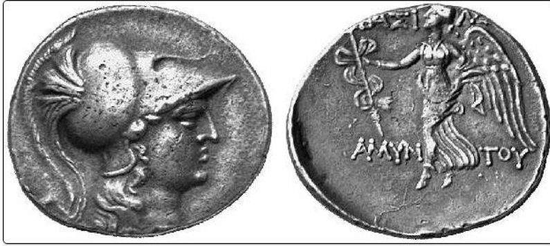
Resim 4. Kral Amyntas döneminden Side'de darp edilmiş gümüş tetradrahmi. http://www.asiaminorcoins.com/gallery/displayimage.php?pid=876 (Erişim Tarihi: 12/05/2021)