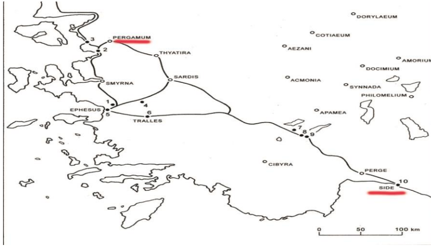
Harita 2. Side'den Pergamon'a (Bergama) giden yol güzergâhı. French, 2012, s. 45)

Buna göre Pergamon'dan Side'ye olan uzaklık günümüz değerleriyle yaklaşık 490 kilometredir. French'in ileri sürdüğü yol güzergâhı, Side'nin Anadolu'daki iç bölgelerle olan ilişkisini yani kentin ticaret ağı içindeki konumunu göstermesi açısından oldukça önemlidir (French, 2012, s. 42; Nollé, 1993: no: 178).