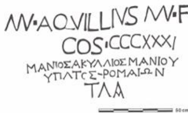
Resim 2. Vali Aquillius'un adını gösteren mil taşı. French, 2012: 55 ve 61