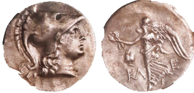
Resim 1. MÖ. II. yüzyıl başlarına tarihlenen ve Side'de darp edilmiş gümüş tetradrahmi. Ön yüzünde miğferli Athena başı, arka yüzde ise; elinde zafer çelengi taşıyan Nike, kentin sembolü olarak kabul edilen nar ve sikke basımından sorumlu memurun isminin baş harfleri görülmektedir. Side Arkeoloji Müzesi, Env. No: 846

Bundan sonra Side'nin bölgedeki varlığı, doğrudan Roma'nın Anadolu politikalarına paralel ilerlemiştir. Cumhuriyet'e verdiği destek karşılığında ve tabii ki ticari tecrübesi sayesinde Side, Akdeniz'in doğusunda serbestçe ticaret yapabilmıştır. Nitekim MÖ. II. yüzyılın ikinci çeyreğinde Side tetradrahmlerinin ticarete önemli bir ödeme aracı olması, kentin yakaladığı avantajı göstermektedir. Kentte ilk bilimsel kazıları gerçekleştiren Prof. Dr. Arif Müfit Mansel ve ekibinden C. Bosch, Pamphylia'nın doğusunun Side de dâhil olmak üzere MÖ II. yüzyıl sonlarında özgür kaldığını bunun da en somut göstergesinin; kente ait bu tür sikkelerle birlikte aynı döneme tarihlendirilmiş arkeolojik ve mimari buluntular olduğunu yazmaktadırlar (Bosch, 1957, s. 37; Mansel, 1978, s. 9–vd). Akdeniz'in doğusu, Ege ve hatta Marmara Denizi kıyılarındaki kentlerde yaygın bir şekilde kullanıldığı görülen Side sikkelerinin; Anadolu üzerinden Suriye ve Mezopotamya'ya kadar yayıldığı bilinmektedir (Atlan, 1967: xiii; Nollé, 1993, s. 65). (Resim 1)