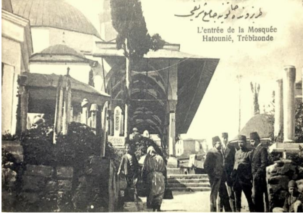
Resim 2: Cami, Türbe ve Şadırvan 150 (Bölükbaşı, a.g.e. , s. 55.)