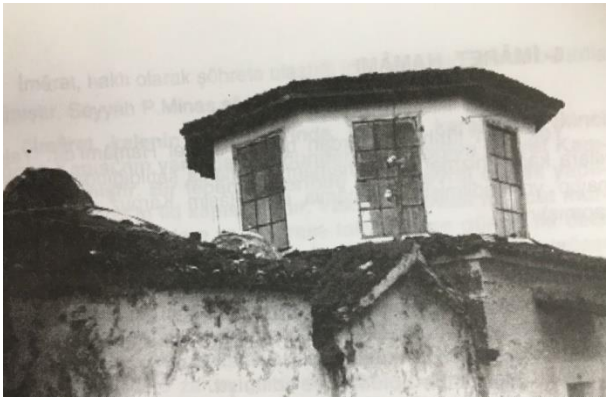
Resim 4: İmaret Hamamı 151 (Albayrak, a.g.e. , s. 70)