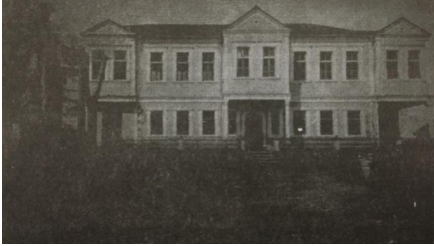
Resim 3: Gülbahar Hatun İlkokulu 1934-1935