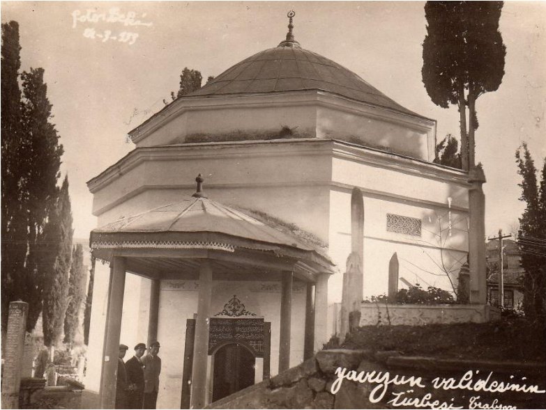
Resim 6: Gülbahar Hatun Türbesi, 1933 (Belge, a.g.t., s. 69.)