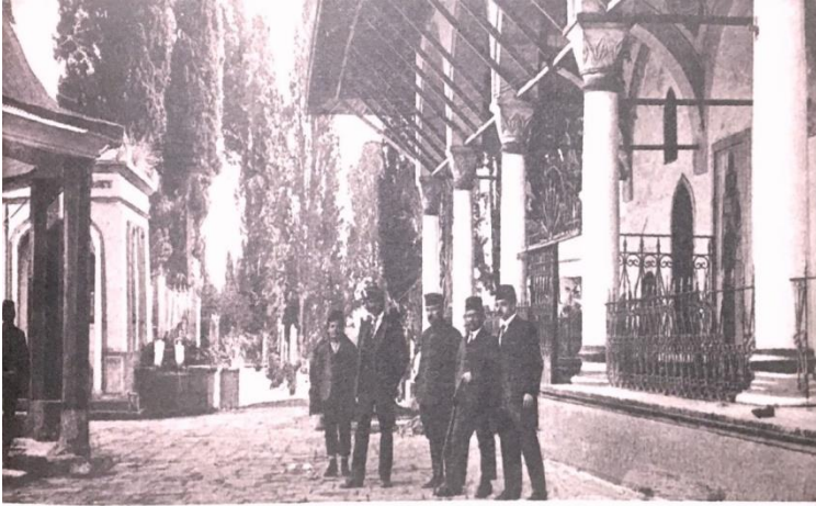
La cour de la mosquée Hatunié — Trébizonde