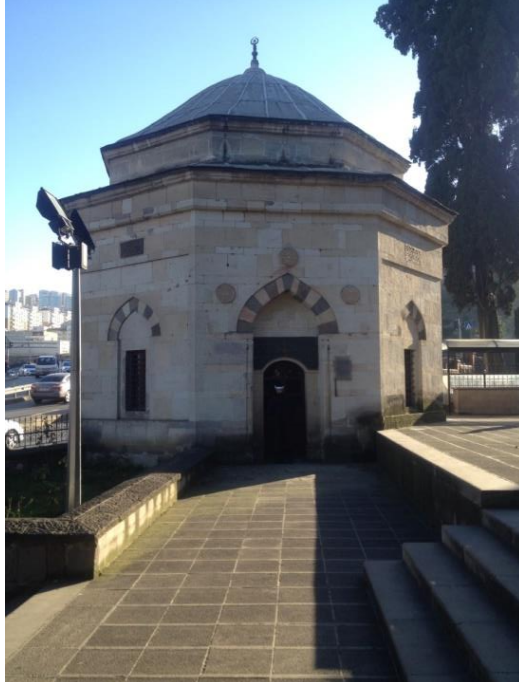
Resim 7: Gülbahar Hatun Türbesi, 2021 (Özkan Özer Keskin)