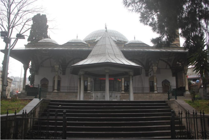
Resim 8: Gülbahar Hatun Camii ve Şadırvan, 2021