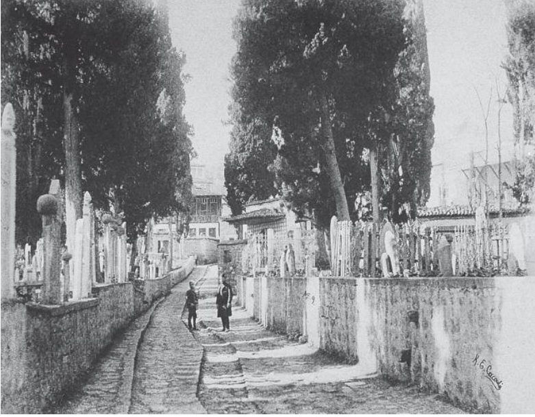
Resim 5: İmaret Mezarlığı'nın İçinden Geçen Yol 152 (Albayrak, a.g.e., s. 72)