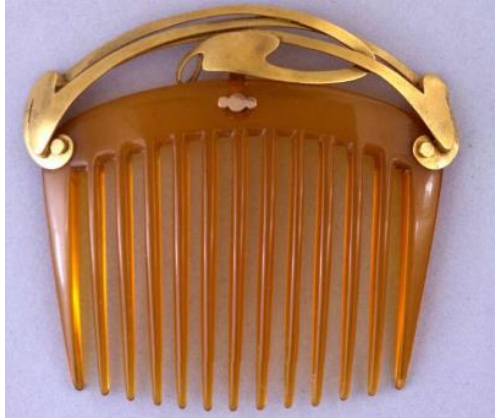
Resim 1: Saç Tarağı, 19. Yüzyıl, Weimar-Almanya, British Müzesi.