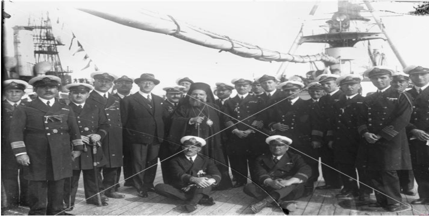
Resim 1-Gemi mürettebatı-1924