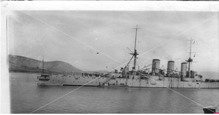
Resim 2-Averof bir görevde iken-1929

Vasilikiotou, M. (2021). Savaşta ve Barışta Bir Yunan Gemisi: Averof-Yunan Kaynakları Üzerinden Bir Analiz. ANKARAD, 2(3), 55-88.