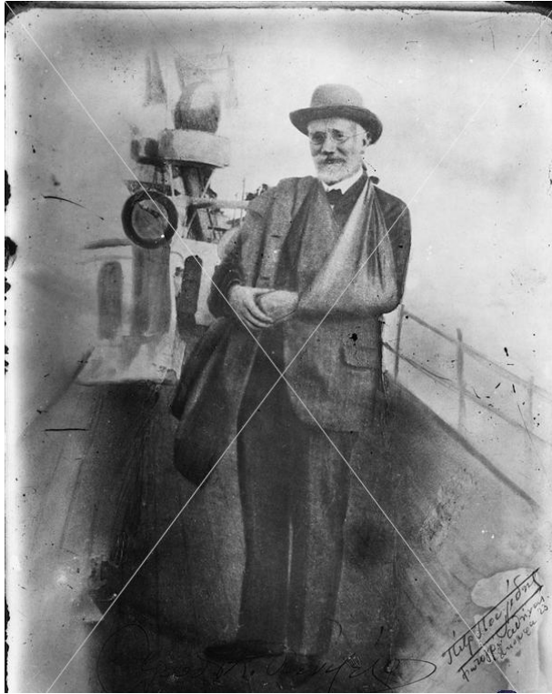
Resim 3-Venizelos Averof'un güvertesinde-1912