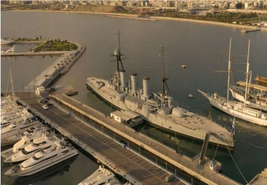
Resim 7-Averof, Pire Limanı'nda-2020