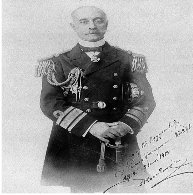
Resim 6-Amiral Kountouriotis