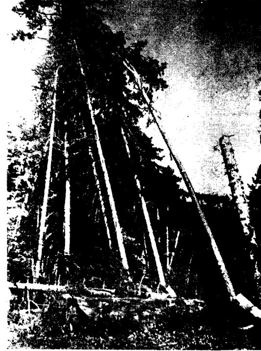
Şekil: 3 Zelzele neticesinde devrilirken tepe çatıları yekdiğerine yaslanan diğer bir göknar ve çam topluluğu. (Karabük: Soyuk ormanları 1947)

Abb. 3: Tannen- und Kieferngruppe nach dem Erdbeben.