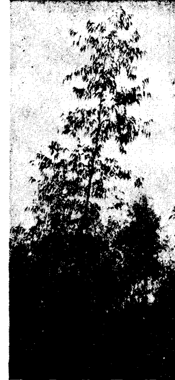
Resim : 1

2. dereceden dallar, I. dereceden sürgünler üzerinde Divergenz'leri 1/3 olacak şekilde sarmal dizilmiş uzun saplı ve az veya çok düşey olarak sarkan yaprakların koltuğunda bulunur. Fakat I. dereceden yan sürgünlerin yapraklarının koltuğunda, ana eksenden itibaren hemen 2. dereceden dal teşekkülü görülmez. Bunlara ancak 7 inci, hatta 10 uncu yapraktan itibaren raslanır. 2. dereceden dallarda teşekkül eden ilk yaprak çifti, diğer yapraklardan farklı bir şekilde sürgün üzerinde sarmal değil, karşılıklı olarak yer alır ve münhasıran dalın iki tarafında (amphitonie)