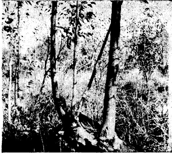
Resim : 4

Resim: 4'de ise kesilmiş bir gövdenin geride kalan kütüğü üzerinde yara dokusundan gelişen adventif sürgünler görülmektedir. Sürgünler burada buldukları yerin tabiatına tabi olarak (topophysis) plagiotrop değil, bil'akis ortotrop olarak büyümekte ve köke yakın olan sürgün daha fazla bir boy ve kalınlık büyümesi göstermektedir.