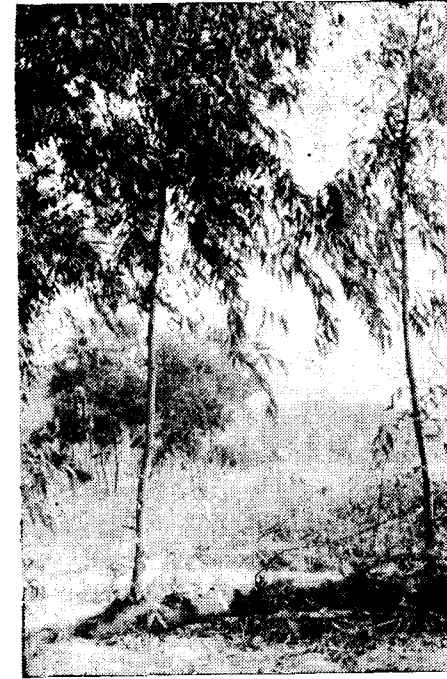
Resim : 3

Normal dal teşekkülünden ayrı olarak, bahis konusu Okalıptüs türü yara yerlerinde, kallus dokusundan adventif ve uyuyan gözler'den geli- şen preventif sürgünler husule getirmeye de kabiliyetlidir. Böyle sürgün- ler (yapışık dal, su sürgünü) diğer bazı yapraklı ağaçlarda da görüldüğü üzere (3), normal yan dallar gibi plagiotrop değil, yukarı yönelen, yani ortotrop bir büyüme gösterirler.