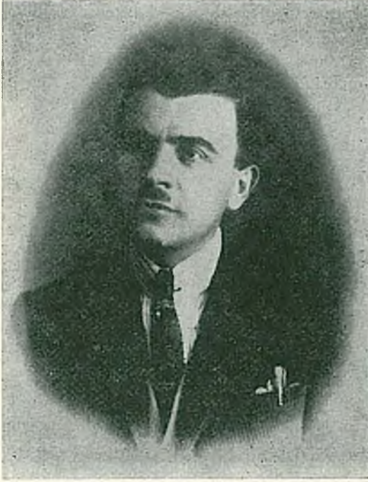
Berlin - Dahlem'de bulunduğu yıllarda

tarihinde orman genel müdürlüğü amenajman heyetinde işletme müfettişi olarak görev almış ve bu görev 1918 mayısına kadar devam etmiştir. 1918 mayıs ayından itibaren 3000 kuruş maaşla orman mektebi alisinde orman koruma ve dendrometri muallimliğine tayin edilmiştir. Ders nazırı Mr. Bavere'in asistanlığını yapmıştır. Daha sonra 12 nisan 1924 tarihinde bu okulda Silvikültür ve Teknoloji muallimliğine naklen tayin edilmiş, bir ay kadar sonra da Ziraat Vekâleti Orman Genel Müdürlüğü Fen Müşavirliğine atanmıştır. Bu görevi kısa sürmüş ve tekrar Orman Mektebi Âlisine Ormancılık İktisadiyatı muallimliğine nakledilmiştir. 1 Haziran 1925 tarihinde 4000 kuruş maaşa terfi etmiş