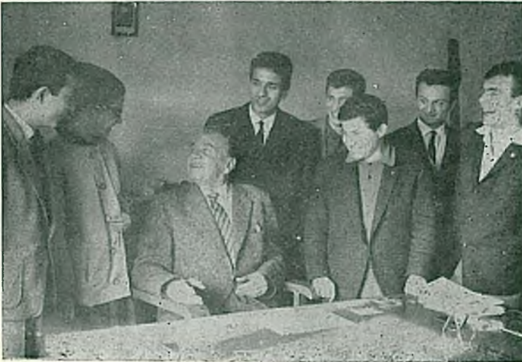
Son yıllarda Almanca Okutmanlığı yaparken, öğrencileriyle.

rihleri arasında 15 er ay, 1956 tarihinde 6 ay süre ile Almanya'da bulunmuştur. Bunlardan ayrı olarak 1954 yılında Roma'daki Milletlerarası Ormanlık Kongresine ve aynı yıl Paris'teki Botanik Kongresi-