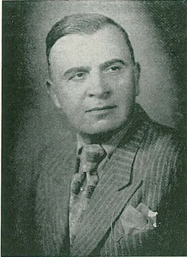
Ankara Y.Z.E. Rektörlüğü sırasında