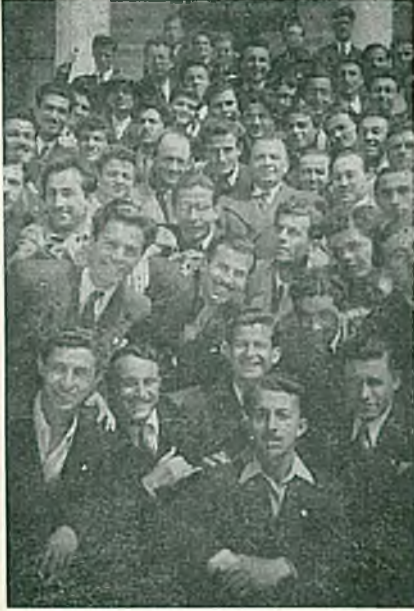
1947 yılında 2. sınıf öğrencileriyle bir tatbikat sırasında.