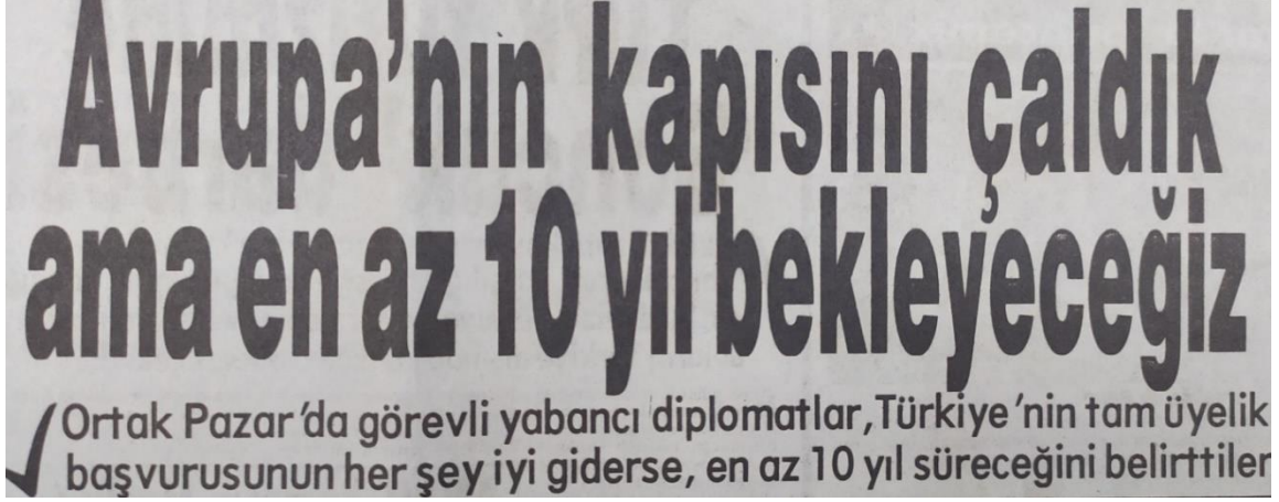
Görsel 3. “Avrupa’nın Kapısını Çaldık Ama En Az 10 Yıl Bekleyeceğiz”

layısıyla başvuru sonrasında genel manada bir temkinli yaklaşımdan söz etmek mümkündür.