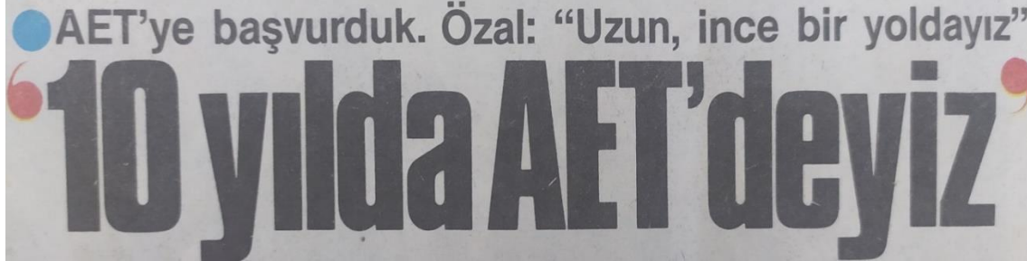
Görsel 2. “10 Yılda AET'deyiz”

Bu paylaşımda yer alan ABD Kongresi'nde karşılaşılan zorluklar hatırlatması, bir bakıma gelişmenin dengeleyici boyutu olarak da değerlendirilebilir. İlgili haberde, Özal'ın sürecin zorluğuna dair yapmış olduğu vurguya dikkat çekilmektedir. Bu zorlu sürecin on yıl içerisinde nihayete ereceği ve tam üyelik ile sonuçlanacağı da paylaşılan argümanlar arasında yer almaktadır. Nitekim 15 Nisan 1987 tarihli Milliyet gazetesinin ilk sayfasında bu detaya yer verilmektedir: