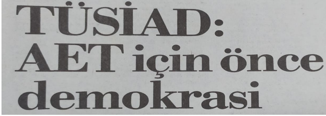
Görsel 4. TÜSİAD: AET İçin Önce Demokrasi”