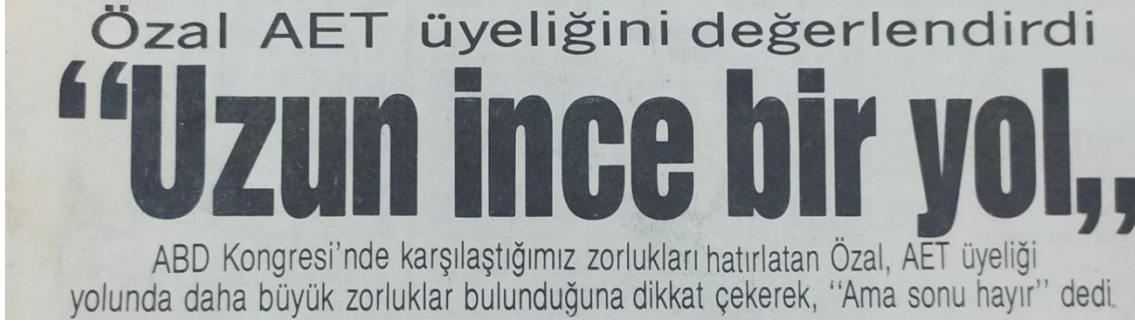
Görsel 1. “Özal AET Üyeliğini Değerlendirdi: ‘Uzun İnce Bir Yol’