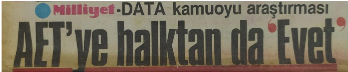
Görsel 5. “AET’ye Halktan da ‘Evet’”

Dördüncü olarak kamuoyunun yaklaşımına dair, Milliyet gazetesi 16 Nisan 1987 tarihli bir perspektif sunmaktadır. Buna göre DATA Kamuoyu Araştırması’nın yapmış olduğu araştırma sonucunda “AET’ye halktan da ‘Evet’” manşetine yer verilmiştir (bkz. Görsel 5). Anket, Türkiye’de her 100 kişiden 61’inin Avrupa Ekonomi Topluluğu’na üyeliği onayladığını göstermiştir. Yine her yüz kişiden %19,1’i hayır, %19,8’i fikrim yok yanıtını vermişlerdir. (Milliyet, 16 Nisan 1987: 1).