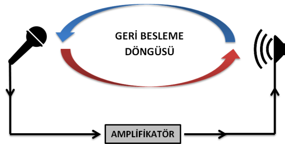
Görsel 2: Larsen Etkisi; mikrofon sosyal medya kullanıcılarına, amplifikatör sosyal medya platformuna, hoparlör benzer görüşlerin rezonansına karşılık gelmektedir.

Öte yandan, internetin kaotik yapısına da değinen Baudrillard (2015a, s. 70), internetle birlikte "birbirinden farklı şeylerin birbirine karıştığını" dile getirmekte ve bir bağlam sorununun ortaya çıktığını belirtmektedir. "Mesafeleri ortadan kaldıran internet" in aynı oranda "mesafe bilinci"ni de yok ettiğini ve bunun kimliği esas alan belirsiz bir özneliğin sonucu olduğunu vurgulamaktadır. Bu bağlamda Baudrillard'ın "Larsen Etkisi" olarak tanımladığı internet, interaktif iletişim çığırının bir sonucu olarak kimlik temelinde herkesin birbiriyle etkileşime geçtiği ve kendi kendisine rezonanslarda bulunduğu bir iletişim atmosferini üretmiştir. Gösterinin yok olmasının aksine herkesin katıldığı bir şenliğe dönüştüğüne işaret eden Baudrillard (2015a, s. 72), internetle ilgili olarak şu soruyu sormaktadır: "Herkesin oyuncu olduğu bir yerde eylem diye bir şey söz konusu olabilir mi?"