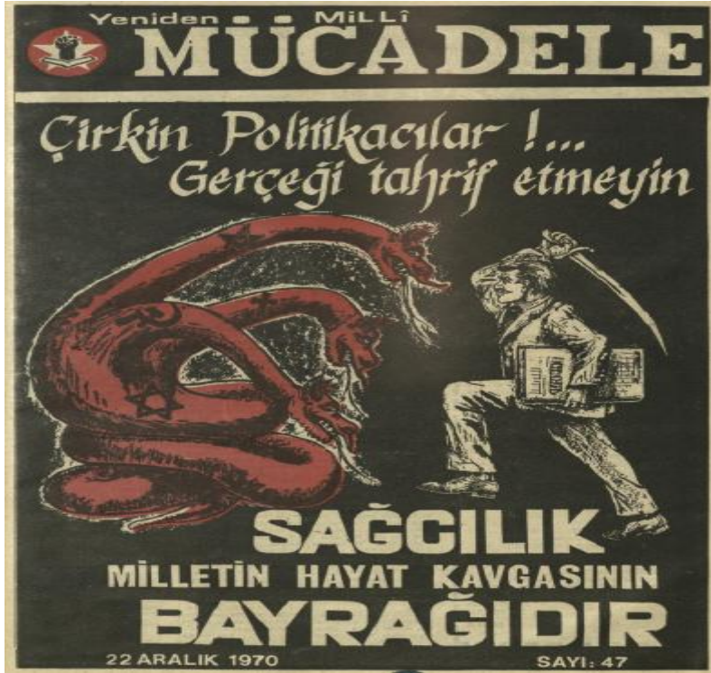
Ek 3. Yeniden Millî Mücadele Dergisinin Örnek Bir Kapak Kompozisyonu