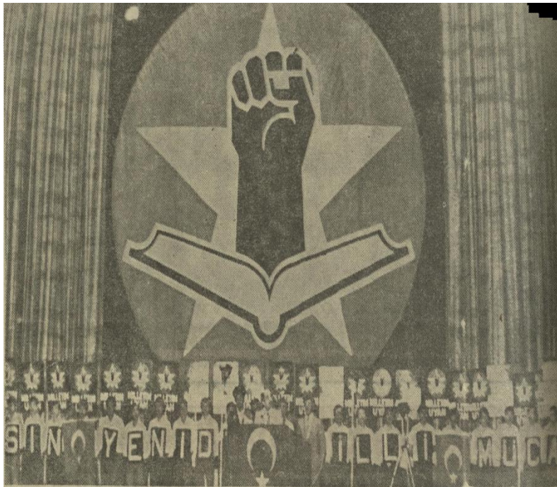
Ek 4. Yeniden Millî Mücadele Hareketinin Amblemi