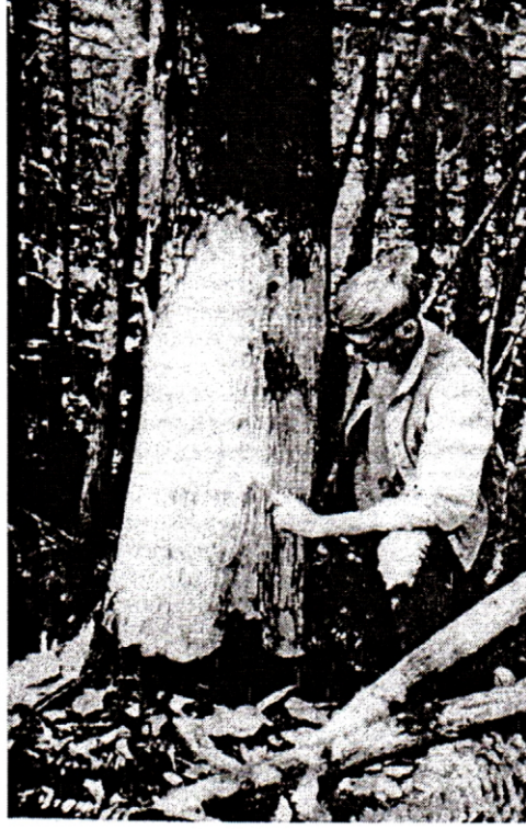
Resim 2: Aç kalan bir Bozayı'nın ağaç kabuğunda meydana getirdiği zarar (GRANGE 1937).

Bozayı ( Ursus arctos L.) (Ursidae) yeterince gıda bulamadığı kış aylarında Ladin ve ender olarak da Göknar ve Çamların kabuklarında dişleriyle odun kısmına kadar ulaşan yaralar açar ve eski soyma yaralarından çıkan reçineleri yalar (ÇANAKÇIOĞLU 1985).