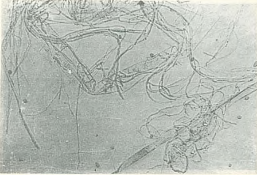
Şekil 4. Trichoderma pseudokoningii Rifai'nin konidiforları, fiyalidleri ve sportarı ( x 200).