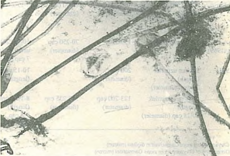
Şekil 1. Rhizopus nigricans Ehrenberg'in sporangium ve sporları ( x 75). Fig. 1. Rhizopus nigricans Ehrenberg - sporangia and spores ( x 75).

PDA + streptomisin kültür ortamında Tilia argentea Desf.'in diri odunundan Rhizopus nigricans Ehrenberg ve Chrysosporium inops Carmichael türleri izole edilmişlerdir (Tablo 1). Bu türler odunun sudaki ekstraksiyonu sonucunda süzüntüden elde edilen yongalar üzerinde büyümüşlerdir. Fakat izole edilen türler iç kabuk + diri odun + öz odun ekstraktı + agar + streptomisin, diri odunun nötraliye edilmiş % 1'lik NaOH'deki ekstraktı + agar + streptomisin ve diri odunun nötraliye edilmiş % 1'lik NaOH'deki ekstraktı + PDA + streptomisin üzerinde gelişmemiştir. Aynı türler daha önce Tilia argentea Desf.'in kabuğundan izole edilmişlerdir (ÇOLAKOĞLU 1990).