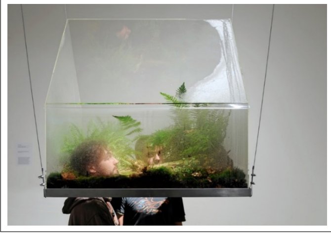
Görsel 9. Vaughn Bell, Bir Büyük Ev (One Big House) , 2009

tespit edilmiştir. Bu nedenle; Moray Laboratuvarı, pişmiş toprak kanalizasyon künkleri ve Şamran kanalı gibi uygulamaların insanoğlunun doğayla uyum içinde yaşama iradesini ve sürecini gösterebildiği örneklerdendir.