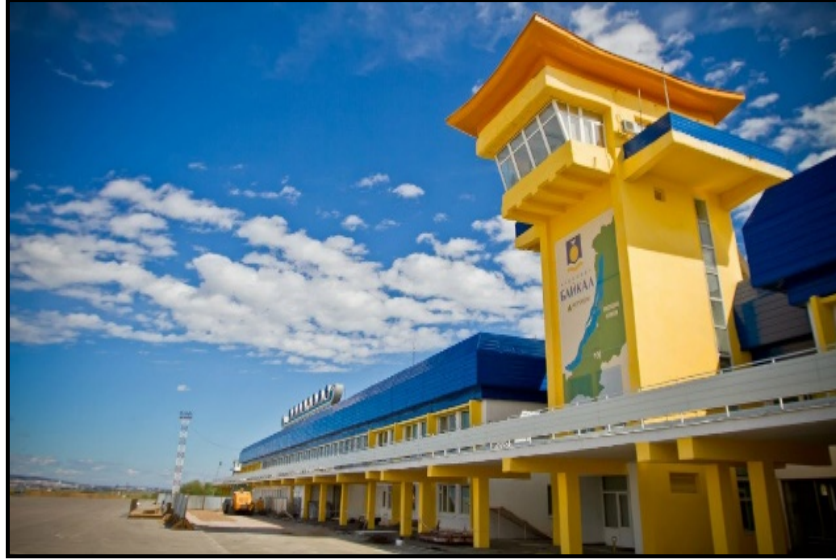
Foto 10: Ulan-Ude kentinde yer alan Uluslararası Baykal Havaalanı 53

Başkent Ulan-Ude'nin 15 kilometre batısında yer alan "Baykal Hava Alanı" (Foto 10), Buryat Cumhuriyeti'nin tek uluslararası hava alanıdır. Baykal Hava Alanı'ndan kalkan uçaklar Türkiye, Tayland, Vietnam, Çin ve daha birçok ülkeyle hava taşımacılığını sağlamaktadırlar. Başkent Ulan-Ude ile Rusya'nın diğer büyük kentleri arasındaki hava ulaşımında Baykal Hava Alanı'nın hayati önemi vardır. Ayrıca Baykal Hava Limanı, Buryatya topraklarında yer alan birçok yöreye iç hatlar aracılığıyla da hava ulaşım desteği sağlamaktadır. Hava alanı yılda ortalama 300000-350000 insana hizmet vermektedir.