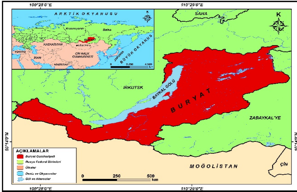
Harita 1: Buryat Cumhuriyeti Lokasyon Haritası

Rusya'da sekiz Federal İdari Bölge yer almaktadır ve bunlar arasında en büyük yüzölçümüne sahip olanı Uzakdoğu Federal İdari Bölgesi'dir 3 . Rusya topraklarının % 41'ini tek başına oluşturan Uzakdoğu Federal İdari Bölgesi'nin toplam yüzölçümü 6952555 km 2 , yani neredeyse Türkiye'nin 9 katı büyüklünde bir alan kaplamaktadır. Rusya topraklarının ancak % 2'sini oluşturmakta olan BC, Uzakdoğu Federal İdari Bölgesi sınırları içinde ve Doğu Sibirya'nın güney kesimlerinde yer almaktadır. 4 Demiryollarıyla, başkent Ulan-Ude ile Moskova kenti arasında 5519 kilometrelik mesafe, ayrıca Büyük Okyanus kıyıları ile 3500 kilometrelik mesafe Merkezi Rusya'dan uzaklığını ve Pasifik havzasından coğrafi kopukluğunu gayet iyi yansıtmaktadır. 5