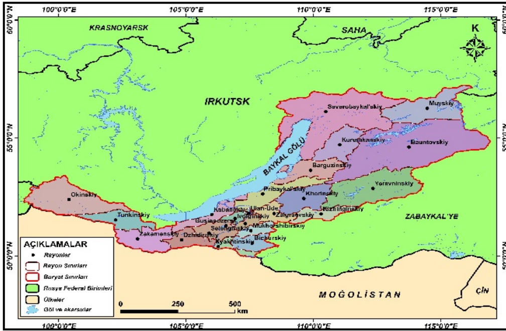
Harita 2: Buryat Cumhuriyeti'nin İdari Yapısı

Rusya Federasyonu sınırları içinde yeni idari yapılanmalar yapılırken, 2000 yılında BC Sibirya Federal Bölgesi sınırları içinde yer almıştır. 3 Kasım 2018 tarihinde Buryatya bu kez Uzakdoğu Federal İdari Bölgesi sınırları içinde yer almıştır. Ekonomik bölgelerin coğrafi kapsamına bakıldığında, 2019 yılına kadar Doğu Sibirya İktisadi Bölge sınırları içinde yer alan Buryatya, 2019 yılından itibaren Uzakdoğu İktisadi Bölge 11 sınırları içinde yer almaya başlamıştır. Bugün, idari yapılanma bakımından Buryatya 21 rayon 12 (il) ve 2 kentsel idari yönetim biriminden oluşmaktadır (Tablo 1, Harita 2). Ulan – Ude ve Severobaykalsk şehirleri, “Gorodskih Okrug” 13 olarak adlandırılan kentsel idari yönetim alanları oluşturmaktadırlar. Bunların dışında Cumhuriyet sınırları içinde 6 kentsel yerleşme, 12 kasaba ve 615 kırsal yerleşme yer almaktadır. Cumhuriyet sınırları içinde ve kamu kurumlarında Rusça ve Buryatça resmi diller olarak kabul edilmektedirler. 14