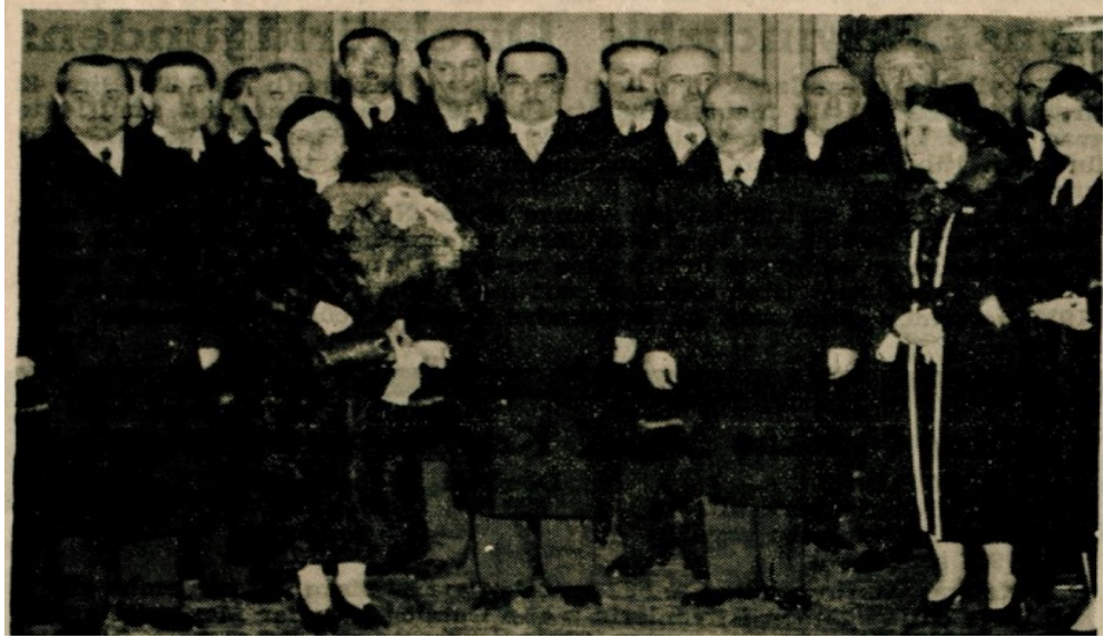
EK-5: İsmet İnönü ve Türk Heyeti Yugoslav Heyetiyle birlikte (Cumhuriyet, 14 Nisan 1937).