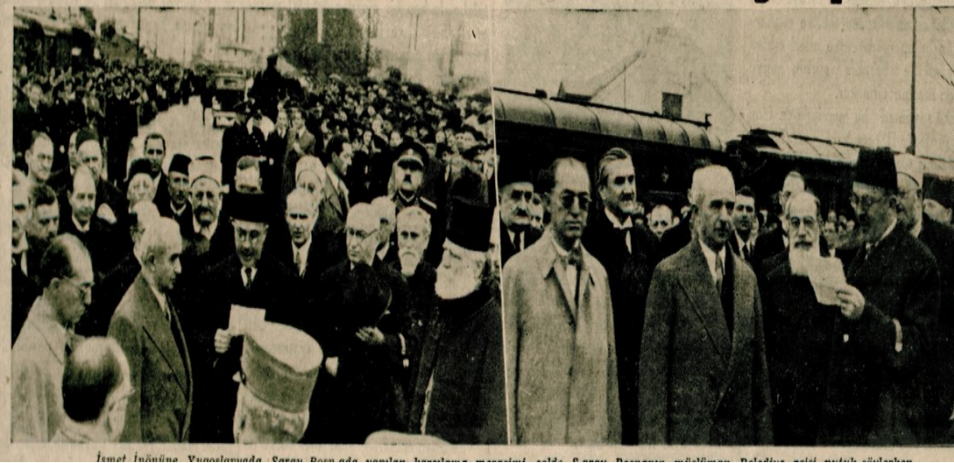
EK-7: ismet İnönü Yugoslavya'da Saraybosna'da karşılama merasimi, solda Saraybosna'nın Müslüman Belediye Reisi nutuk söylerken (Cumhuriyet, 21 Nisan 1937).