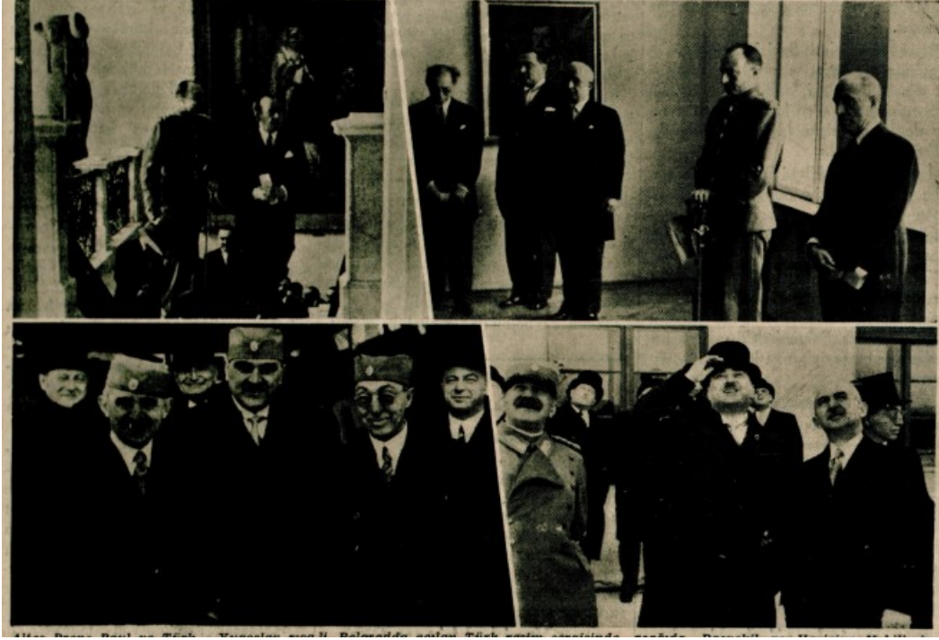
EK-6: Altes Paul ve Türk- Yugoslav ricali, Belgrad'da açılan Bir Resim sergisinden, aşağıda İsmet İnönü ve Tefik Rüştü Aras Belgrad tayyare meydanından,Stoyadinoviçle. (Cumhuriyet, 17 Nisan 1937)