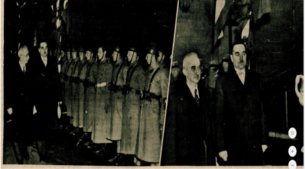
EK-4: İsmet İnönü'nün Milan Stoyadinoviç'le Yugoslav askerleri Selamlarken (Cumhuriyet, 14 Nisan 1937).